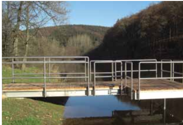
Barrierefreier Angelsteig Wascheid.

Im Rahmen des Gesamtkonzeptes „Eifel barrierefrei“ wurden barrierefreie Anglerstege errichtet, die durch besondere bautechnische Maßnahmen wie rutschhemmende, ebene Oberfläche, Geländer, ausreichende Breite von Zuwegung und Plattform u.a.m. speziell auf die Bedürfnisse von Menschen mit Mobilitätseinschränkung abgestimmt sind.