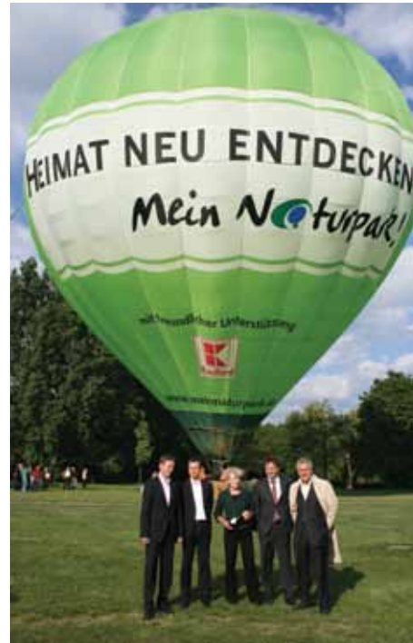
Taufe des Heißluftballons in der Bonner Rheinaue.

Jean Pütz setzt sich als Pate der Narzissenwiesen für diese regionale Besonderheit ein: „Als Pate der Eifeler Narzissen kann ich nur jeden einladen, diese wunderbare Landschaft im Naturpark zu besuchen und deren Schönheit zu genießen.“