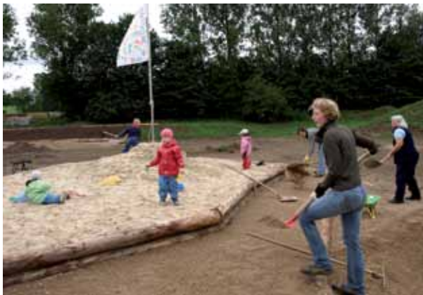
Viele Bürger beteiligen sich an den Bauarbeiten am „Generationenpark“ in Dahlem-Schmidtheim.

Das Regionalmanagement hat einen Arbeitskreis „Generationenplätze“ im Maßnahmenbereich „Eifeler Lebens- und Arbeitswelt“ initiiert. Ziel war die Schaffung neuartiger, dem demographischen Wandel in der Eifel angepasster öffentlicher Plätze, welche generationenübergreifend Aufenthalt, Aktivitäten und Kommunikation ermöglichen. Der Arbeitskreis hat Projektauswahlkriterien definiert.