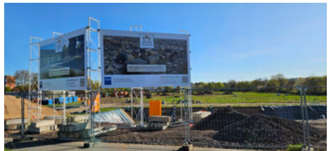
In Dransdorf beginnen die Bauarbeiten für das GROOTE Quartier

Damit wir weiter Wohnraum schaffen können, wollen wir in Bonn den „Bau-Turbo“ einschalten, den die letzte Bundesregierung initiiert und die neue Regierung beschlossen hat. Damit werden die Genehmigungsverfahren vor allem für kleinere und mittlere Bauprojekte deutlich beschleunigt. Sie können innerhalb von 4 Monaten an Stelle von Jahren abgeschlossen werden.