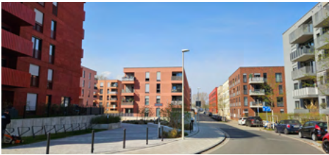
Am Probsthof ist die "Westside" fast fertig

Im Bonner Westen geschieht hier sehr viel. Am Probsthof ist das Projekt „Westside“ fast fertig, teils auf ehemaligem Industriegelände. Über 500 Miet- und Eigentumswohnungen wurden errichtet. Sie sind allerdings recht teuer. Direkt nebenan in Richtung der Siemensstraße entsteht der Vogelsang , ein neues urbanes Wohnquartier mit etwa 300 Wohnungen. Rund die Hälfte ist öffentlich gefördert, also für Menschen mit Wohnberechtigungsschein. Für diese neuen Bewohner*innen werden auch eine achtgruppige Kita gebaut sowie Gastronomie- und Gewerbeflächen.