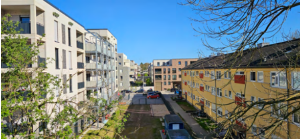
Neue Wohnungen sind am Vogelsang errichtet worden

Im Bonner Westen geschieht hier sehr viel. Am Probsthof ist das Projekt „Westside“ fast fertig, teils auf ehemaligem Industriegelände. Über 500 Miet- und Eigentumswohnungen wurden errichtet. Sie sind allerdings recht teuer. Direkt nebenan in Richtung der Siemensstraße entsteht der Vogelsang , ein neues urbanes Wohnquartier mit etwa 300 Wohnungen. Rund die Hälfte ist öffentlich gefördert, also für Menschen mit Wohnberechtigungsschein. Für diese neuen Bewohner*innen werden auch eine achtgruppige Kita gebaut sowie Gastronomie- und Gewerbeflächen.