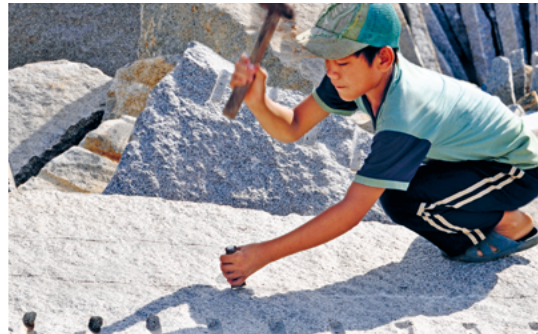
Zwangsarbeit hat viele Gesichter – und findet sich u.a. in ausbeuterischer Kinderarbeit.

Die Zwangsarbeitsverordnung der EU setzt hier im europäischen Markt an. Produkte, die mit Zwangsarbeit hergestellt wurden, sollen nicht im europäischen Markt gehandelt werden. Das heißt, sie dürfen hier nicht verkauft werden. Falls sie schon im Verkaufsregal gelandet sind, müssen sie entfernt werden. Die Idee ist klar: Wer von Zwangsarbeit profitiert, soll damit in Europa kein Geld verdienen können. Es geht darum, den Handel mit Waren aus Zwangsarbeit zu stoppen. Wenn Behörden den Verdacht haben, dass ein Produkt mit Zwangsarbeit verbunden ist, werden sie aktiv. Sie üben auch Druck