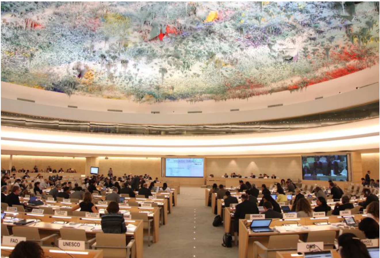
Sitzung des Menschenrechtsrats der Vereinten Nationen

Am Ende ist die wichtigste Empfehlung: Regeln müssen ernst genommen werden. Sie müssen in den Alltag von Unternehmen einfließen – und damit Betroffene schützen. Und sie müssen dazu beitragen, dass Produkte in Europa nicht auf Ausbeutung, Zwangsarbeit oder Zerstörung der Umwelt beruhen. ♦