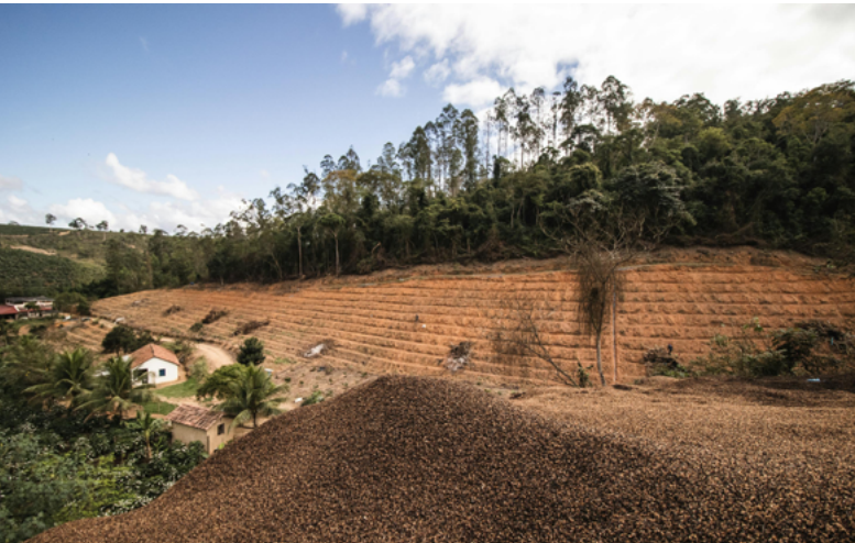
Für die landwirtschaftliche Nutzung wird Wald gerodet, hier in Brasilien.

Die EU-Entwaldungsverordnung richtet sich gegen Abholzung und Waldschädigung. Bestimmte Produkte sollen nur noch dann auf dem europäischen Markt verkauft werden, wenn sie nicht mit Entwaldung verbunden sind. Das ist wichtig, da 90 % der weltweiten Entwaldung auf Grund der Produktion landwirtschaftlicher Produkte erfolgt. Europa gehört dabei zu den größten Abnehmern dieser Erzeugnisse. Zu den Waren, für die Wälder abgeholzt werden und die unter das Gesetz fallen, gehören Holz, Rindfleisch, Soja, Kaffee, Kakao, Palmöl und Kautschuk.