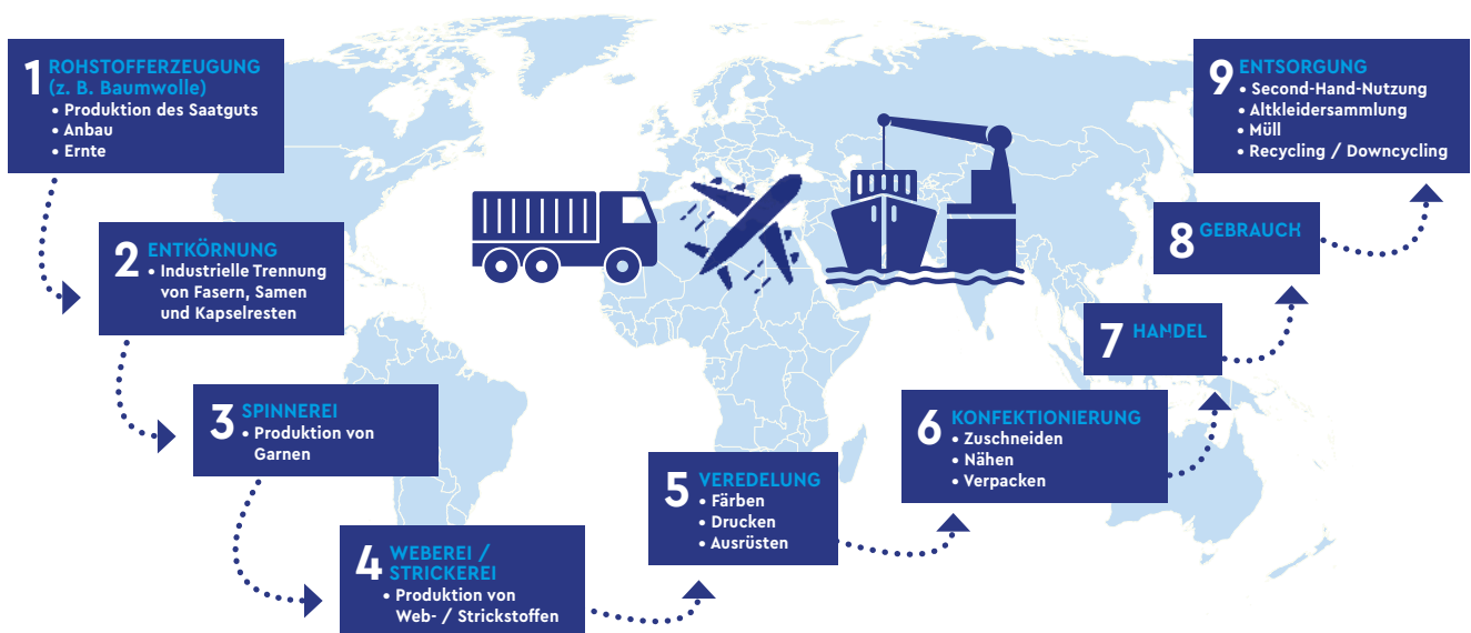
GRAFIK: DIE TEXTILE LIEFERKETTE

Wegen der Qualität der Produkte oder der Gesundheit der Verbraucher*innen haben Unternehmen ihre Lieferkette oft bereits im Blick. Sie müssen