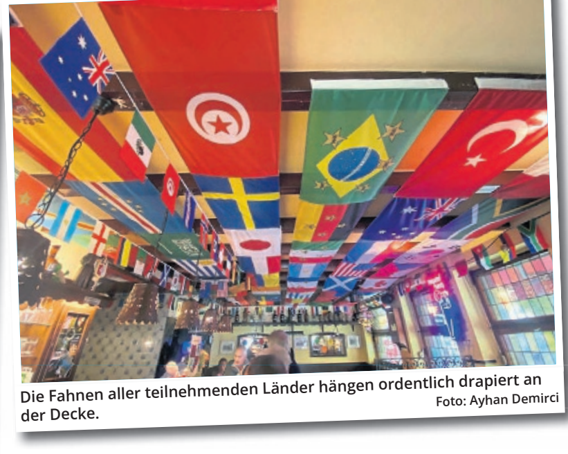
Die Fahnen aller teilnehmenden Länder hängen ordentlich drapiert an der Decke.