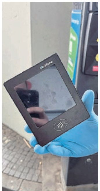
Ein manipuliertes Kartenlesegerät an einem Parkscheinautomaten.

Die Polizei rät, Parkautomaten vor dem Bezahlen auf bauliche Veränderungen zu überprüfen. Im Zweifel sollte man mit Bargeld oder über offizielle Park-Apps bezahlen und den Automaten nicht nutzen, wenn etwas ungewöhnlich erscheint. Wenn der Automat verdächtig erscheint, sollte der Parkplatzbetreiber informiert werden. Bei verdächtigen Kontobewegungen sollten Betroffene sofort ihre Bank kontaktieren und Anzeige bei der Polizei erstatten. (red)