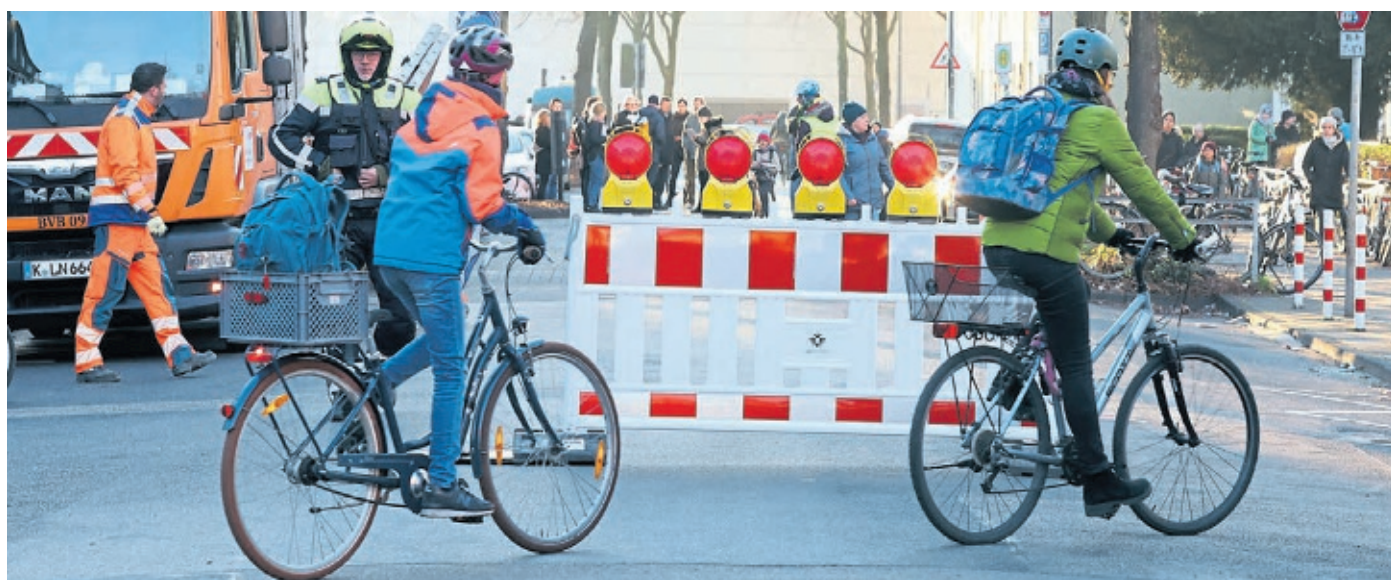
Eine der bislang vier Kölner Schulstraßen befindet sich in der Lindenbornstraße (Vincenz-Statz-Grundschule).

Derzeit gibt es vier Schulstraßen in Köln, die sich an der Vincenz-Statz-Grundschule in Ehrenfeld, der Maria-Montessori-Schule in Ossendorf, der Rosenmaarschule in Höhenhaus und an der Grundschule Diersterwegstraße in Brück befinden.