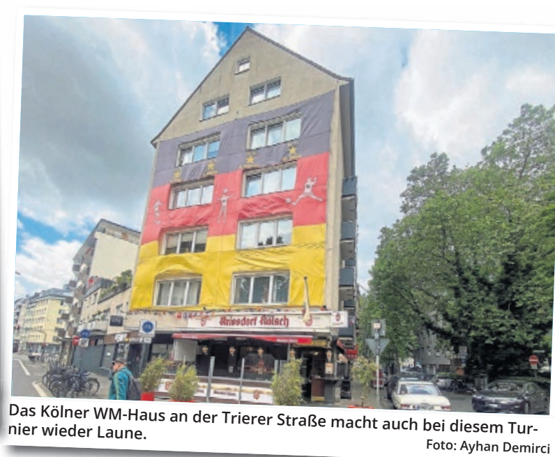
Das Kölner WM-Haus an der Trierer Straße macht auch bei diesem Turnier wieder Laune.