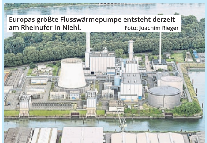
Europas größte Flusswärmepumpe entsteht derzeit am Rheinufer in Niehl.

Die Vorbereitungen auf dem Gelände am Niehler Hafen laufen bereits seit Monaten. Neben Kampfmittelsondierungen und Gründungsarbeiten wurden wichtige Komponenten wie Verdichter und Getriebe gefertigt. Mit dem Start der Hochbauarbeiten beginnt nun die zentrale Umsetzungsphase. Dank der direkten Anbindung an das Stromnetz sowie an das größte Fernwärmenetz der Rheinenergie bietet der Standort Niehl ideale Voraussetzungen für den Betrieb der Anlage.