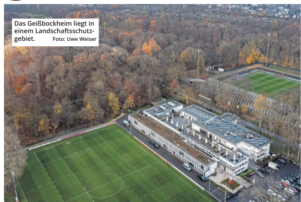
Das Geißbockheim liegt in einem Landschaftsschutzgebiet.

Köln. Es ist der nächste Nackenschlag für den 1. FC Köln. Das Thema Geißbockheim-Ausbau wird sich erneut hinausziehen. Ob es jemals eine Lösung gibt, steht in den Sternen. Als Begründung für die Absage des Termins gab das Gericht an: „Am heutigen Nachmittag ist eine Stellungnahme der Antragsteller zu Artenschutzfragen eingegangen, die weitere Aufklärung erfordert.“ Aus zwölf Jahren werden jetzt deutlich mehr! Wann ein neuer Termin stattfindet, ist aktuell nicht klar. Hinter der Klage aus dem Jahr 2020 stehen die Bürgerinitiative „Grüngürtel für alle“ (BI) und der BUND NRW. Auf Anfrage bezeichnete Friedmund Skorzewski von der BI das Gutachten als einen „Hammer“. Es sei erst kurzfristig verfügbar gewesen und sei dann sofort von den Rechtsanwälten vorgelegt worden.