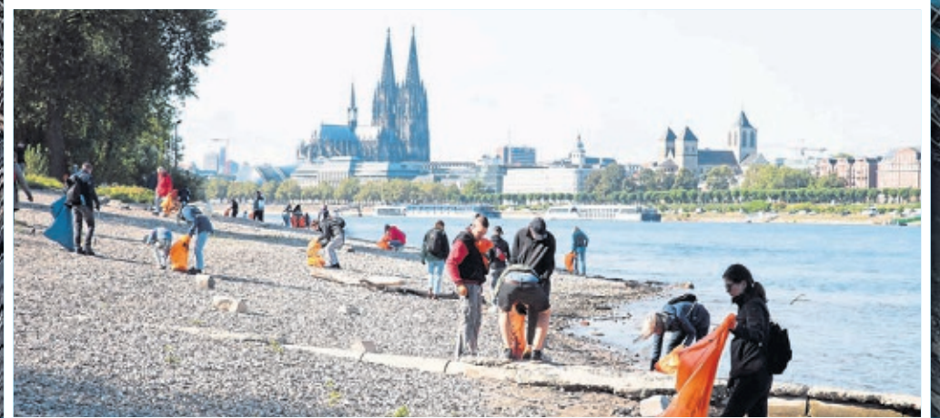
Regelmäßig reinigen Helfer der K.R.A.K.E auch die Rheinpromenade auf beiden Seiten des Rheins.