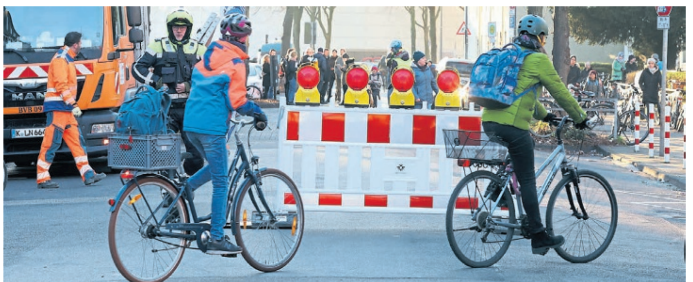
Eine der bislang vier Kölner Schulstraßen befindet sich in der Lindenbornstraße (Vincenz-Statz-Grundschule).

Derzeit gibt es vier Schulstraßen in Köln, die sich an der Vincenz-Statz-Grundschule in Ehrenfeld, der Maria-Montessori-Schule in Ossendorf, der Rosenmaarschule in Höhenhaus und an der Grundschule Dieselwegstraße in Brück befinden.