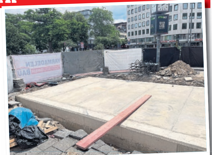
Die Platten aus Beton sind sehr massiv ausgeführt.

massiv erscheinen, sind diese nicht fest mit dem Bestandsbauwerk verankert. Die Fertigteilplatten sind aufgelegt und lediglich kraftschlüssig mit den Wänden vergossen worden, so dass sich die Verbindung wieder zurückgebaut werden kann.