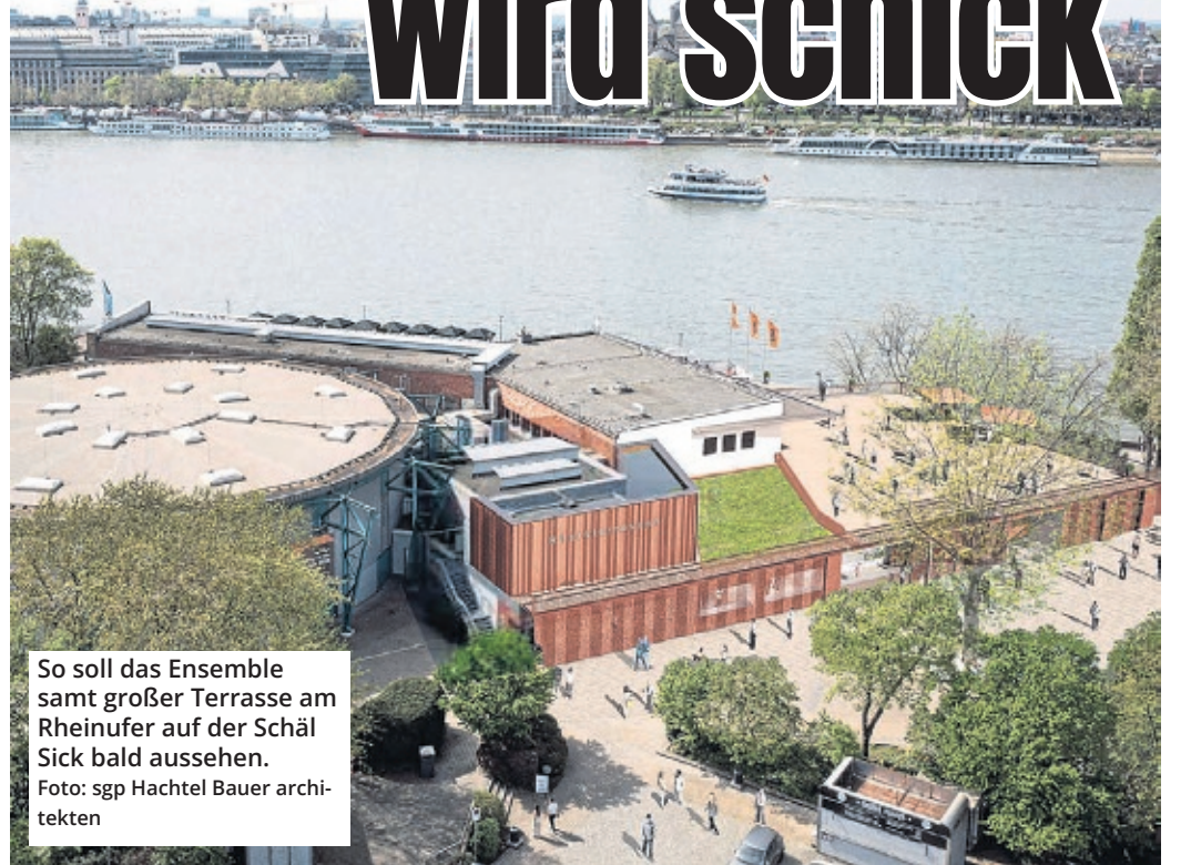
So soll das Ensemble samt großer Terrasse am Rheinufer auf der Schäl Sick bald aussehen.

Gerade erst wurde das Open-Air-Gelände im Tanzbrunnen nach umfangreicher Modernisierung wieder in Betrieb genommen, da steht schon das nächste Großprojekt vor der Tür. In den Rheinterrassen, dem Theater am Tanzbrunnen und vor allem auf dem Gelände drumherum wird sich einiges tun.