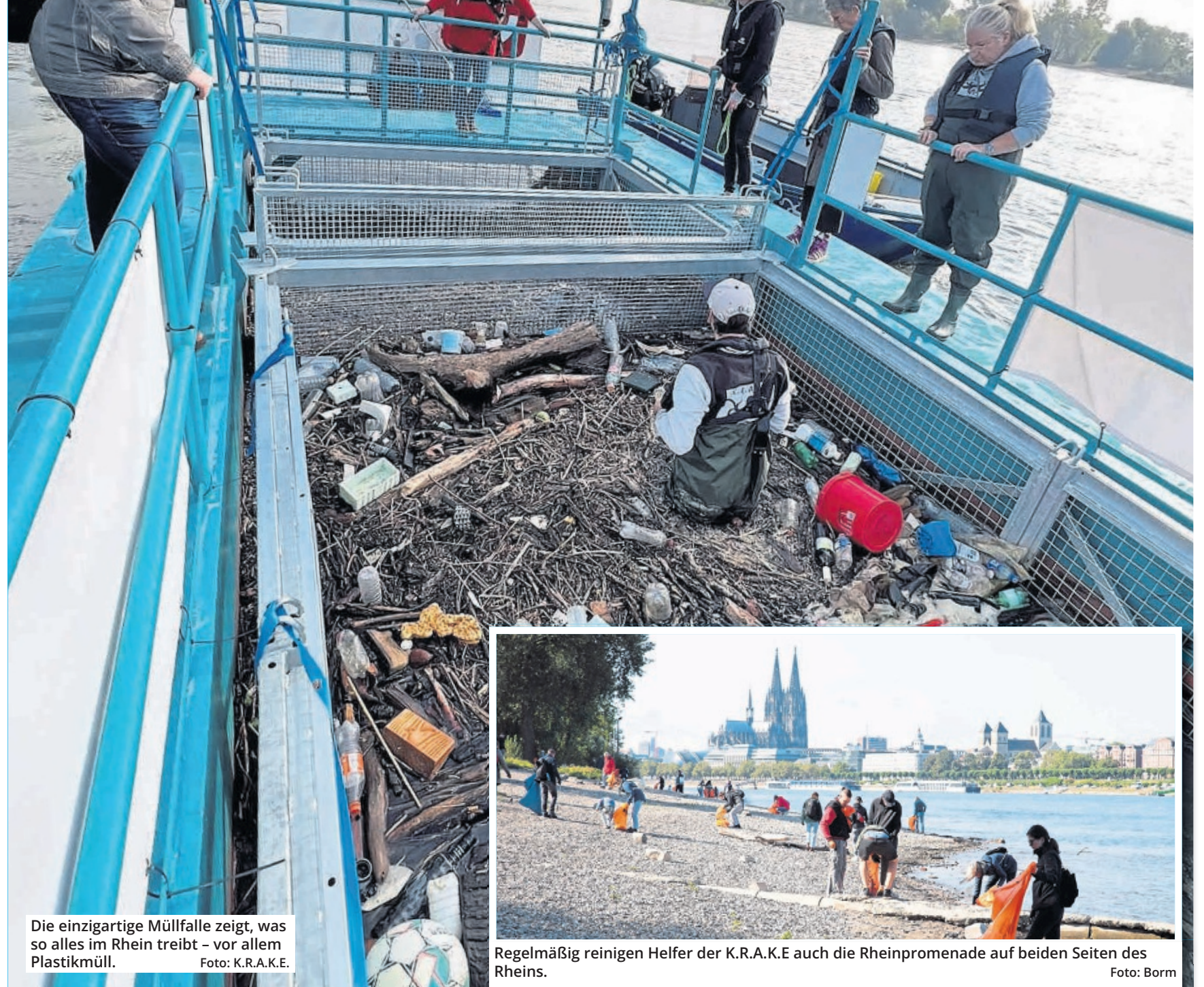
Die einzigartige Müllfalle zeigt, was so alles im Rhein treibt - vor allem Plastikmüll.