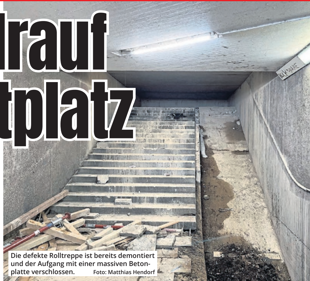
Die defekte Rolltreppe ist bereits demontiert und der Aufgang mit einer massiven Betonplatte verschlossen.

Durch das Abriegeln sollen die dunklen Ecken entfernt werden, in denen unter anderem Dealer Drogen verkaufen können. Die Zugänge haben Treppen und defekte Rolltreppen, die teils zu Kunstwerken umgestaltet worden wa-