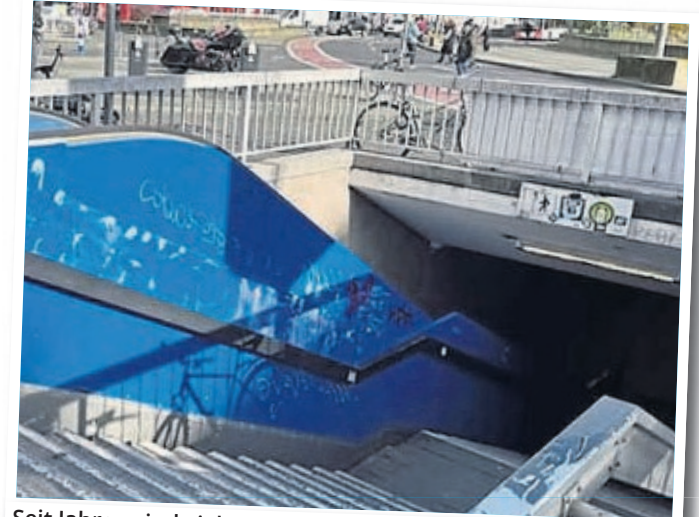
Seit Jahren sind viele der Rolltreppen defekt und außer Betrieb, diese werden nun entfernt.