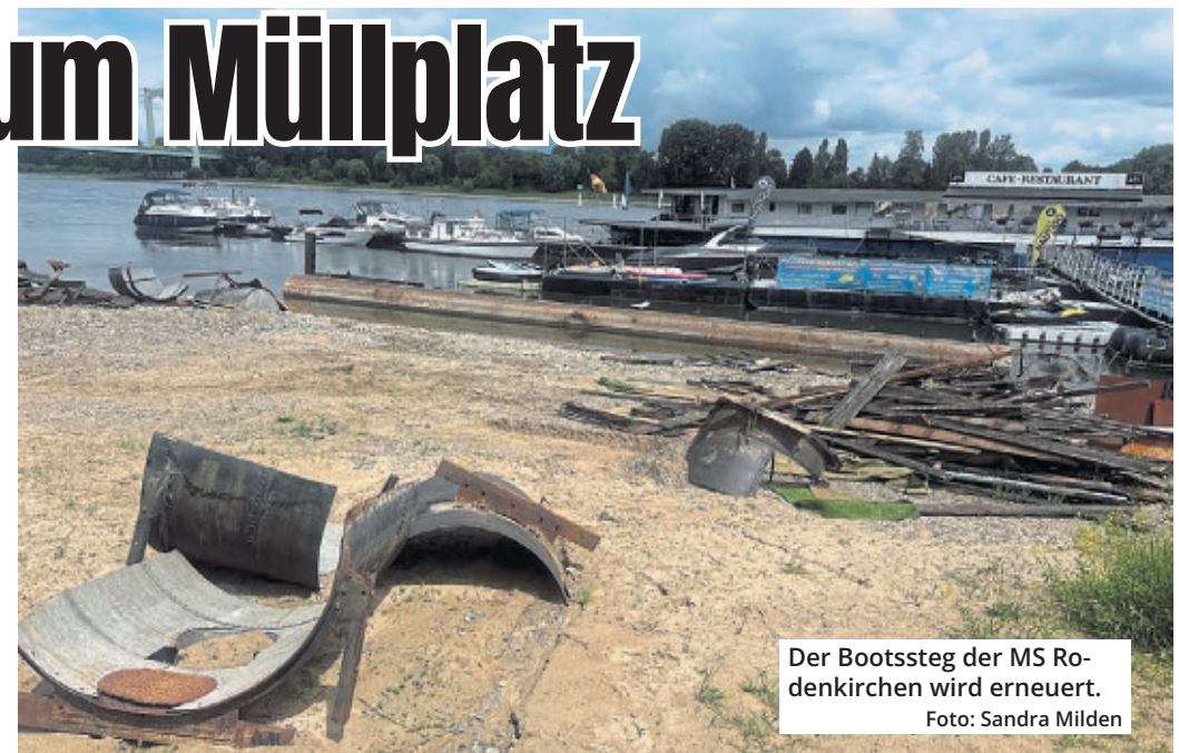
Der Bootssteg der MS Rodenkirchen wird erneuert.

„Im Idealfall senden Bürger am besten einfach ein Foto mit dem genauen Standort“, äußert ein städtischer Mitarbeiter, der die Überprüfung an die Mitarbeiter der Abfallwirtschaftsbetriebe veranlasst hat. Über den Service „Sag's uns“ können Missstände im Kölner Stadtbild wie wilder Müll, beschmierte Wände oder Mülltonnen, Schrottfahrer sowie defekte Straßenlaternen direkt an die Stadtverwaltung gemeldet werden. sags-uns.stadt-koeln.de