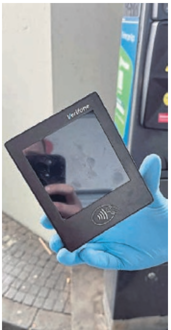
Ein manipuliertes Kartenlesegerät an einem Parkscheinautomaten.

Die Polizei rät, Parkautomaten vor dem Bezahlen auf bauliche Veränderungen zu überprüfen. Im Zweifel sollte man mit Bargeld oder über offizielle Park-Apps bezahlen und den Automaten nicht nutzen, wenn etwas ungewöhnlich erscheint. Wenn der Automat verdächtig erscheint, sollte der Parkplatzbetreiber informiert werden. Bei verdächtigen Kontobewegungen sollten Betroffene sofort ihre Bank kontaktieren und Anzeige bei der Polizei erstatten. (red)