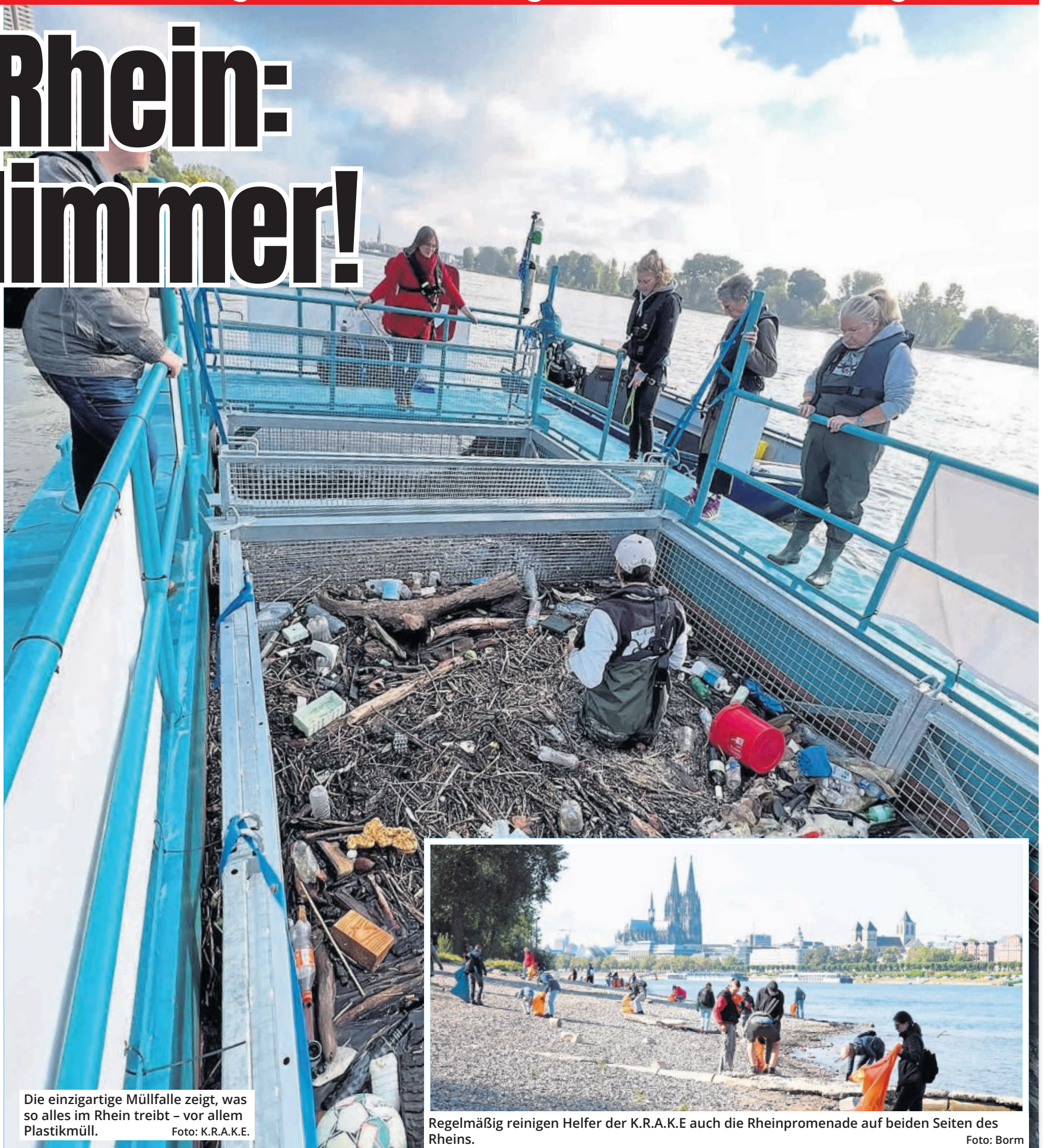
Die einzigartige Müllfalle zeigt, was so alles im Rhein treibt - vor allem Plastikmüll.