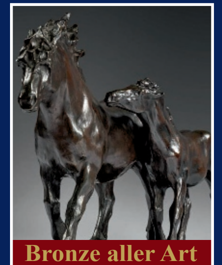
Bronze aller Art

Kostenlose Expertise & Bewertung - Wir zahlen bis zu 167,50 € pro Gramm!