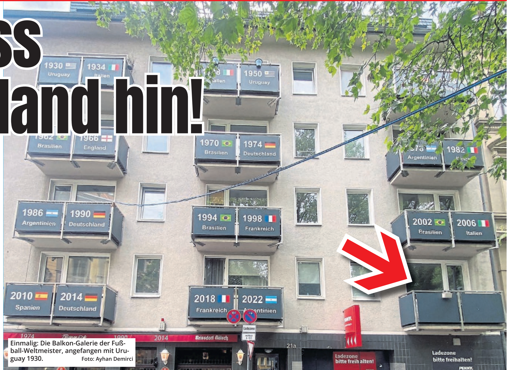
Einmalig: Die Balkon-Galerie der Fußball-Weltmeister, angefangen mit Uruguay 1930.