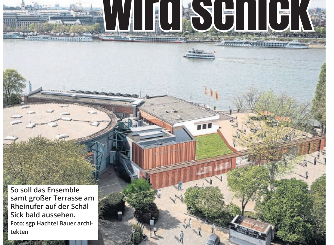
So soll das Ensemble samt großer Terrasse am Rheinufer auf der Schäl Sick bald aussehen.

Gerade erst wurde das Open-Air-Gelände im Tanzbrunnen nach umfangreicher Modernisierung wieder in Betrieb genommen, da steht schon das nächste Großprojekt vor der Tür. In den Rheinterrassen, dem Theater am Tanzbrunnen und vor allem auf dem Gelände drumherum wird sich einiges tun.