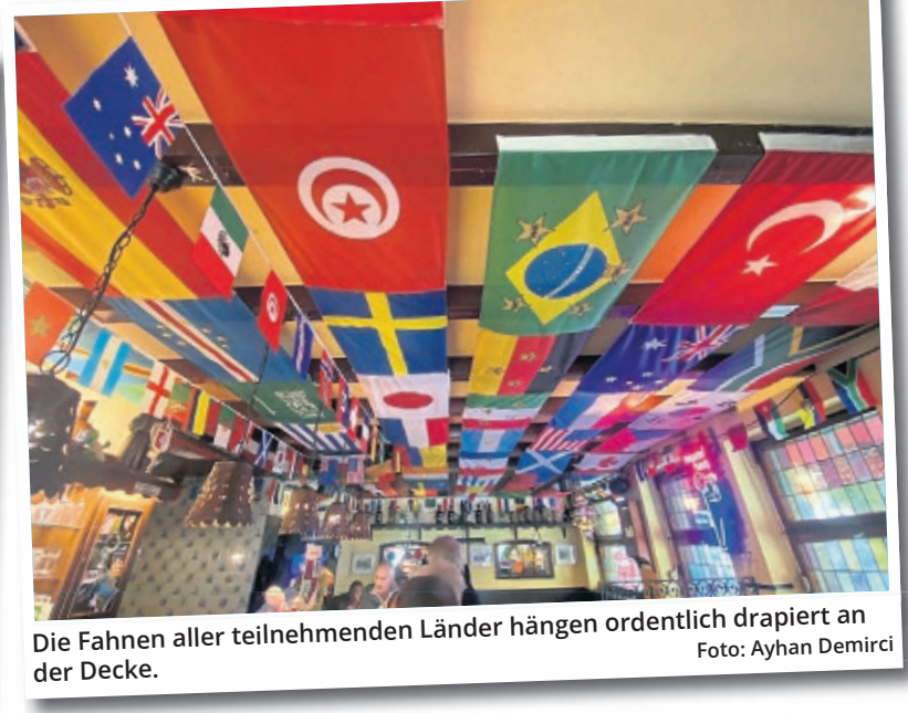
Die Fahnen aller teilnehmenden Länder hängen ordentlich drapiert an der Decke.