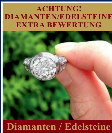
ACHTUNG! DIAMANTEN/EDELSTEINE EXTRA BEWERTUNG