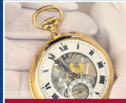
Uhren / Taschenuhren