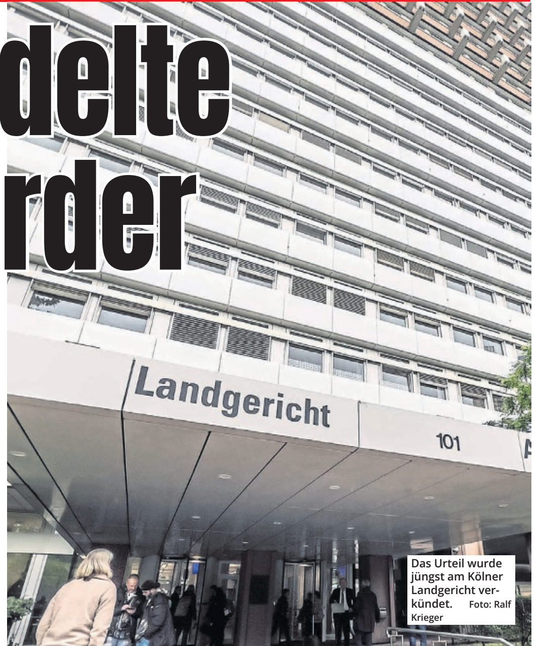
Das Urteil wurde jüngst am Kölner Landgericht verkündet.