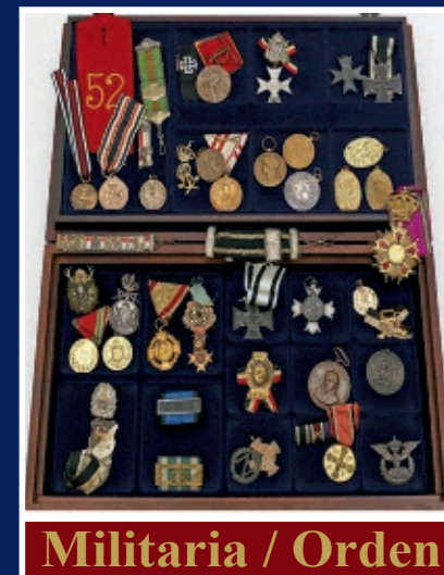
Militaria / Orden