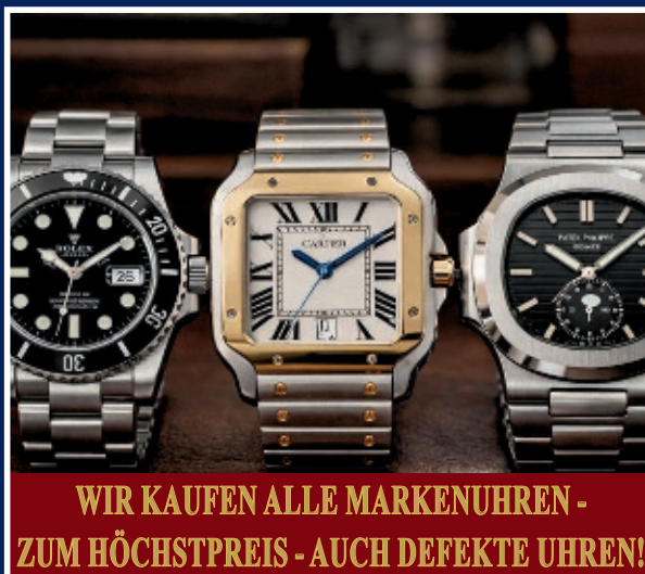
WIR KAUFEN ALLE MARKENUHREN - ZUM HÖCHSTPREIS - AUCH DEFEKTE UHREN!

Bei uns wird nicht nur der Goldwert berechnet, sondern zusätzlich der Schmuckpreis, der in der Regel 15-20 % über dem reinen Materialwert liegt – egal ob Altgold oder Bruchgold. Für jedes Stück haben wir einen fairen und individuellen Preis. Familiengeführt seit 1977 mit über 49 Jahren Erfahrung stehen wir für Fachwissen, Vertrauen und ehrliche Bewertung.