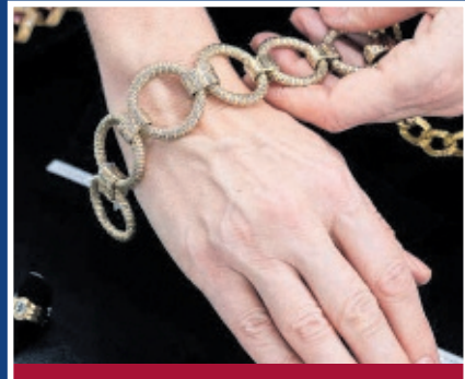
Wir zahlen Schmuckpreise