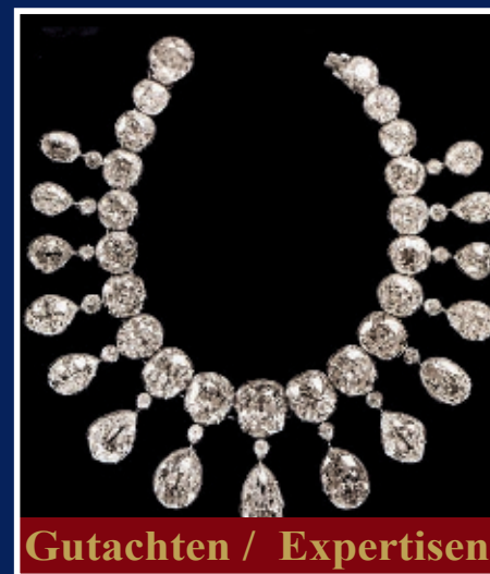
Gutachten / Expertisen