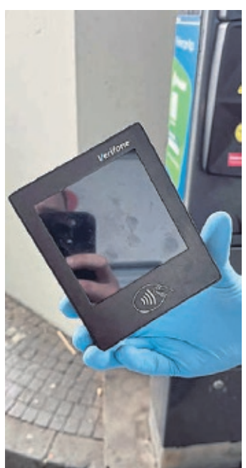
Ein manipuliertes Kartenlesegerät an einem Parkscheinautomaten.

Köln. Die Polizei Köln warnt vor einer neuen Betrugsmasche, bei der die Täter mit manipulierten NFC-Kartenlesegeräten Geld von Autofahrern an Parkautomaten erbeuten. Dabei wird ein eigenes Lesegerät über dem originalen Bezahlfeld des Automaten befestigt, was nur schwer zu erkennen ist. Sobald ein Parkticket kontaktlos bezahlt werden soll, bucht das manipulierte Gerät einen zuvor einprogrammierten Betrag ab. Zuletzt stellte die Polizei der Innenstadt eine solche Geräte auf dem Parkplatz am Hauptbahnhof sicher. Ein 44-jähriger Mann hatte zuvor versucht, sein Ticket mit dem Mobiltelefon zu bezahlen und bemerkte kurz darauf eine verdächtige Abbuchung von seinem Konto, woraufhin er die Polizei informierte. Während des Einsatzes meldeten sich zwei weitere Männer, die ebenfalls Opfer der Masche geworden waren. Die Ermittler schließen nicht aus, dass weitere manipulierte Geräte im Umlauf sind. Die Polizei rät, Parkautomaten vor dem Bezahlen auf bauliche Veränderungen zu überprüfen. Im Zweifel sollte man mit Bargeld oder über offizielle Park-Apps bezahlen und den Automaten nicht nutzen, wenn etwas ungewöhnlich erscheint. Wenn der Automat verdächtig erscheint, sollte der Parkplatzbetreiber informiert werden. Bei verdächtigen Kontobewegungen sollten Betroffene sofort ihre Bank kontaktieren und Anzeige bei der Polizei erstatten. (red)