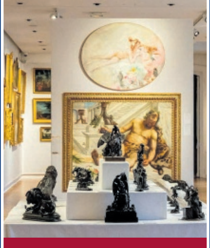
Skulpturen / Möbelstücke

Viele Menschen zögern, alte Schätze zu verkaufen, weil sie denken, Verkauf bedeute Geldnot. Doch genau das ist nicht der Fall. Oft geht es darum, dass wertvolle Stücke in gute Hände kommen und auch in Zukunft respektiert, gepflegt und geschätzt werden. Bei dem Auktionshaus von Falkenberg sorgen wir dafür, dass jedes Objekt mit Würde weitergegeben wird und seine Geschichte bewahrt bleibt. So finden alte Schätze einen neuen Platz, an dem sie weiterleben dürfen. 8 TAGE. 10 EXPERTEN. KOSTENLOSE BEWERTUNG - JETZT TERMIN SICHERN!