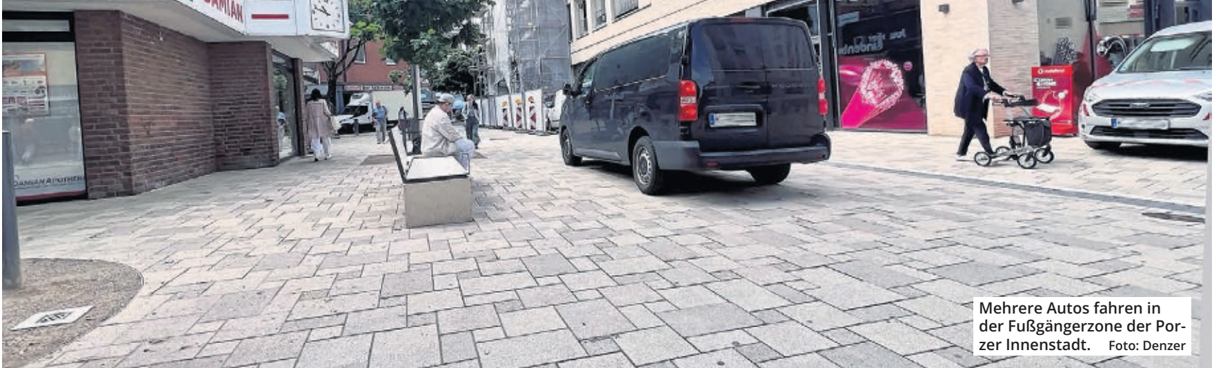
Mehrere Autos fahren in der Fußgängerzone der Porzer Innenstadt.

Besser wäre es, wenn die gar nicht nötig wären. Das ist das Ziel einer Petition, die der Verein Porzity, die Interessengemeinschaft der Gewerbe-