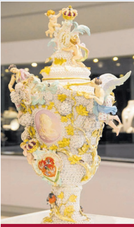
Porzellan aller Munufakturen