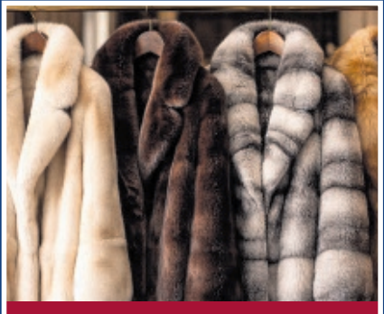
Pelze aller Art