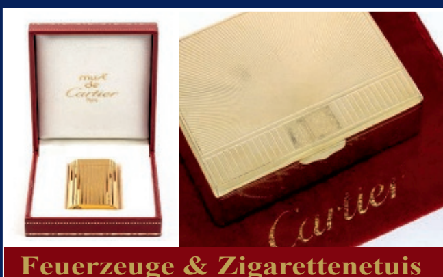
Feuerzeuge & Zigarettenetuis

Kostenlose Expertise & Bewertung - Wir zahlen bis zu 167,50 € pro Gramm!