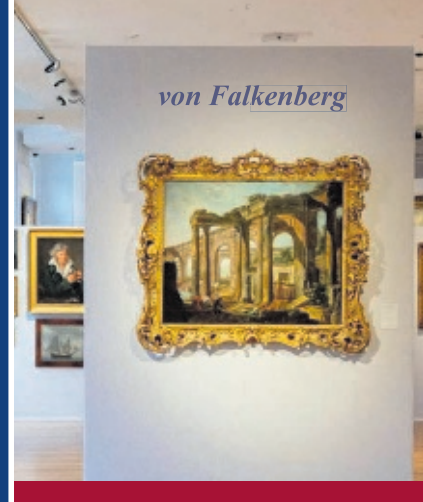
Gemälde aller Epochen