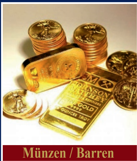
Münzen / Barren