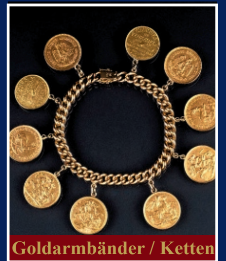
Goldarmbänder / Ketten

Bei uns wird nicht nur der Goldwert berechnet, sondern zusätzlich der Schmuckpreis, der in der Regel 15-20 % über dem reinen Materialwert liegt – egal ob Altgold oder Bruchgold. Für jedes Stück haben wir einen fairen und individuellen Preis. Familiengeführt seit 1977 mit über 49 Jahren Erfahrung stehen wir für Fachwissen, Vertrauen und ehrliche Bewertung.