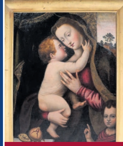
Antiquitäten aller Art