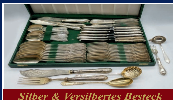
Silber & Versilbertes Besteck