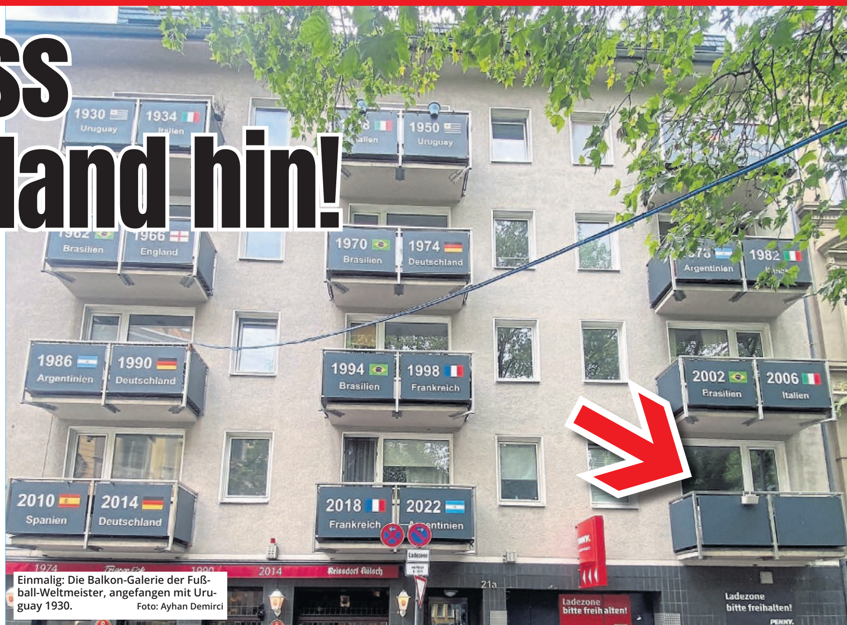
Einmalig: Die Balkon-Galerie der Fußball-Weltmeister, angefangen mit Uruguay 1930.

Am Haus, genauer: An den Balkonbrüstungen hat Rainer Els nämlich alle Weltmeisternationen seit 1930 verewigt – zwei Plätze sind noch frei. Für den Titelträger 2026, der im Finale am 19. Juli in New York ermittelt wird, und den Weltmeister 2030 (die Jubilä-