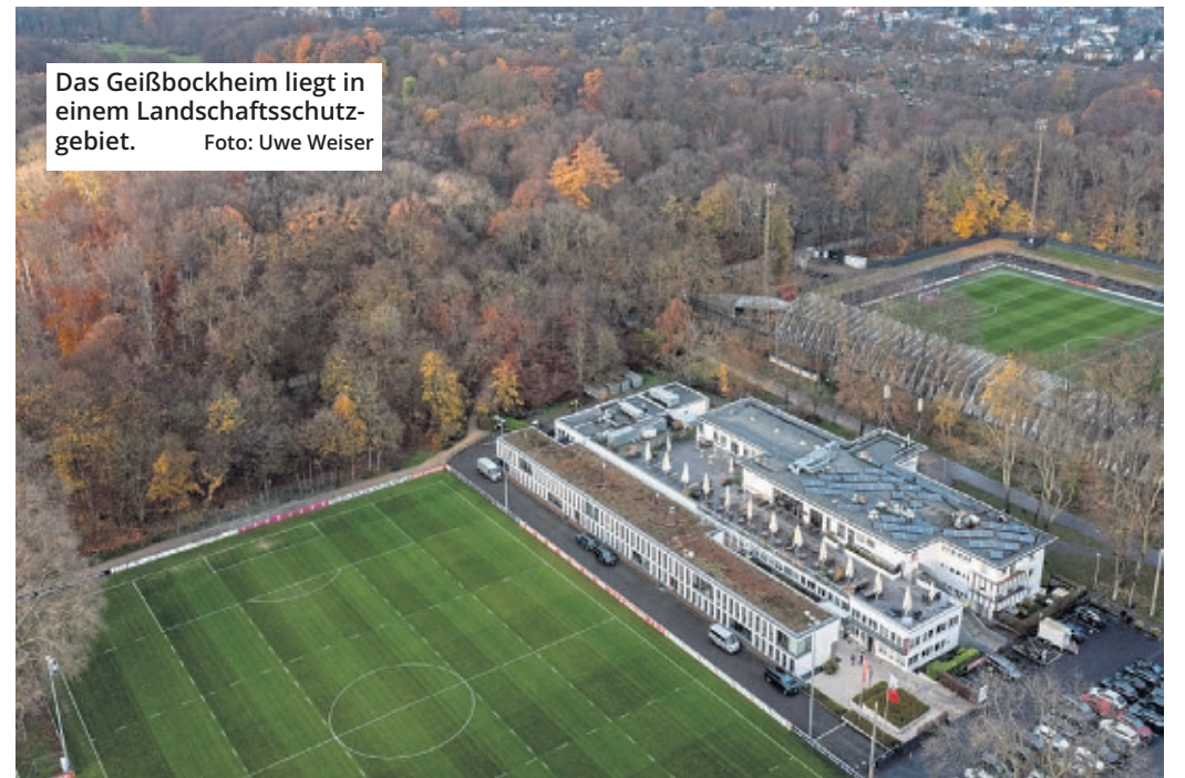
Das Geißbockheim liegt in einem Landschaftsschutzgebiet.

Köln. Es ist der nächste Nackenschlag für den 1. FC Köln. Das Thema Geißbockheim-Ausbau wird sich erneut hinausziehen. Ob es jemals eine Lösung gibt, steht in den Sternen. Als Begründung für die Absage des Termins gab das Gericht an: „Am heutigen Nachmittag ist eine Stellungnahme der Antragsteller zu Artenschutzfragen eingegangen, die weitere Aufklärung erfordert.“ Aus zwölf Jahren werden jetzt deutlich mehr! Wann ein neuer Termin stattfindet, ist aktuell nicht klar. Hinter der Klage aus dem Jahr 2020 stehen die Bürgerinitiative „Grüngürtel für alle“ (BI) und der BUND NRW. Auf Anfrage bezeichnete Friedmund Skorzewski von der BI das Gutachten als einen „Hammer“. Es sei erst kurzfristig verfügbar gewesen und sei dann sofort von den Rechtsanwältinnen vorgelegt worden.