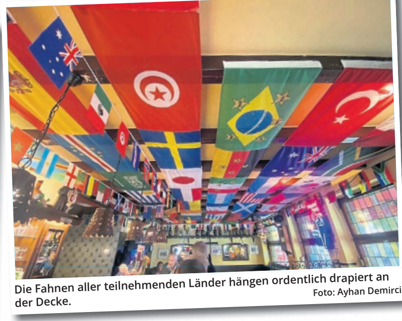
Die Fahnen aller teilnehmenden Länder hängen ordentlich drapiert an der Decke.