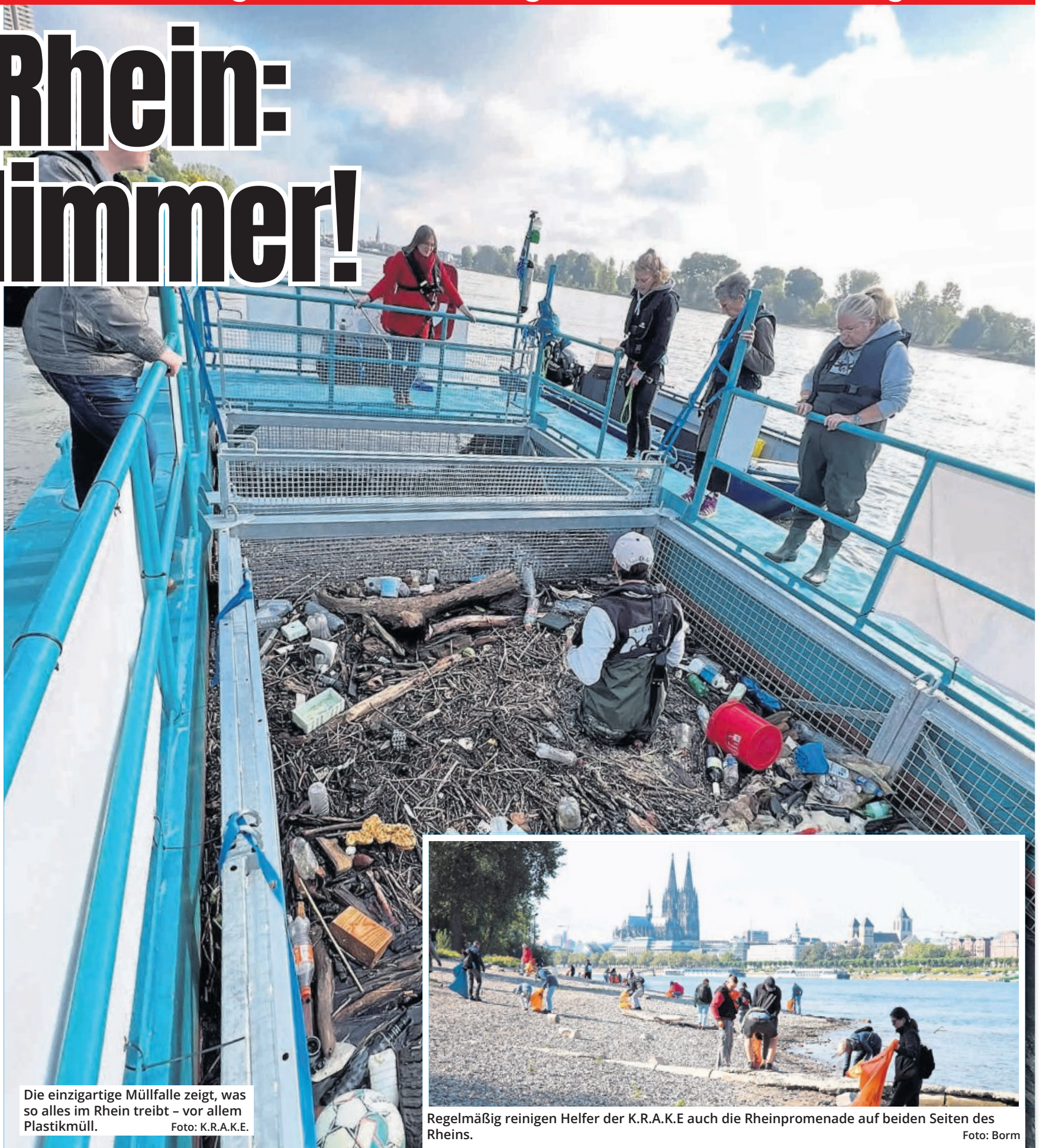
Die einzigartige Müllfalle zeigt, was so alles im Rhein treibt - vor allem Plastikmüll.