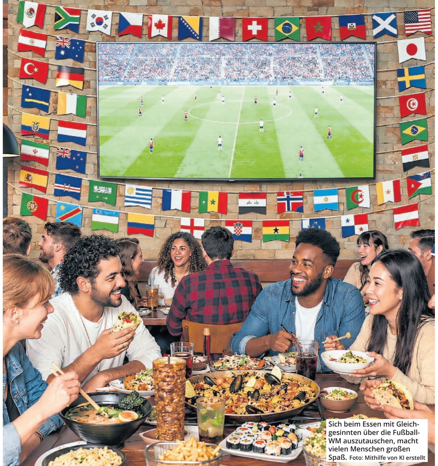
Sich beim Essen mit Gleichgesinnten über die Fußball-WM auszutauschen, macht vielen Menschen großen Spaß.

Gruppe H Spanien La Bodega Köln Friesenstraße 51 50670 Köln 0221/2573610 la-bodega-koeln.de Nationalgericht: Paella (Reispfannengericht mit Meeres-