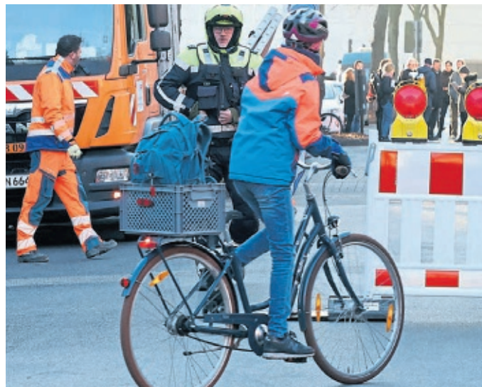
Eine der bislang vier Kölner Schulstraßen befindet sich in der Lindenbornstraße (Vincenz-Statz-Grundschule).

Monate und erfordert ein aufwendiges Verfahren mit Beteiligung von Anwohnern und Politik. Weil zusätzliche Stellen nicht geschaffen wurden, rechnet die Verwaltung damit, stadtweit lediglich zwei bis drei neue Schulstraßen pro Jahr umsetzen zu können. Obwohl geprüft wird, ob sich Schulstraßen künftig schneller über das Verkehrsrecht anordnen lassen, erwartet die Stadt daraus derzeit keinen wesentlichen Zeitgewinn. Derzeit gibt es vier Schulstraßen in Köln, die sich an der Vincenz-Statz-Grundschule in Ehrenfeld, der Maria-Montessori-Schule in Ossendorf, der Rosennaarschule in Höhenhaus und an der Grundschule Diestwegstraße in Brück befinden.