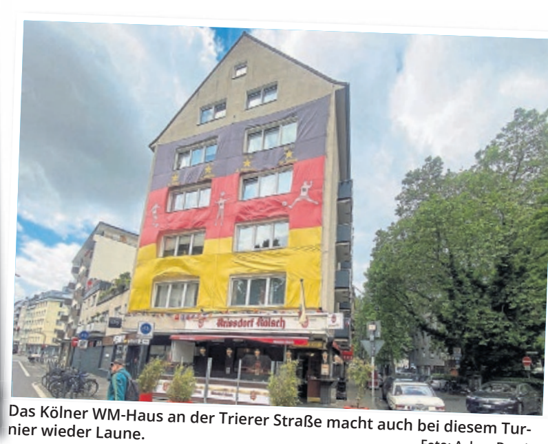
Das Kölner WM-Haus an der Trierer Straße macht auch bei diesem Turnier wieder Laune.