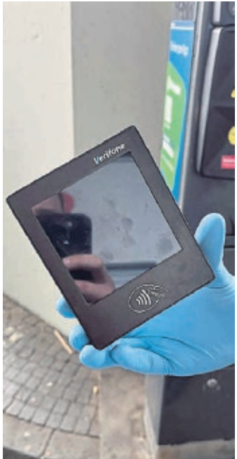
Ein manipuliertes Kartenlesegerät an einem Parkscheinautomaten.

Die Polizei rät, Parkautomaten vor dem Bezahlen auf bauliche Veränderungen zu überprüfen. Im Zweifel sollte man mit Bargeld oder über offizielle Park-Apps bezahlen und den Automaten nicht nutzen, wenn etwas ungewöhnlich erscheint. Wenn der Automat verdächtig erscheint, sollte der Parkplatzbetreiber informiert werden. Bei verdächtigen Kontobewegungen sollten Betroffene sofort ihre Bank kontaktieren und Anzeige bei der Polizei erstatten. (red)