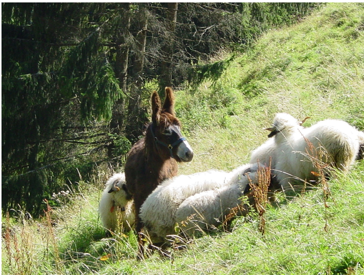
Abb. 2: Esel und Schafe auf einer Alpweide in der Westschweiz.

Namibische Landwirt*innen berichteten, dass Esel in kalbenden Herden gut gegen Schakale, Karakale und Geparden wirken (Marker 2000). Ein Landwirt berichtete, dass ein Maultier einen Leopard sogar zu Tode trampelte (Marker 2000). Auch bei Landry (2000) werden Beispiele aufgeführt, in denen Hunde, die in eine Herde eindringen wollten, von Eseln getötet wurden. Pitt (1988) und Raveneau & Daveze (1994) beschreiben, dass Esel benutzt werden, um Schafe, Ziegen und Kühe vor wildernden Hunden und Füchsen zu schützen. Weitere Literatur zum Einsatz von Eseln beim Herdenschutz findet sich u.a. bei Cadurisch & Cadurisch (2004) und Müller (2014).