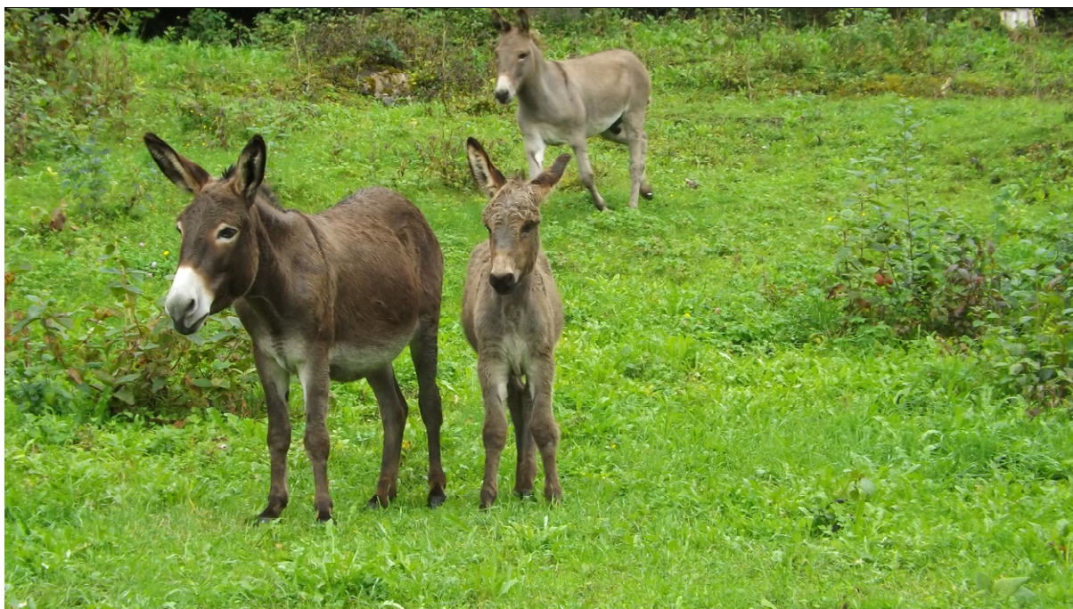
Abb. 1: Für den Einsatz von Eseln spielen der Futterwert und die Standortbedingungen der Weide eine große Rolle – zu eiweißreiches Futter und zu nasse Weideflächen können zu gesundheitlichen Problemen führen. Im Bild Beweidung von Magerrasen in Baden-Württemberg.

Weltweit gibt es über 100 Eselrassen (inkl. Eselmischlinge), die sich neben der Farbe und Zeichnung vor allem auch über die Größe unterscheiden. Zwergesel beispielsweise messen bis 1,05 m Stockmaß/ Widerristhöhe und Normalesel/ Hausesesel bis zu 1,30 m. Als „Großesel“ werden Rassen bezeichnet, die ein Stockmaß über 1,30 m erreichen, wie z.B. der französische Poitou-Esel, für den ein Stockmaß im Mittel von 1,45 m im Zuchtstandard festgeschrieben ist, oder auch der als gefährdet eingestufte katalanische Esel. Je nach Rasse können Esel bis 480 kg schwer werden.