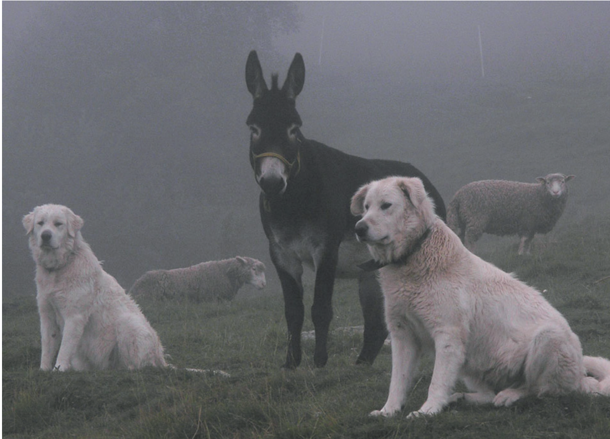
Abb. 3: Erfahrungen zeigen, dass Esel und Hunde normalerweise nicht immer gut zusammenarbeiten. Ausnahmen sind aber möglich, wie dieses Beispiel mit Herdenschutzhunden und Eseln aus der Schweiz zeigt.

In den Empfehlungen des Landes Niedersachsen zur Haltung von Eseln heißt es u.a.: „Die Einzelhaltung von Eseln ist nicht artgemäß und verstößt gegen die Grundsätze des Tierschutzgesetzes. Der Mensch oder ein artfremdes Tier können dem Esel den Artgenossen nicht ersetzen 5 .“