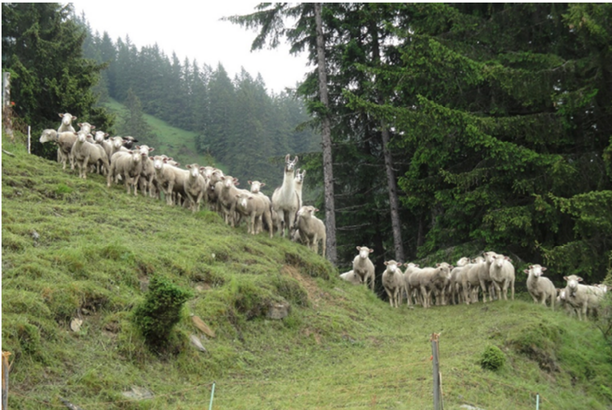
Abb. 6: Zwei Lamas, die eine Schafherde auf einer Schweizer Alpweide schützen. Mit ihren langen Hälsen haben sie einen sehr guten Überblick.

Eine Feldstudie in Utah ergab, dass der Anteil der Lämmer, die durch Kojoten, Hunde und Füchse verloren gingen, in Herden, die von einem Lama bewacht wurden, im ersten von zwei untersuchten Sommern geringer war als in Kontrollherden ohne Lamas. Der zweite Sommer war allerdings ein Jahr mit insgesamt geringen Verlusten (Meadows & Knowlton 2000). In einem Versuch mit 21 Lamas auf 13 Grundstücken in Australien berichteten die Landbesitzer über einen Rückgang der Angriffe von wilden Hunden und erhöhte Ablammraten, die über zwei Jahre oder länger anhielten (Tyrell & Hunt 2008).