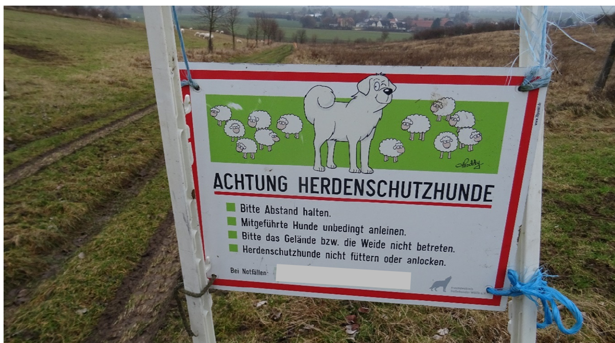
Abb. 13: Tafeln dieser Art eignen sich als Information für die Öffentlichkeit bei Weideflächen entlang von Wegen (Foto: L. Streit).

Verschiedene Autor*innen aus den USA beschrieben, dass sich die Wirksamkeit von HSH (insbesondere gegen Kojoten) auf eingezäunten Weiden nicht vom offenen Gelände unterschied. Teilweise waren die Schafe in eingezäunten Bereichen besser geschützt, teilweise in den offenen Weiden, aber gegen Schwarzbären und Berglöwen waren HSH anscheinend auf eingezäunten Weiden effektiver (u.a. Coppinger et al. 1988, Green & Woodruff 1996, Andelt & Hopper 2000). Sicher ist jedenfalls, dass größere Herden und größere oder unübersichtliche Weiden auch mit mehreren Hunden geschützt werden müssen.