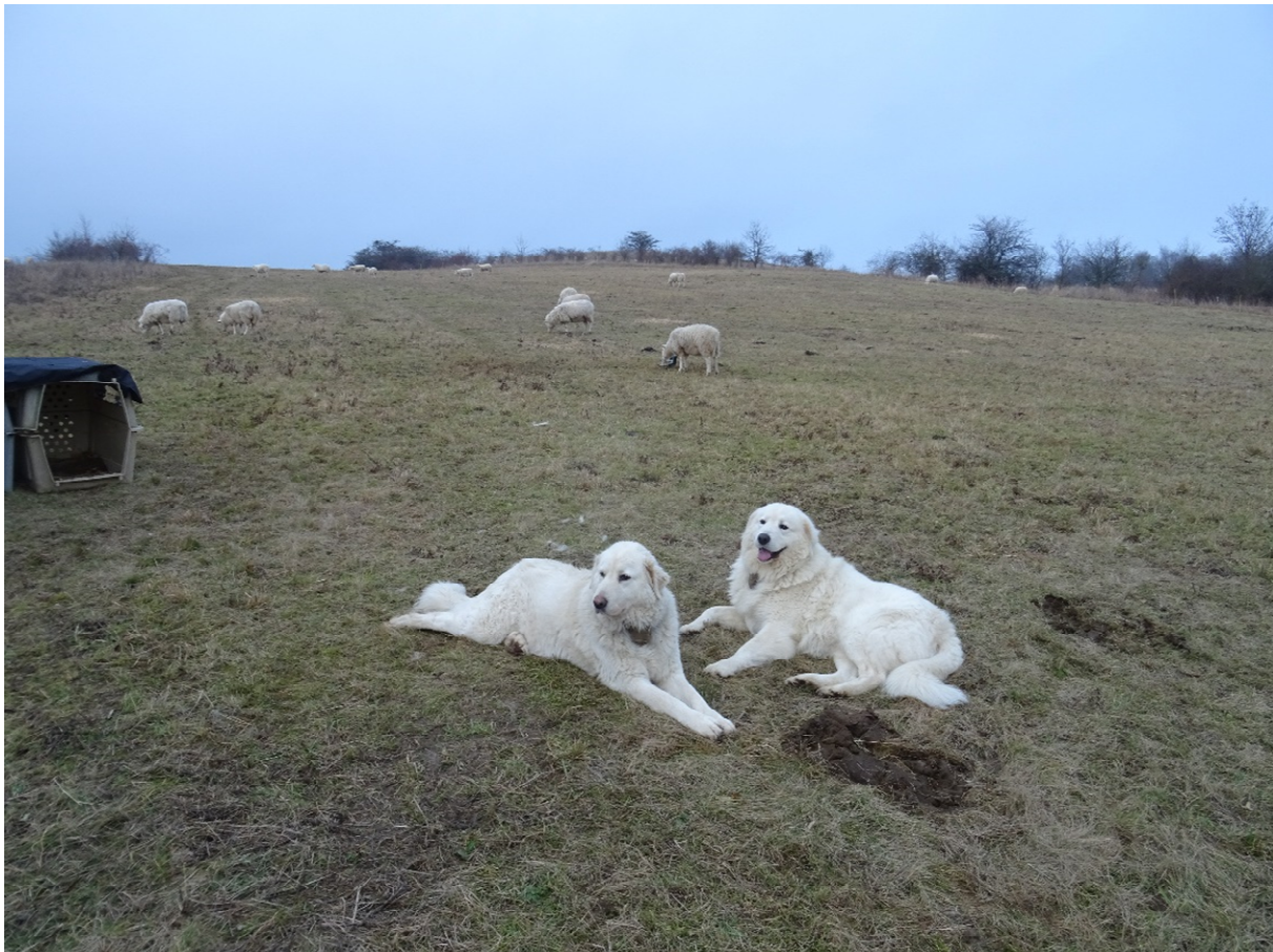
Abb. 11: Entspannte Herdenschutzhunde bei ihrer Schafherde. Die Hunde müssen lernen, Gefahren und Eindringlinge richtig einzuschätzen, um Ruhepausen zu bekommen.

indem er die Begrenzung abläuft, markiert und im Idealfall akustische Signale setzt“. Außerdem ist ein „eher defensives Drohverhalten gewünscht, denn die wichtigste Aufgabe eines HSH bleibt der Schutz seiner Herde“ 36 .