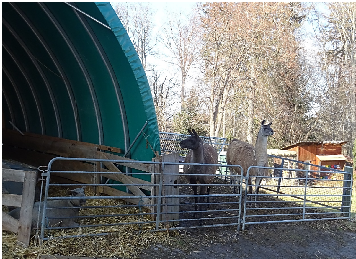
Abb. 8: Zwei Herdenschutzlamas mit Schafen im Winterunterstand. Häufig werden zwei Wallache für den Schutz der Weidetiere eingesetzt.

In der Vergangenheit hat sich gezeigt, dass sich einzelne Lamas am besten in die Herde integrieren lassen und am effektivsten sind (Franklin & Powell 1994). Powell (1993) belegte, dass bei Herden mit 2 bis 6 Lamas mehr Schafe durch Prädatoren verloren gingen, als bei Herden mit nur einem. Allerdings ist die Einzelhaltung je nach Land nicht Tierschutzkonform (Hilfiker et al. 2015), denn die Wildformen der Lamas – das Guanako und das Vikunja – sind soziale Tiere und leben in Gruppen. Wenn die Einzeltierhaltung von Lamas verboten ist, müssen also mindestens zwei Tiere pro Nutztierherde eingesetzt werden. Es hat sich gezeigt, dass auch zwei Lamas eine Bindung zur Herde aufbauen können. Allerdings besteht beim Einsatz von mehr als zwei Lamas die Gefahr, dass die Lamas eine eigene Gruppe bilden und sich nicht mehr bei der Herde aufhalten (Hilfiker et al. 2015).