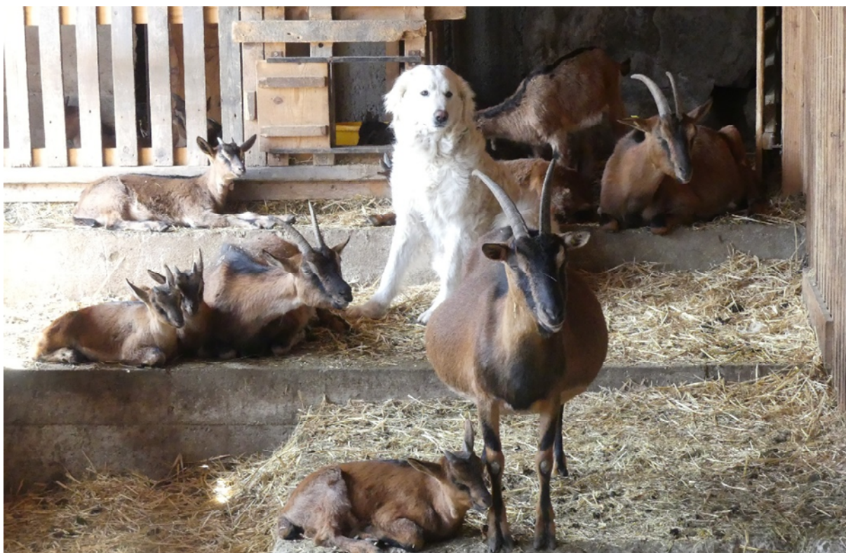
Abb. 10: Herdenschutzhund der Rasse Maremmano-Abruzzese bei einer Ziegenherde im Stall. Außerhalb der Weidesaison verbringen die Hunde in der Regel viel Zeit bei den Weidetieren im Stall.

So konnten sich im Laufe der Jahrtausende weltweit viele verschiedene Wach- und Herdenschutzhunderassen entwickeln, auch wenn mit der Ausrottung von Großkarnivoren sowie der Modernisierung und Änderung der Alpwirtschaft in vielen Ländern der Einsatz dieser Hunde überflüssig wurde und sie zwangsläufig wieder verschwanden. (vgl. Landry 1999, Rigg 2001, Walther & Franke 2014). Die internationale Föderation für Cynologie (FCI) hat zahlreiche dieser Rassen als Wach- und Herdenschutzhunde anerkannt und Standardbedingungen für die jeweilige Rasse festgelegt. Mehrere Rassen, u.a. Maremmen-Abruzzen-Schäferhund, Pyrenäen-Berghund, Kaukasischer Owtscharka, Kuvasz und Kangal sind heute auch außerhalb ihrer ursprünglichen Herkunftsländer verfügbar. Darüber hinaus gibt es noch zahlreiche weitere Rassen der Wach- und Schutzhunde, die jedoch nicht international anerkannt sind. Eine Zusammenstellung findet sich u.a. in Landry (1999) sowie Rigg (2001).