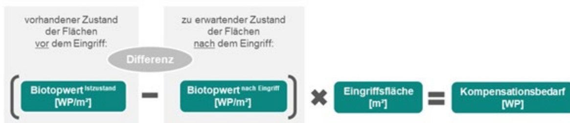
Abb. 4: Differenzmethodischer Ansatz zur Ermittlung des Kompensationsbedarfs nach § 7 Abs. 1 BKompV

Bei einer Flächeninanspruchnahme erfolgt gemäß § 7 Abs. 1 S. 2 Nr. 1 BKompV die Ermittlung des biotopwertbezogenen Kompensationsbedarfs mithilfe eines differenzmethodischen Ansatzes . Dabei ist die Differenz zwischen den Biotopwerten des vorhandenen Zustands und des nach dem Eingriff zu erwartenden Zustands zu bilden und mit der voraussichtlich beeinträchtigten Fläche in Quadratmetern zu multiplizieren.