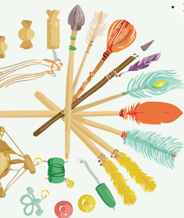
Illustration: Adobe Firefly KI