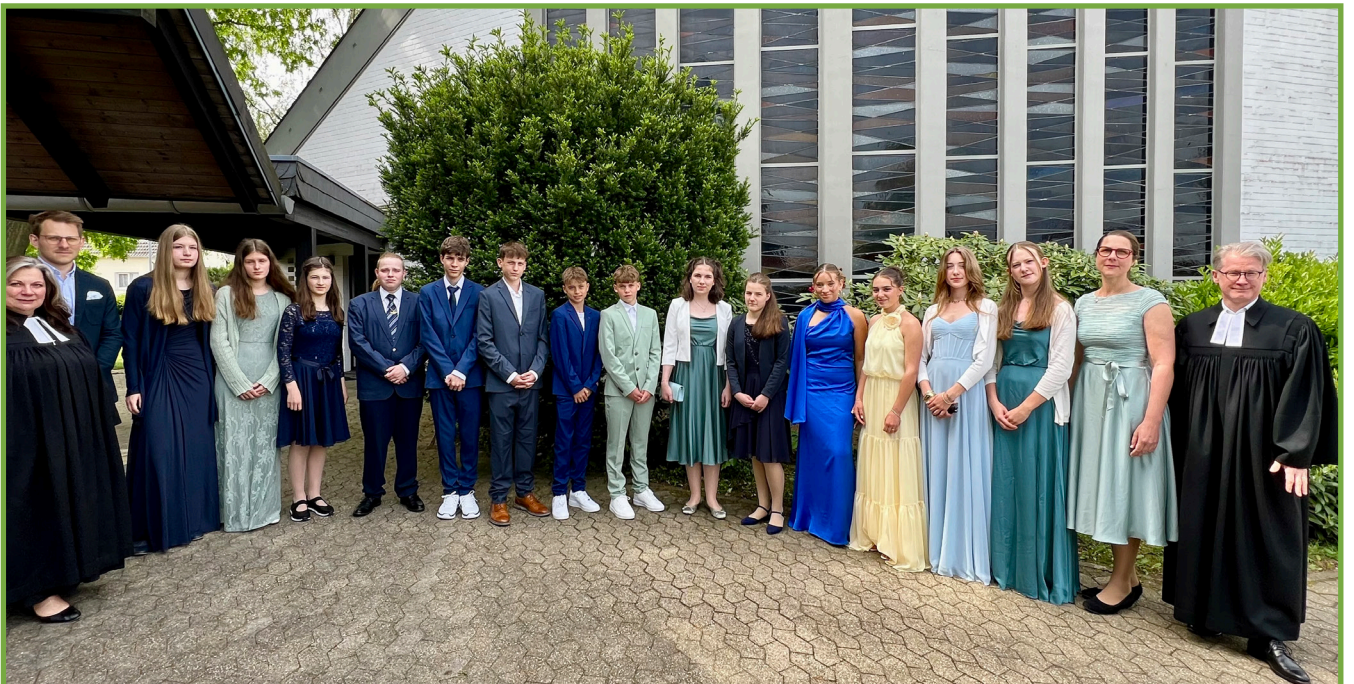
KONFIRMATION 10. MAI 2026 GRUPPE B

Wir danken den jungen Leuten für die gemeinsame Zeit und hoffen, Sie bleiben dem Glauben so nahe und weiterhin im Gemeindeleben sichtbar.