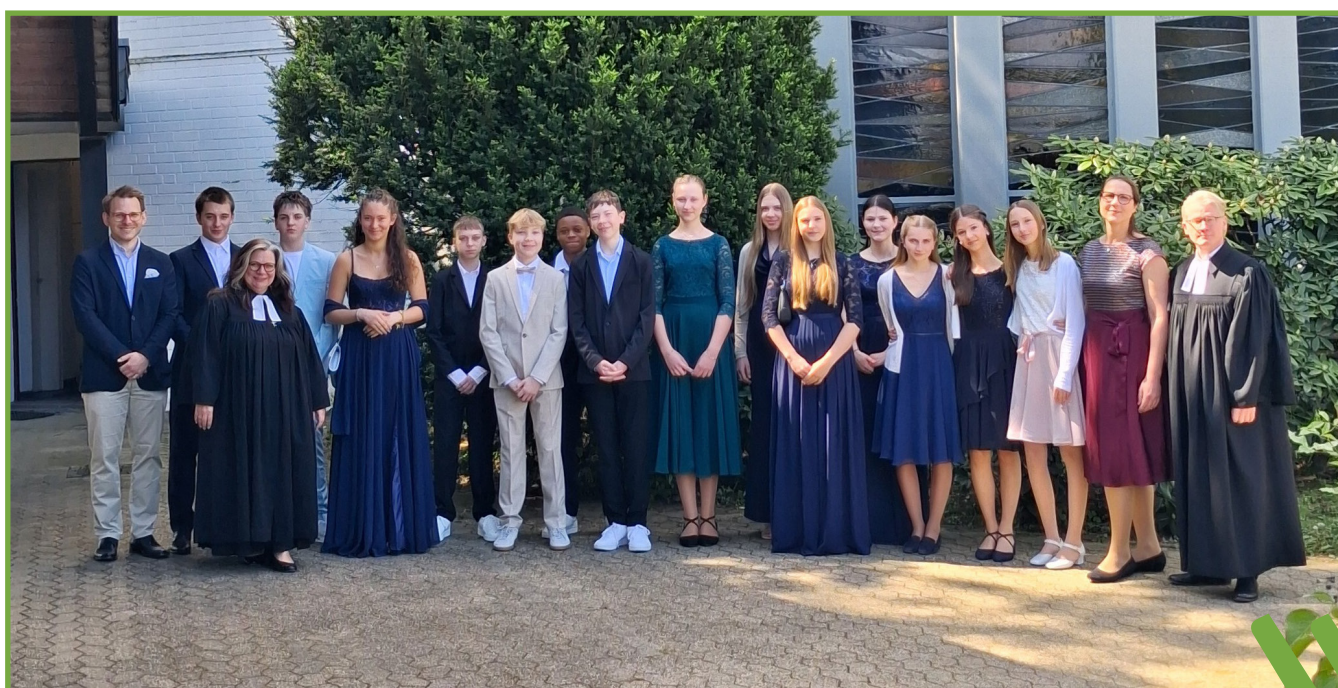
KONFIRMATION 9. MAI 2026 GRUPPE B