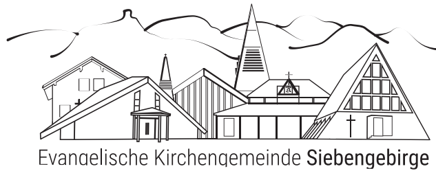
Evangelische Kirchengemeinde Siebengebirge

Sitzungen des Presbyteriums von Januar bis April 2026