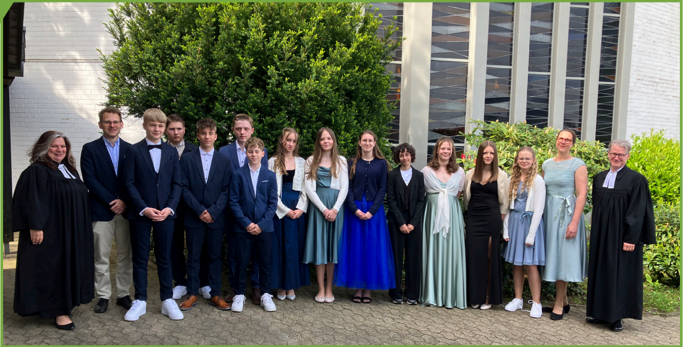
KONFIRMATION 10. MAI 2026 GRUPPE A