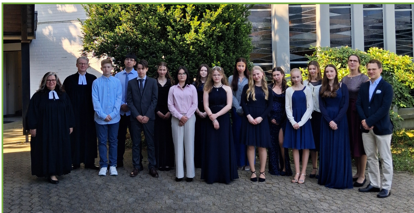
KONFIRMATION 9. MAI 2026 GRUPPE A

Mit großer Freude durften wir am 09. und 10. Mai 2026 die 56 Konfirmandinnen und Konfirmanden dieses Jahrgangs konfirmieren. Ein Jahr Konfiarbeit in einer großen Gruppe, mit vielen lehr- und segensreichen Konfi-Samstagen und einer tollen Konfifreizeit, mündete in vier wunderbaren Konfirmationsgottesdiensten in der Auferstehungskirche.