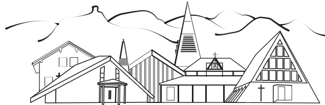
Evangelische Kirchengemeinde Siebengebirge

Zu berichten ist über die Sitzung vom 10. September 2025: