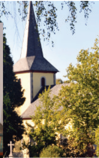
NACH 35 JAHREN GEBEN WIR 2016 SCHWEREN HERZENS DIE ALTE KIRCHE ST. GEREON IN BERKUM AN DIE KATHOLISCHE GEMEINDE ZURÜCK.