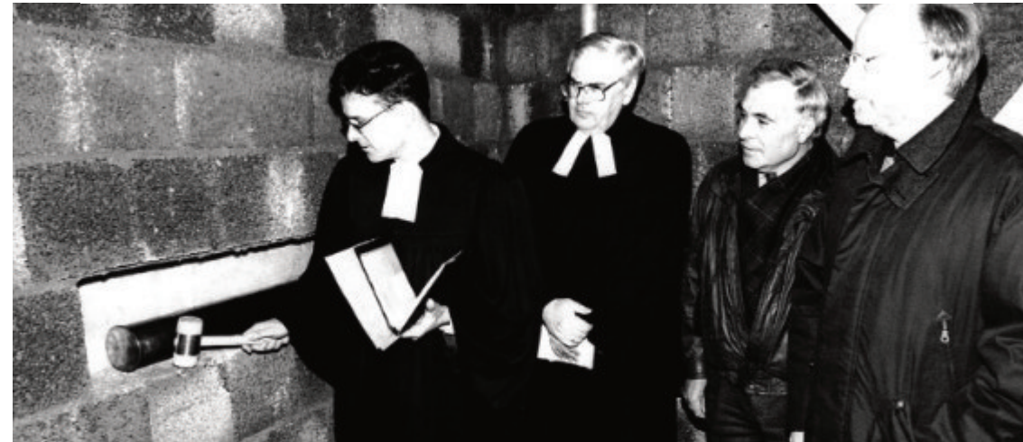
AM 1. ADVENT 1996: GRUNDSTEINLEGUNG FÜR DAS GEMEINDEHAUS IN NIEDERBACHEM.