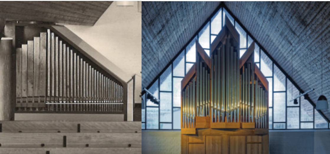
IN DER GNADENKIRCHE WIRD 2006 DIE NEUE MERTEN-ORGEL EINGEWEIFT: AM NEUEN PLATZ GEGENÜBER DEM ALTAR.