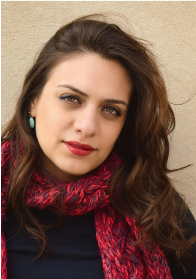
Aftab Darvishi