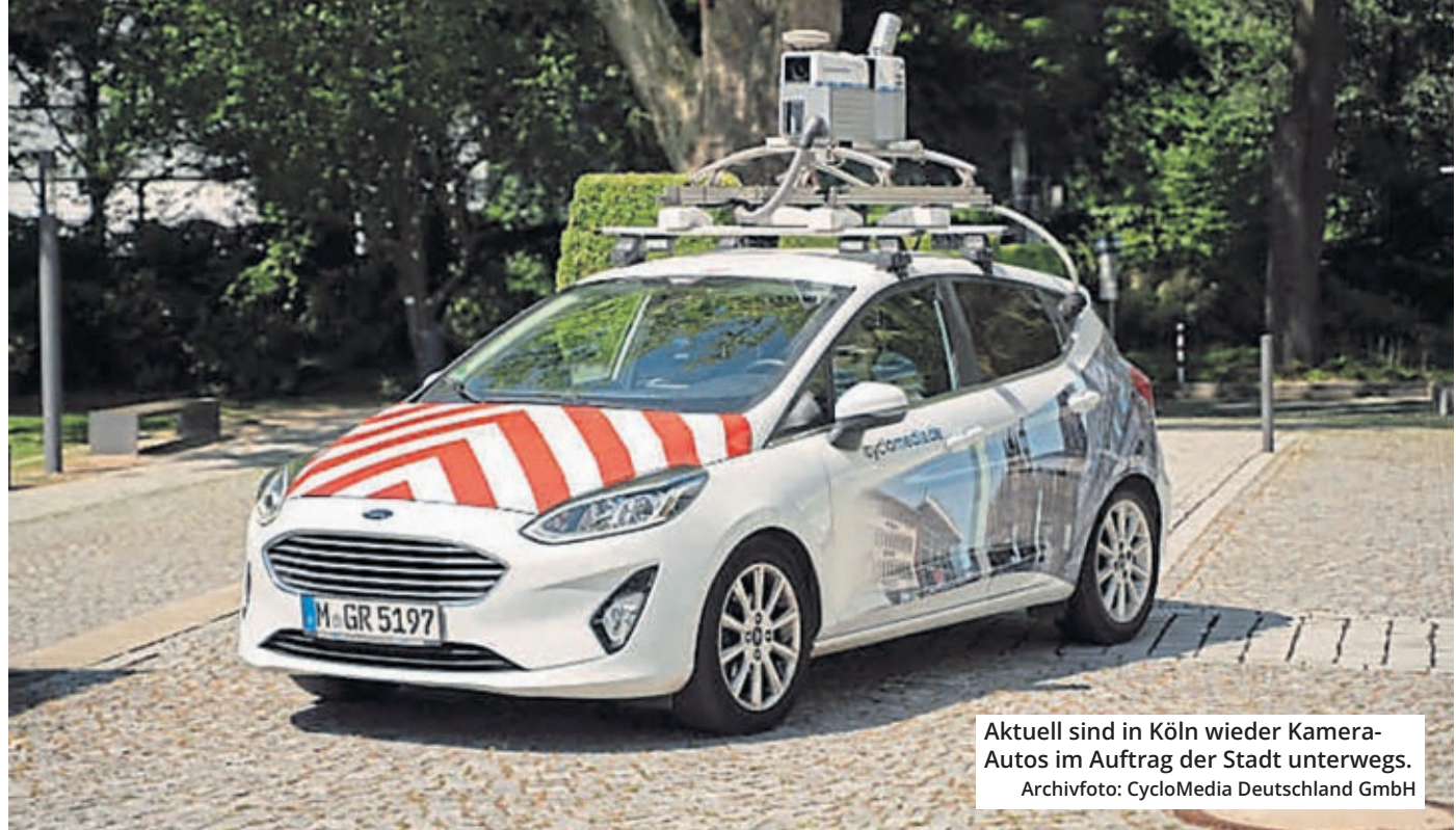
Aktuell sind in Köln wieder Kamera-Autos im Auftrag der Stadt unterwegs.

Köln. Es sind nicht die Ghostbusters unterwegs: Die Stadt Köln lässt ab sofort neue 3D-Panoramabilder der Stadt anfertigen. Noch bis zum 3. August werden dazu Fahrzeuge mit Kameras und Laserscannern durch die Kölner Straßen fahren, um hochauflösende Bilder zu erstellen.