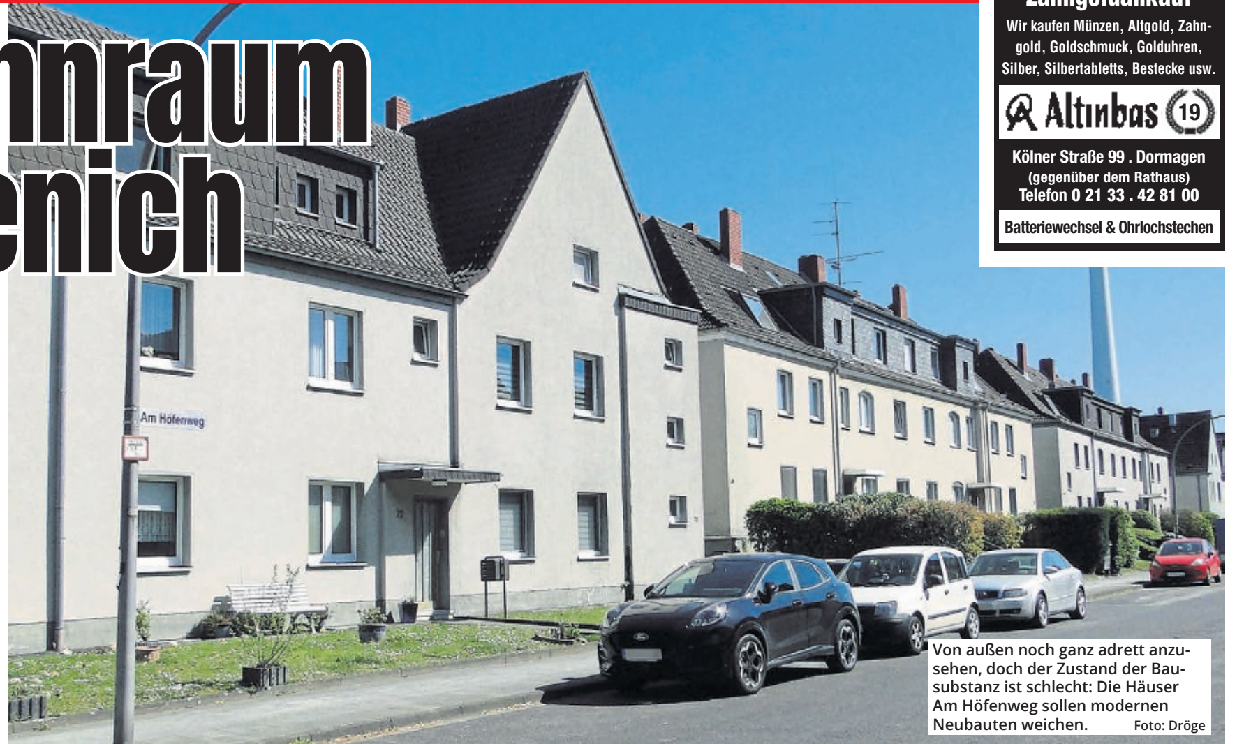
Von außen noch ganz adrett anzusehen, doch der Zustand der Bausubstanz ist schlecht: Die Häuser Am Höfenweg sollen modernen Neubauten weichen.

Vorgesehen ist demnach vor allem eine deutliche Ausweitung des verfügbaren Wohnraums: Anstelle der bestehenden 48 Wohneinheiten sollen in dem geplanten Gebäudeensemble gut 108 genossenschaftlich, zum Teil geförderte und zu verträglichen Preisen erhältliche Mietwohnungen entstehen, die Geschossfläche von derzeit 3240 Quadratmetern auf etwa 6500 Quadratmeter steigen. Die Hausnummern 46 bis 76 sollen künftig von vier dreistöckigen Gebäuden mit sechs Wohneinheiten pro Geschoss sowie einem zusätzlichen Staffelgeschoss eingenommen werden, ergänzt von zwei zweistöckigen Gebäuden auf der östlichen Seite des Planungsgebiets, eben-