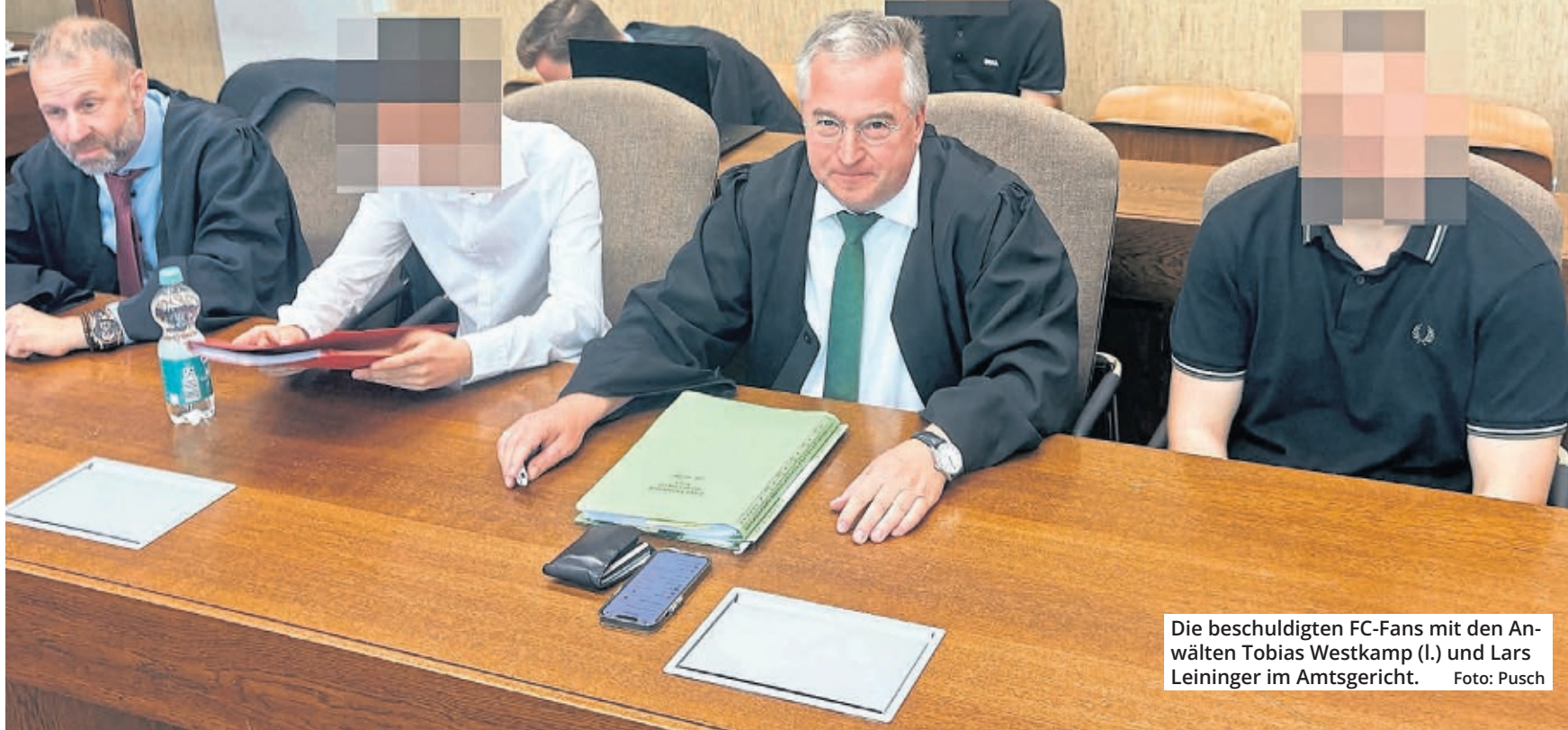
Die beschuldigten FC-Fans mit den Anwälten Tobias Westkamp (l.) und Lars Leininger im Amtsgericht.

Der Plan, einen Fanschal von Bayer Leverkusen zu „ergattern“, sei den drei Angeklagten spontan beim gemeinsamen Fußballgucken in einer Knei-