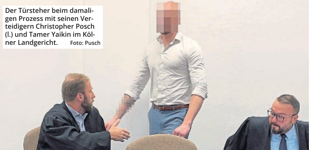
Der Türsteher beim damaligen Prozess mit seinen Verteidigern Christopher Posch (l.) und Tamer Yaikin im Kölner Landgericht.

nach dem Täter gefahndet. Dabei soll der ehemaligen Chefin laut Anklageschrift bereits einen Tag nach der Gewalttat klar gewesen sein, um wen es sich handelte. So habe der Beschuldigte sich seiner Chefin per Telefon offenbart, jemanden „mit der Faust geknallt“ zu haben. Die Angeklagte habe dann die Mitbetreiber der Diskothek angeschrieben und die-