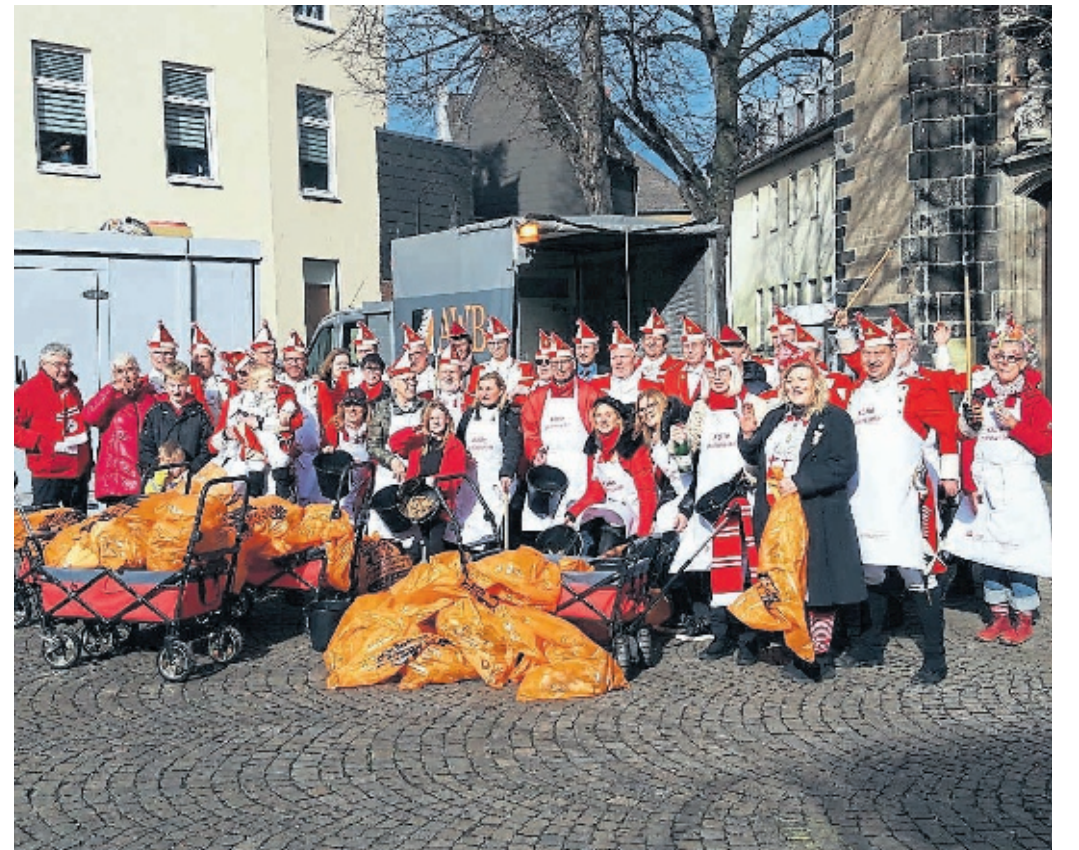
Selbst die Roten Funken haben sich schon bei Kölle putzmunter beteiligt.

Ein Engagement ist dabei einfacher denn je. Schließlich unterstützt die AWB das Vorhaben das gesamte Jahr über. So werden nach einer unkomplizierten Anmeldung einer Aktion auf der Website der AWB und der dafür benötigten Materialien beispielsweise Handschuhe und Müllsäcke zur Verfügung gestellt. Nach dem Ende der Aktion wird das Gesammelte letztlich an einem vereinbarten Treffpunkt abgeholt und entsprechend entsorgt. So soll auch in den nächsten Jahren dafür gesorgt sein, dass engagierte Bürger die Chance haben, Köln ein kleines Stück lebenswerter zu machen.