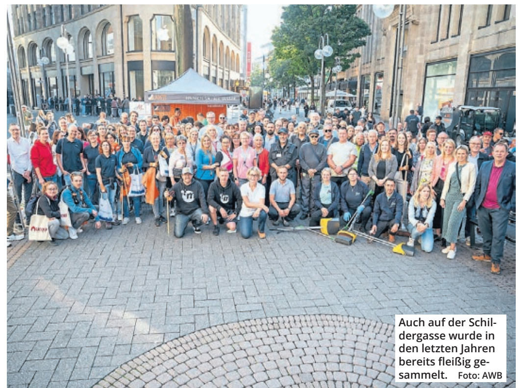
Auch auf der Schildergasse wurde in den letzten Jahren bereits fleißig gesammelt.

Eine tolle Aktion feiert jetzt ihr ganz großes Jubiläum. Kölle putzmunter gibt es nun schon seit 25 Jahren. Und die Botschaft ist weiterhin klar: Durch ein bisschen Engagement in den Veedeln kann jeder zu einem lebenswerteren Köln beitragen.