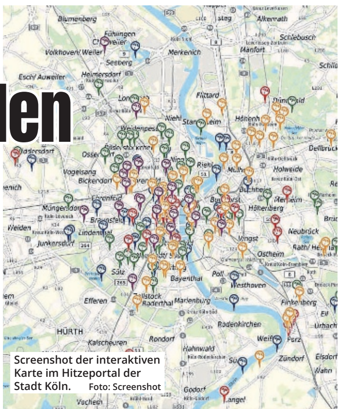
Screenshot der interaktiven Karte im Hitzeportal der Stadt Köln.

am Wasser. Orange zeigt einen Platz im Schatten an, violett steht beispielsweise für einen Insider-Tipp. Die Vielfalt der kühlen Orte ist groß: Schattige Sitzbänke in Parks zählen ebenso dazu wie Kirchen oder klimatisierte Einrichtungen. Ein Beispiel ist die Kirche St. Aposteln am Neumarkt: „Durch das dicke Mauerwerk und den recht dunklen Innenraum, herrscht hier auch bei extremen Außentemperaturen eine angenehme Kühle“, heißt es. Neben Fotos, die neugierig auf die kühlen Oasen machen sollen, können die Nutzerinnen und Nutzer auch weitere Informationen hinzufügen. Dadurch wird die Stadtkarte kontinuierlich von den Kölnerinnen und Kölnern mit ihren Empfehlungen und Erfahrungen aktualisiert und entwickelt sich stetig weiter. Das Eintragen eines kühlen Ortes sei einfach: Die Nutzerinnen und Nutzer setzen ein-