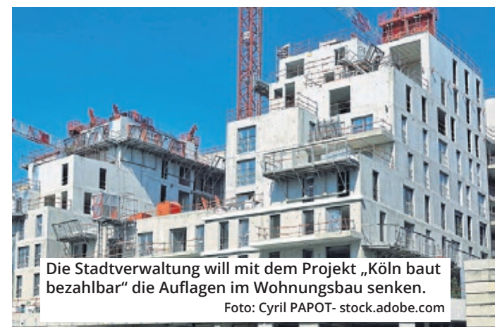
Die Stadtverwaltung will mit dem Projekt „Köln baut bezahlbar“ die Auflagen im Wohnungsbau senken.

Verwaltung bis zum Ende des Jahres grundlegend überarbeiten. Vor allem Genossenschaften mit kleineren Bauvorhaben sollen es leichter haben. Der dritte Punkt ist eine Änderung des Kooperativen Baulandmodells. Das schreibt unter anderem vor, dass Investoren beim Bau größerer Projekte auch Grünflächen, Spielplätze und Kitas mitbauen müssen. Von zum Beispiel 10.000 Quadratmetern bleiben dann mitunter nur 6000 übrig, auf denen tatsächlich Wohnungen entstehen - 60 Prozent also. Dieser Anteil soll erhöht werden. Zum anderen soll der Faktor verän-