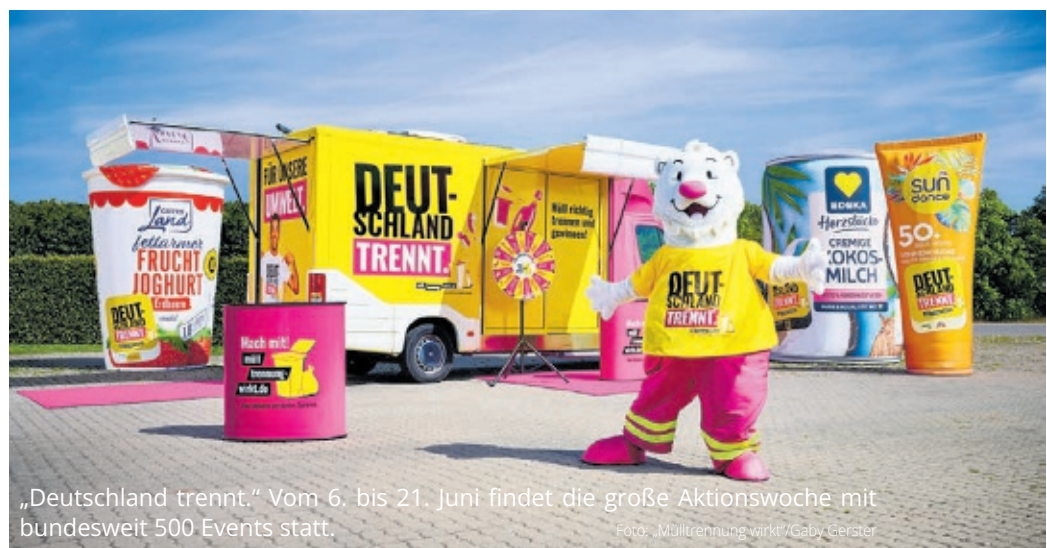
„Deutschland trennt.“ Vom 6. bis 21. Juni findet die große Aktionswoche mit bundesweit 500 Events statt.

Duale Systeme starten bundesweite Aufklärungsoffensive Infos online unter www.mueltrennung-wirkt.de/de/deutschland-trennt/