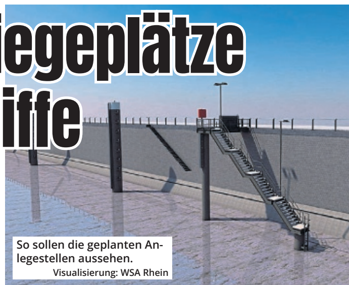
So sollen die geplanten Anlegestellen aussehen. Visualisierung: WSA Rhein

In der Binnenschiffahrt sorgt die Baumaßnahme für Begeisterung. „Die ersten Dalben ste-