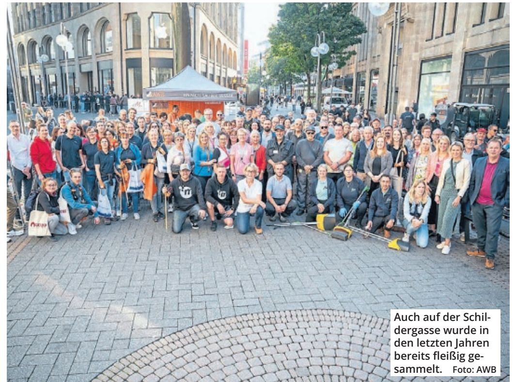
Auch auf der Schildergasse wurde in den letzten Jahren bereits fleißig gesammelt.

Eine tolle Aktion feiert jetzt ihr ganz großes Jubiläum. Kölle putzmunter gibt es nun schon seit 25 Jahren. Und die Botschaft ist weiterhin klar: Durch ein bisschen Engagement in den Veedeln kann jeder zu einem lebenswerteren Köln beitragen.