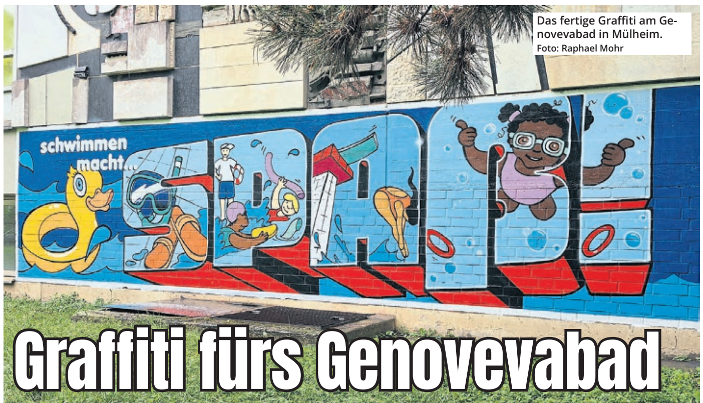
Das fertige Graffiti am Genovevabad in Mülheim.