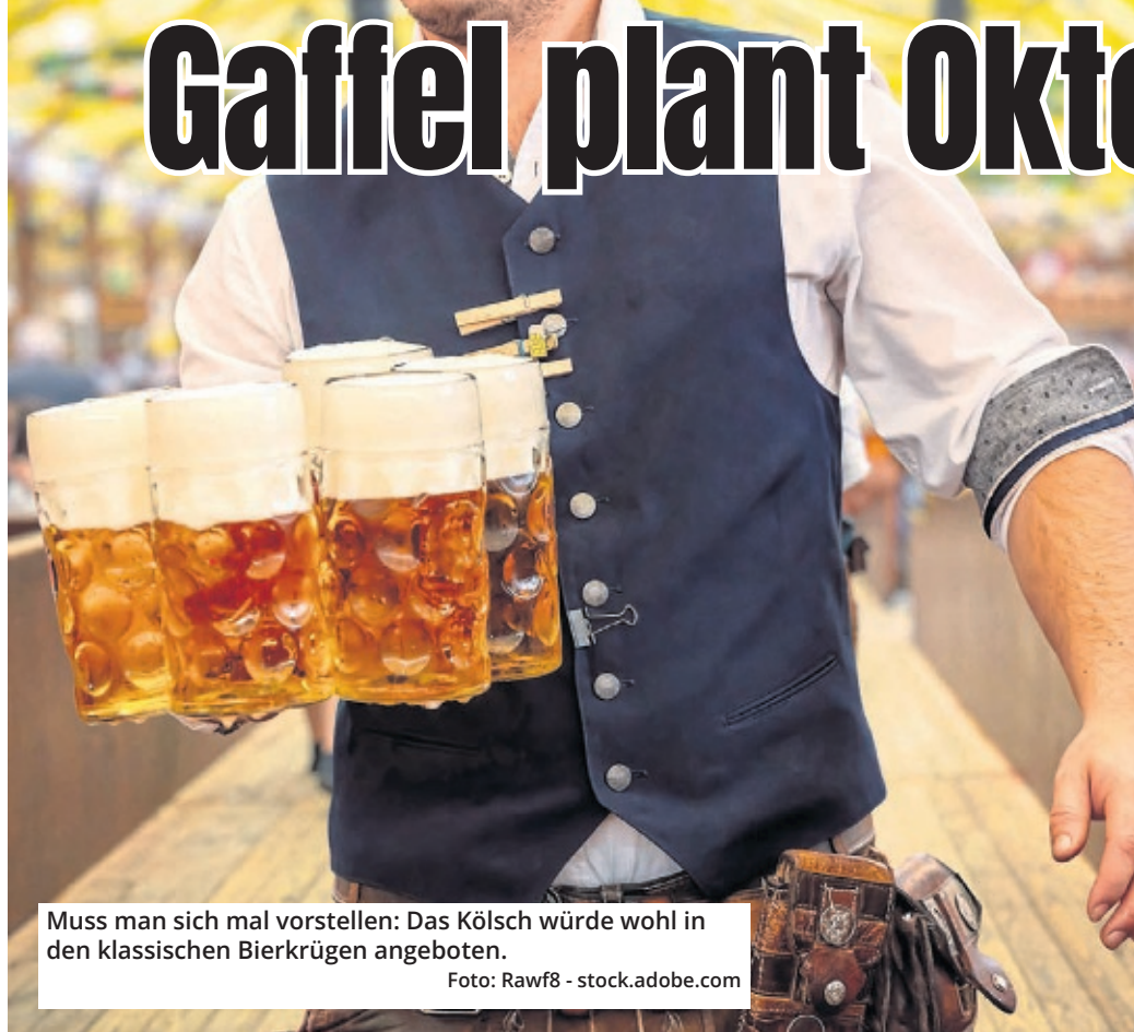
Muss man sich mal vorstellen: Das Kölsch würde wohl in den klassischen Bierkrügen angeboten.