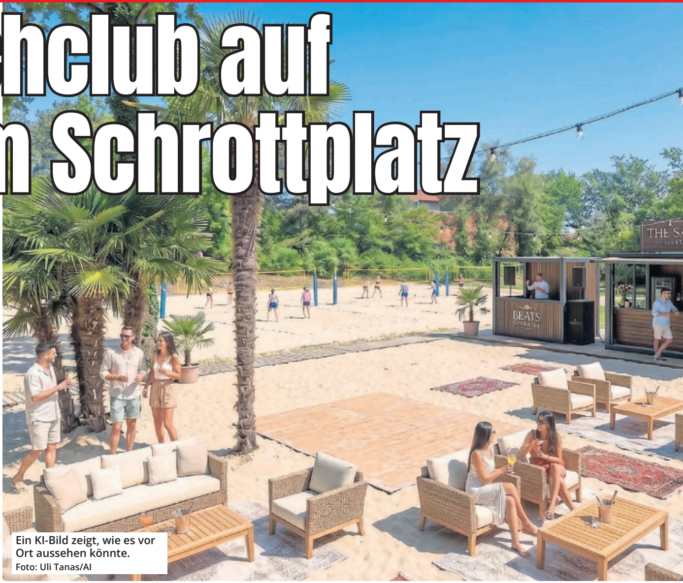
Ein KI-Bild zeigt, wie es vor Ort aussehen könnte.