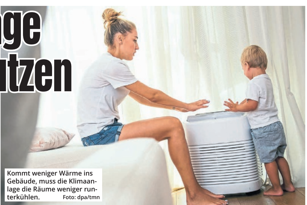
Kommt weniger Wärme ins Gebäude, muss die Klimaanlage die Räume weniger runterkühlen.

mer etwa erst kurz bevor man ins Bett geht. Wer zusätzlich sparen will, kann nachts das Fenster öffnen, statt die Anlage zu nutzen. Vorausgesetzt, die Außentemperatur ist kühler als die Raumtemperatur. Und dann kommt es auch noch auf den Standort des Geräts an. Eine fest installierte Klimaanlage sollte möglichst weit oben an der Wand angebracht werden. Denn warme Luft steigt nach oben und kalte sinkt nach unten. Wird die Anlage schräg positioniert, kann im Raum eine Zirkulation entstehen, die die Luft angenehm kühlt. Das Außengerät der Anlage sollte möglichst nah am Gebäude und im Schatten stehen. Falls man sich für ein günstigeres, mobiles Klimagerät mit Kabel entschieden hat, sollte man darauf achten, dass es nicht zugestellt ist. Es sollte weder hinter einem Vorhang noch hinter der Couch versteckt werden – sonst kann der Betrieb schnell noch teurer werden als ohnehin schon. Auch wenn sie in der Anschaffung und Installation zunächst teurer sind, gilt der Betrieb fest verbauter Klimaanlagen auf Dauer als kostengünstiger im Vergleich zu mobilen Geräten. Zudem kühlen solche Split-Systeme viel effizienter als Monoblöcke. (dpa)