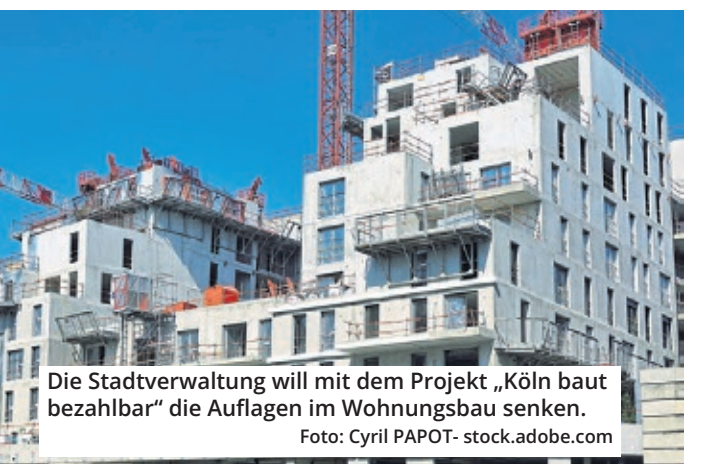
Die Stadtverwaltung will mit dem Projekt „Köln baut bezahlbar“ die Auflagen im Wohnungsbau senken.

Verwaltung bis zum Ende des Jahres grundlegend überarbeiten. Vor allem Genossenschaften mit kleineren Bauvorhaben sollen es leichter haben. Der dritte Punkt ist eine Änderung des Kooperativen Baulandmodells. Das schreibt unter anderem vor, dass Investoren beim Bau größerer Projekte auch Grünflächen, Spielplätze und Kitas mitbauen müssen. Von zum Beispiel 10.000 Quadratmetern bleiben dann mitunter nur 6000 übrig, auf denen tatsächlich Wohnungen entstehen - 60 Prozent also. Dieser Anteil soll erhöht werden. Zum anderen soll der Faktor verän-