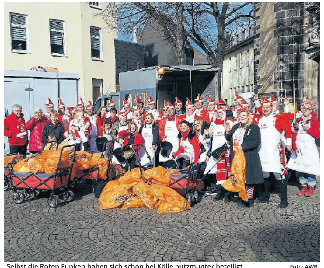
Selbst die Roten Funken haben sich schon bei Kölle putzmunter beteiligt.

ermüdlichen Einsatz zugunsten der gesamten Stadtgesellschaft möchte ich mich ganz herzlich bedanken.“ Gleichzeitig ist klar: In Köln gibt es immer noch zu viele Menschen, die ihren Müll einfach rücksichtslos auf Straßen, in Parks oder Wäldern hinterlassen. Entsprechend wichtig ist es, dass auch in Zukunft viele Menschen im Rahmen von Kölle putzmunter mit anpacken. Ein Engagement ist dabei einfacher denn je. Schließlich unterstützt die AWB das Vorhaben das gesamte Jahr über. So werden nach einer unkomplizierten Anmeldung einer Aktion auf der Website der AWB und der dafür benötigten Materialien beispielsweise Handschuhe und Müllsäcke zur Verfügung gestellt. Nach dem Ende der Aktion wird das Gesammelte letztlich an einem vereinbarten Treffpunkt abgeholt und entsprechend entsorgt. So soll auch in den nächsten Jahren dafür gesorgt sein, dass engagierte Bürger die Chance haben, Köln ein kleines Stück lebenswerter zu machen.