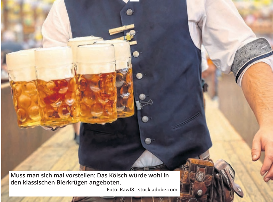
Muss man sich mal vorstellen: Das Kölsch würde wohl in den klassischen Bierkrügen angeboten.

Die Kölner Gaffel-Brauerei bereitet sich auf einen Coup vor. Die Vision: Auf dem Münchner Oktoberfest, urbayrische Tradition seit 1810, fließt in Zukunft Kölsch aus dem Fass!