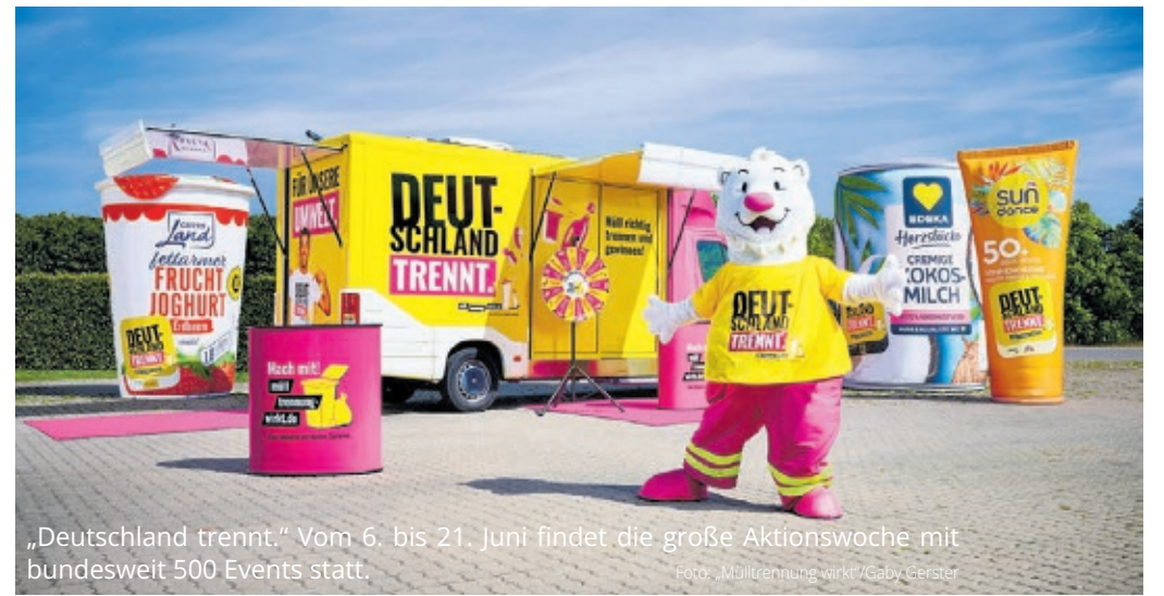
„Deutschland trennt.“ Vom 6. bis 21. Juni findet die große Aktionswoche mit bundesweit 500 Events statt.

Duale Systeme starten bundesweite Aufklärungsoffensive Infos online unter www.mueltrennung-wirkt.de/de/deutschland-trennt/