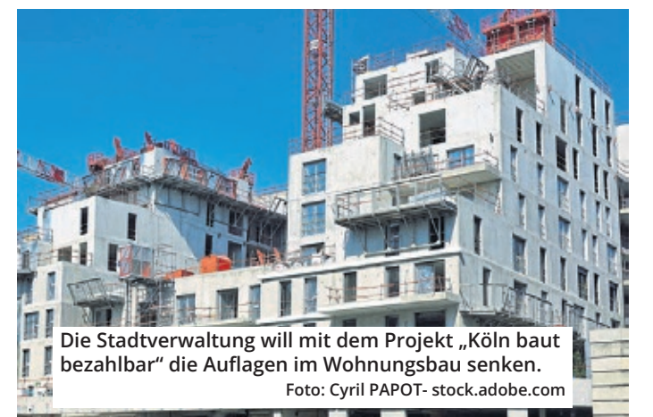
Die Stadtverwaltung will mit dem Projekt „Köln baut bezahlbar“ die Auflagen im Wohnungsbau senken.

Der dritte Punkt ist eine Änderung des Kooperativen Baulandmodells. Das schreibt unter anderem vor, dass Investoren beim Bau größerer Projekte auch Grünflächen, Spielplätze und Kitas mitbauen müssen. Von zum Beispiel 10.000 Quadratmetern bleiben dann darunter nur 6000 übrig, auf denen tatsächlich Wohnungen entstehen - 60 Prozent also. Dieser Anteil soll erhöht werden. Zum anderen soll der Faktor verän-