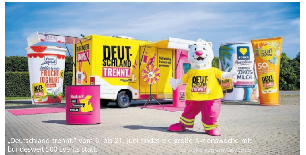
„Deutschland trennt.“ Vom 6. bis 21. Juni findet die große Aktionswoche mit bundesweit 500 Events statt.

Duale Systeme starten bundesweite Aufklärungsoffensive Infos online unter www.mueltrennung-wirkt.de/de/deutschland-trennt/