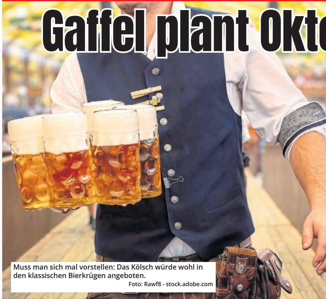
Muss man sich mal vorstellen: Das Kölsch würde wohl in den klassischen Bierkrügen angeboten.