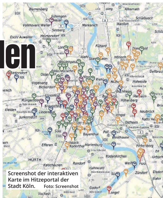
Screenshot der interaktiven Karte im Hitzeportal der Stadt Köln. Foto: Screenshot

Das Eintragen eines kühlen Ortes sei einfach: Die Nutzerinnen und Nutzer setzen ein-