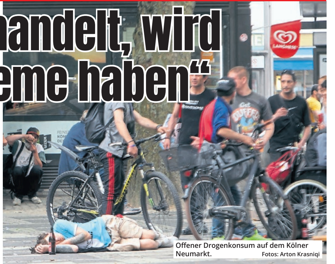
Offener Drogenkonsum auf dem Kölner Neumarkt.

Wie geht die Polizei mit dem Spannungsfeld um, dass Drogenkonsumräume Hilfe ermöglichen sollen, der Handel und Besitz von Betäubungsmitteln aber weiterhin strafbar sind?