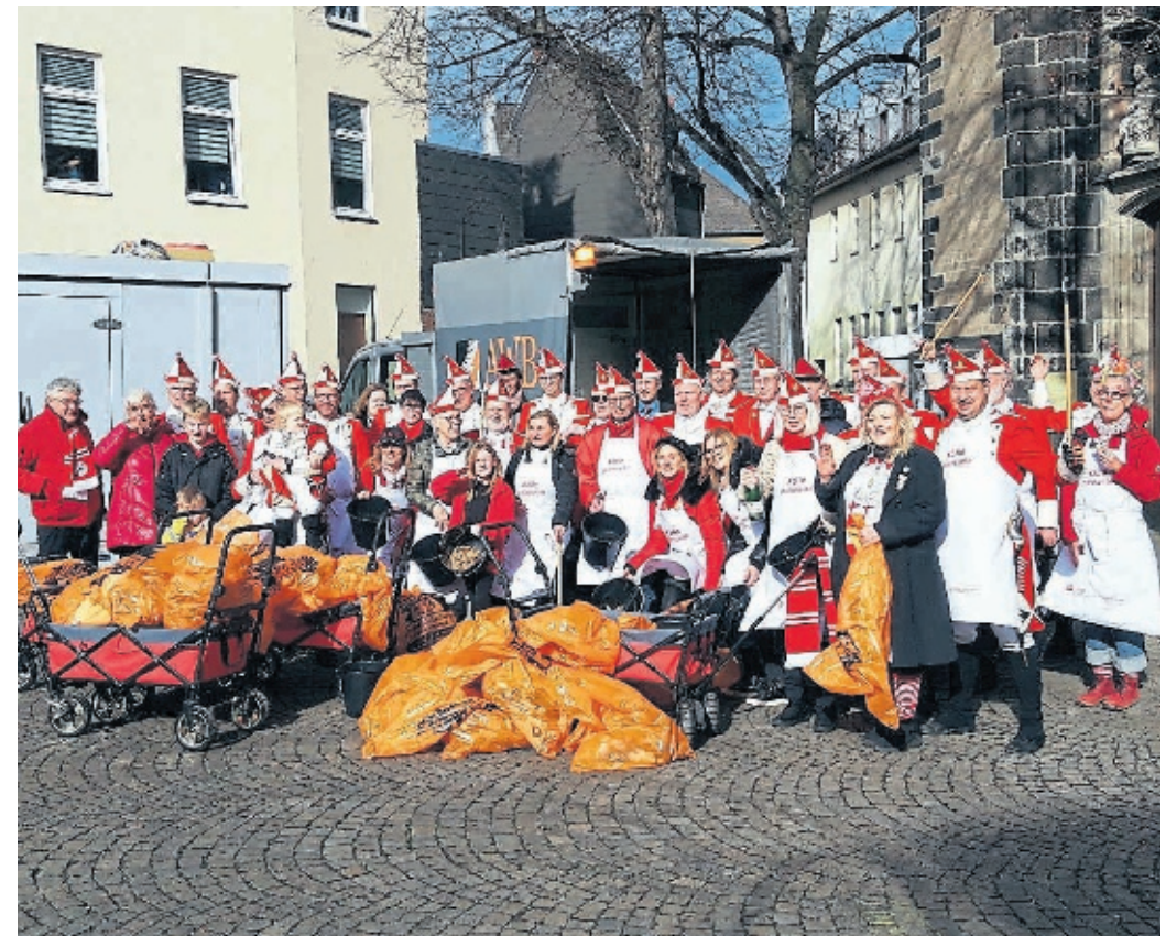
Selbst die Roten Funken haben sich schon bei Kölle putzmunter beteiligt.