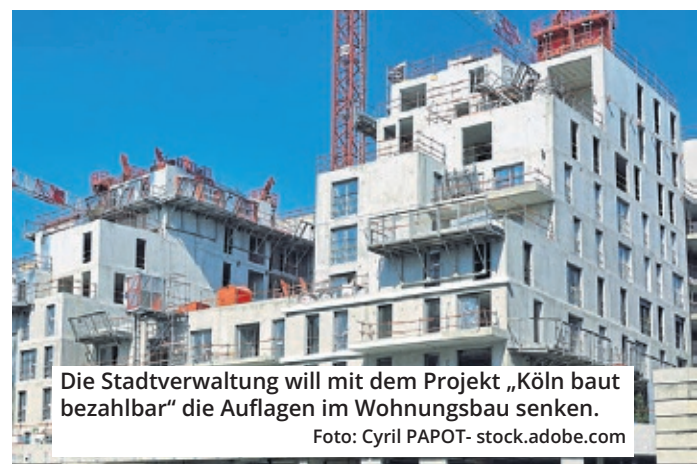
Die Stadtverwaltung will mit dem Projekt „Köln baut bezahlbar“ die Auflagen im Wohnungsbau senken.

Verwaltung bis zum Ende des Jahres grundlegend überarbeiten. Vor allem Genossenschaften mit kleineren Bauvorhaben sollen es leichter haben. Der dritte Punkt ist eine Änderung des Kooperativen Baulandmodells. Das schreibt unter anderem vor, dass Investoren beim Bau größerer Projekte auch Grünflächen, Spielplätze und Kitas mitbauen müssen. Von zum Beispiel 10.000 Quadratmetern bleiben dann mitunter nur 6000 übrig, auf denen tatsächlich Wohnungen entstehen - 60 Prozent also. Dieser Anteil soll erhöht werden. Zum anderen soll der Faktor verän-