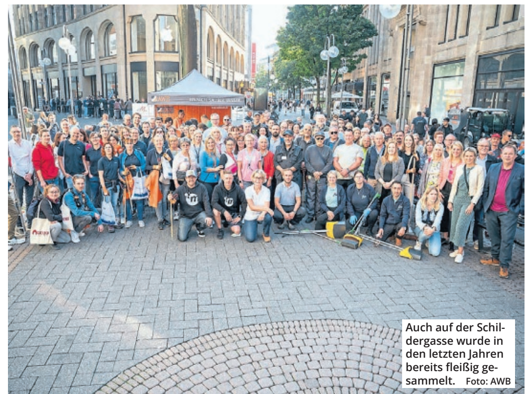
Auch auf der Schildergasse wurde in den letzten Jahren bereits fleißig gesammelt.