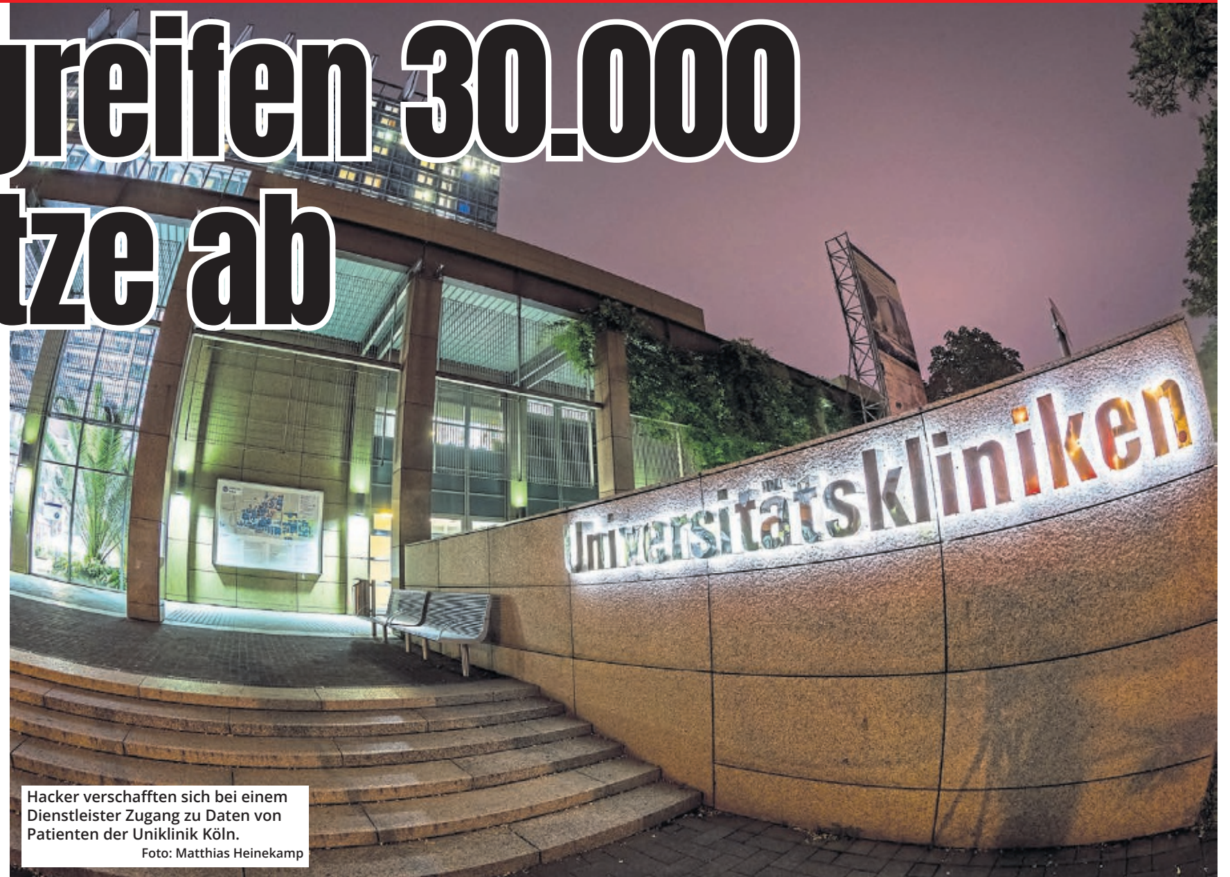
Hacker verschafften sich bei einem Dienstleister Zugang zu Daten von Patienten der Uniklinik Köln.

Die Uniklinik Köln kündigt an, alle betroffenen Patientinnen und Patienten in diesen Tagen persönlich per Brief zu informieren. Wer