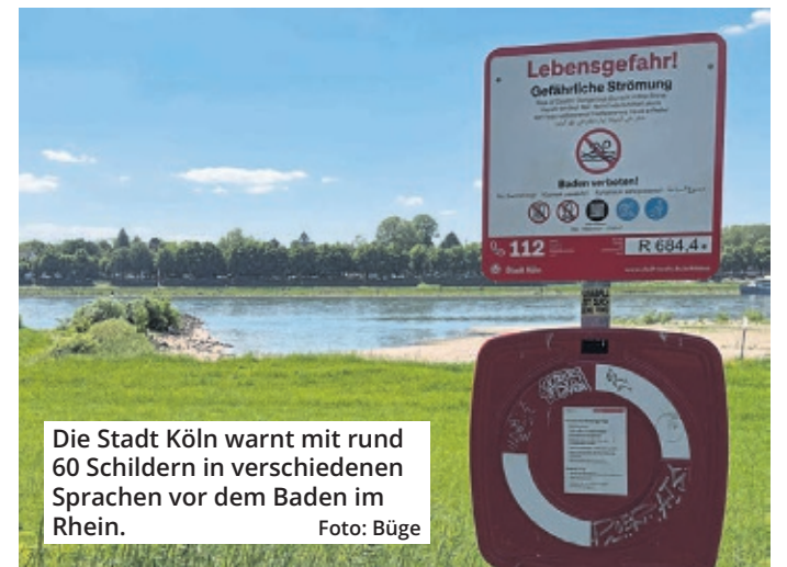
Die Stadt Köln warnt mit rund 60 Schildern in verschiedenen Sprachen vor dem Baden im Rhein.