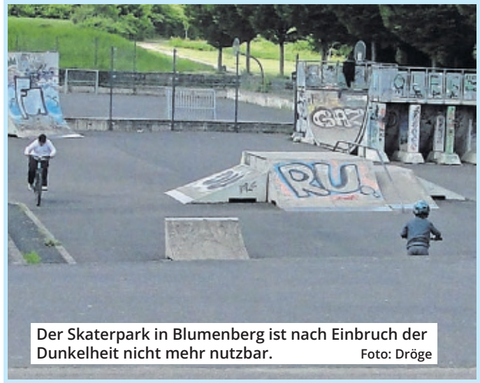
Der Skaterpark in Blumenberg ist nach Einbruch der Dunkelheit nicht mehr nutzbar.

„Der Skaterpark ist ein zentraler Treffpunkt für Jugendliche und junge Erwachsene, die Nutzung ist in den Wintermonaten durch die fehlende Beleuchtung aber stark eingeschränkt“, so Ridwan Nurhusen (SPD). Mit einer effizienten und schonenden Beleuchtung könne der Skaterpark auch in den Abendstunden genutzt werden. Beide Anträge fanden die Zustimmung der BV.