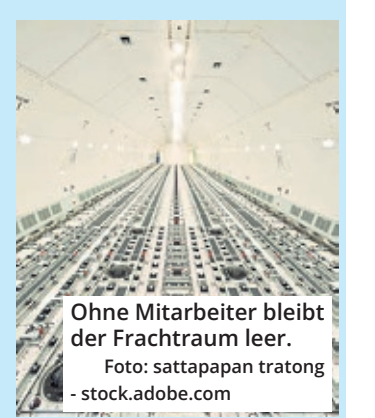
Ohne Mitarbeiter bleibt der Frachtraum leer.

UPS Cologne äußerte sich bislang nicht zu dem Vorgehen.