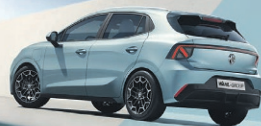
Abb. zeigt aufpreispflichtige Sonderausstattung. Horst Wahl GmbH & Co. KG | Ferdinand-Porsche-Str. 24 | D-51149 Köln +49 2203 1882-0 | www.wahl-group.de