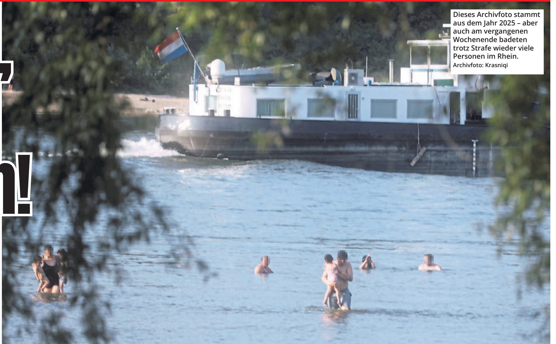
Dieses Archivfoto stammt aus dem Jahr 2025 – aber auch am vergangenen Wochenende badeten trotz Strafe wieder viele Personen im Rhein.