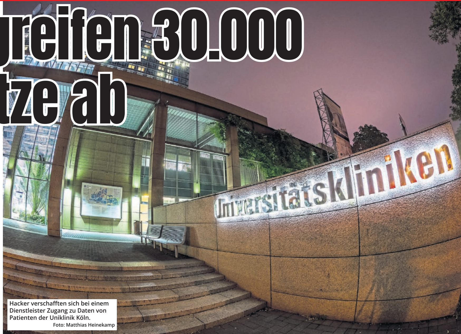
Hacker verschafften sich bei einem Dienstleister Zugang zu Daten von Patienten der Uniklinik Köln.

Die Uniklinik Köln kündigt an, alle betroffenen Patientinnen und Patienten in diesen Tagen persönlich per Brief zu informieren. Wer