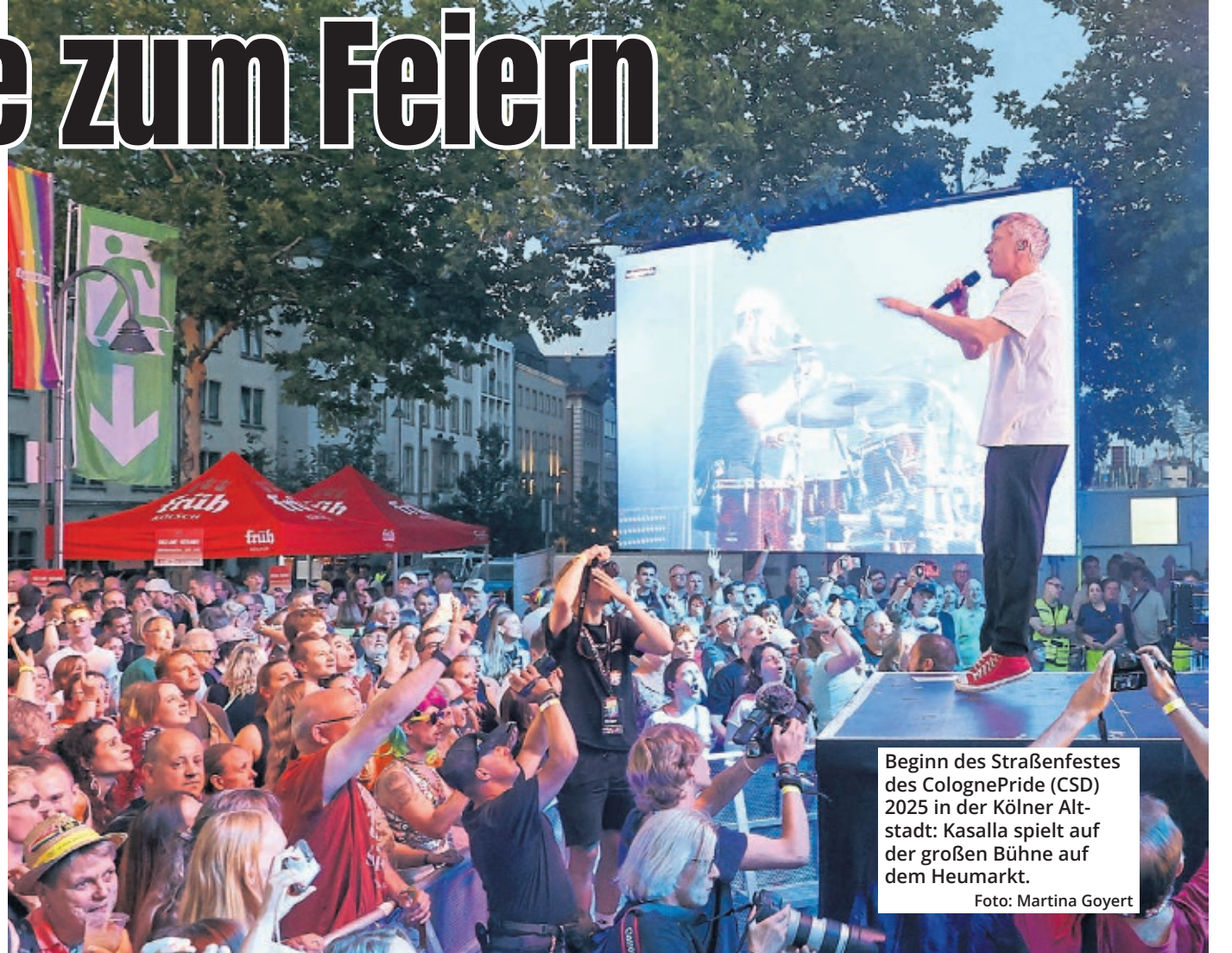
Beginn des Straßenfestes des ColognePride (CSD) 2025 in der Kölner Altstadt: Kasalla spielt auf der großen Bühne auf dem Heumarkt.

Die Hauptbühne steht traditionell auf dem Heumarkt. Dort treten zum Beispiel Darsteller des Musicals „Romeo & Julia“, die Band Die Räuber,