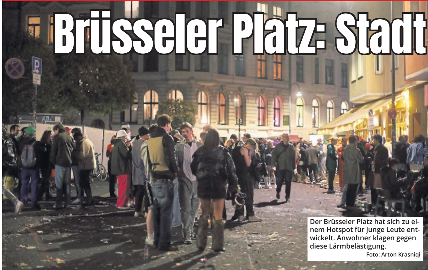
Der Brüsseler Platz hat sich zu einem Hotspot für junge Leute entwickelt. Anwohner klagen gegen diese Lärmbelästigung.

Köln. Im seit Jahren schwellenden Streit um Partylärm auf dem Brüsseler Platz muss die Stadt jetzt mit finanziellen Folgen rechnen. Laut Verwaltungsgericht Köln haben Anwohner einen Antrag auf Vollstreckung eines Zwangsgeldes in Höhe von 5000 Euro gestellt, über den jetzt das Gericht entscheiden muss. In der vergangenen Woche hatte das Obergericht (OVG) für das Land Nordrhein-Westfalen entschieden, dass eine Zwangsgeldandrohung rechtens sei. Die Gerichte bestätigen damit die Ansicht von Anwohnern, dass die Stadt nach einem Urteil des OVG vom 28. September 2023 den Lärmschutz nicht wie vom Gericht gefordert effektiv umgesetzt habe. Dabei geht es um gesundheits-