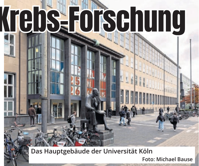
Das Hauptgebäude der Universität Köln