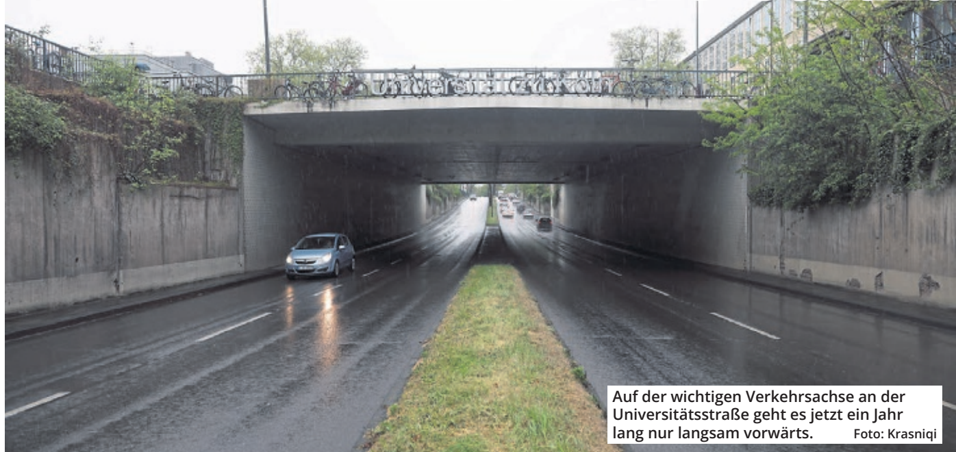
Auf der wichtigen Verkehrsachse an der Universitätsstraße geht es jetzt ein Jahr lang nur langsam vorwärts.

Köln. Wer mit dem Fahrzeug die Universitätsstraße nutzt, muss derzeit viel Geduld aufbringen. Eine neue Engstelle existiert jetzt auf dieser stark genutzten Route. Die Stadtverwaltung saniert die Stützwände bei der Unterführung am Albertus-Magnus-Platz. Aus diesem Grund gibt es in der Zone momentan Verkehrsbeeinträchtigungen. Insbesondere während des Berufsverkehrs entstehen längere Staus. Dieser Zustand wird noch eine Weile andauern: Laut Angaben der Stadt sollen die Behinderungen durch die Bauarbeiten für etwa ein Jahr bestehen bleiben. Die renovierungsbedürftigen Mauern bestehen aus