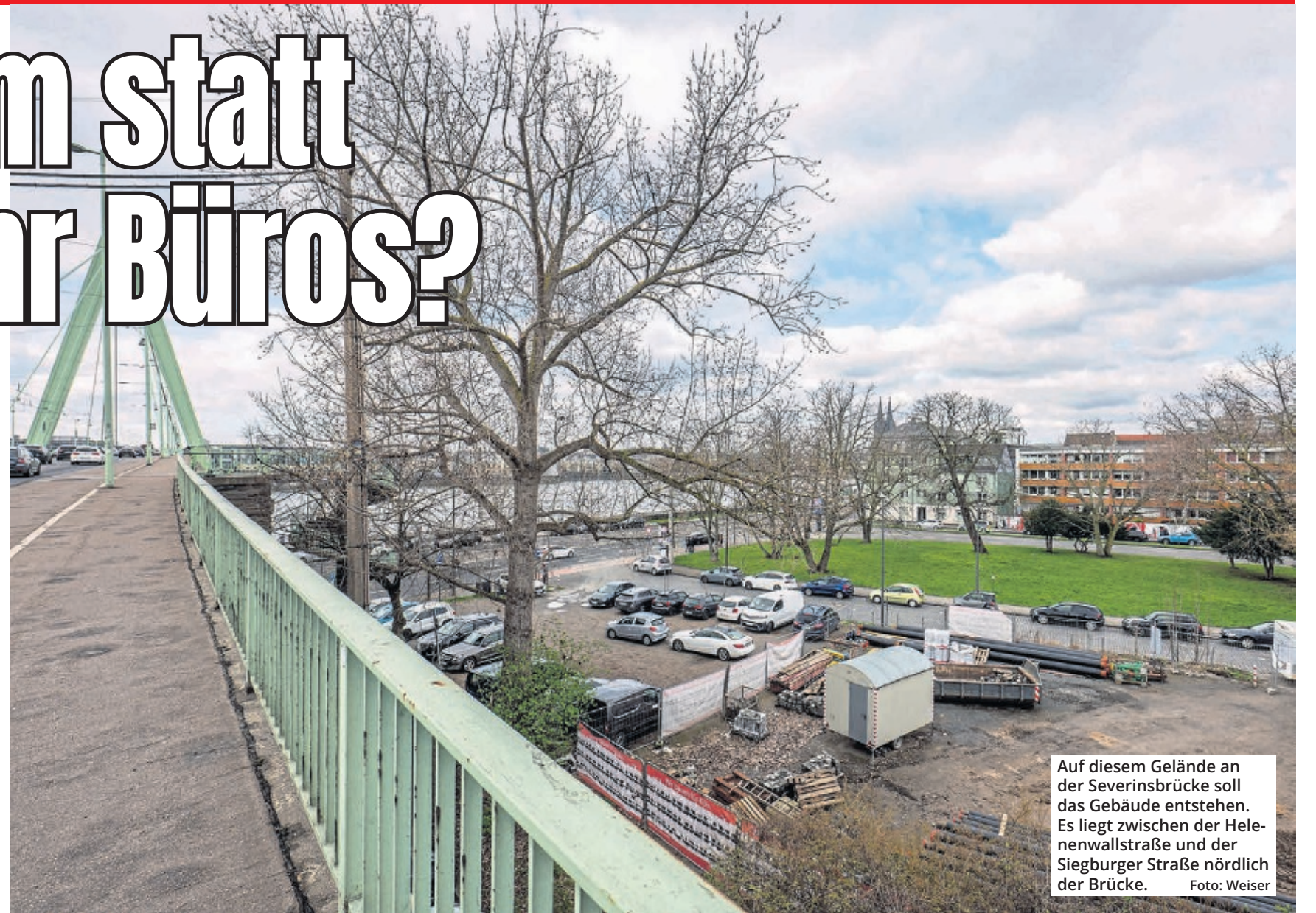
Auf diesem Gelände an der Severinsbrücke soll das Gebäude entstehen. Es liegt zwischen der Helenenwallstraße und der Siegburger Straße nördlich der Brücke.

Die BV plädiert jetzt dafür, das städtische Grundstück nicht zu verkaufen, sondern nach Erbbaurecht für 80 Jahre zu vergeben. Dies habe den Vorteil, dass die Mieten nach Auslaufen der Sozialbindung an die Richtlinien zur öffentlichen Wohnraumförderung des Landes NRW gebunden werden müssten. Bei der Vergabe sollten ausschließlich „Bestandhalter“ wie etwa gemeinnützige Wohnungsbau-Genossenschaften berücksichtigt werden. Besonderes Au-