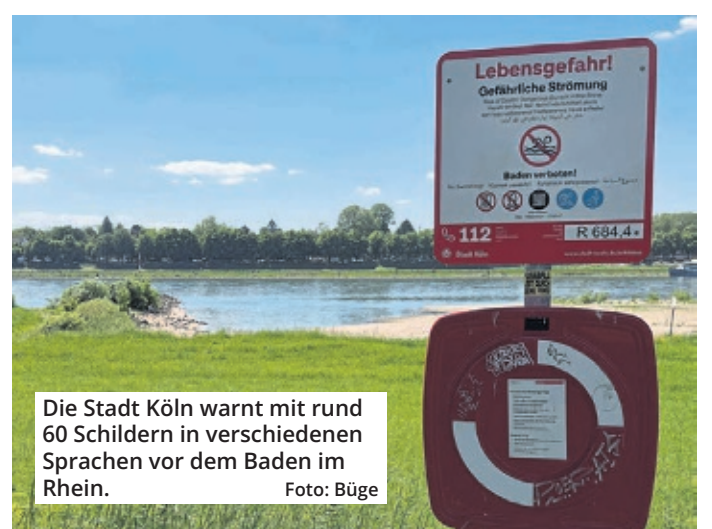
Die Stadt Köln warnt mit rund 60 Schildern in verschiedenen Sprachen vor dem Baden im Rhein.