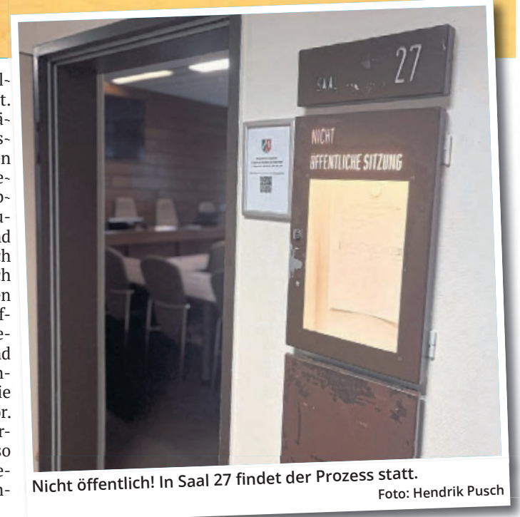
Nicht öffentlich! In Saal 27 findet der Prozess statt.

Als mutmaßlichen Attentäter ausgemacht hat die Staatsanwaltschaft einen 28-jährigen Syrer, der zuletzt im schwedischen Oxie bei Malmö lebte. Der Mann wurde im Februar in Schweden verhaftet und vor rund einem Monat nach Deutschland ausgeliefert. Nach polizeilichen Ermittlungen sollte der 28-Jährige als Auftragstäter den Kölner erschießen und dafür mehrere tausend Euro erhalten. Die Staatsanwaltschaft bereitet derzeit die Anklage gegen den Mann vor. Gegen den Erwachsenen würde öffentlich verhandelt – so könnten dann endlich alle Details zu der Auftragstat offenbart werden.