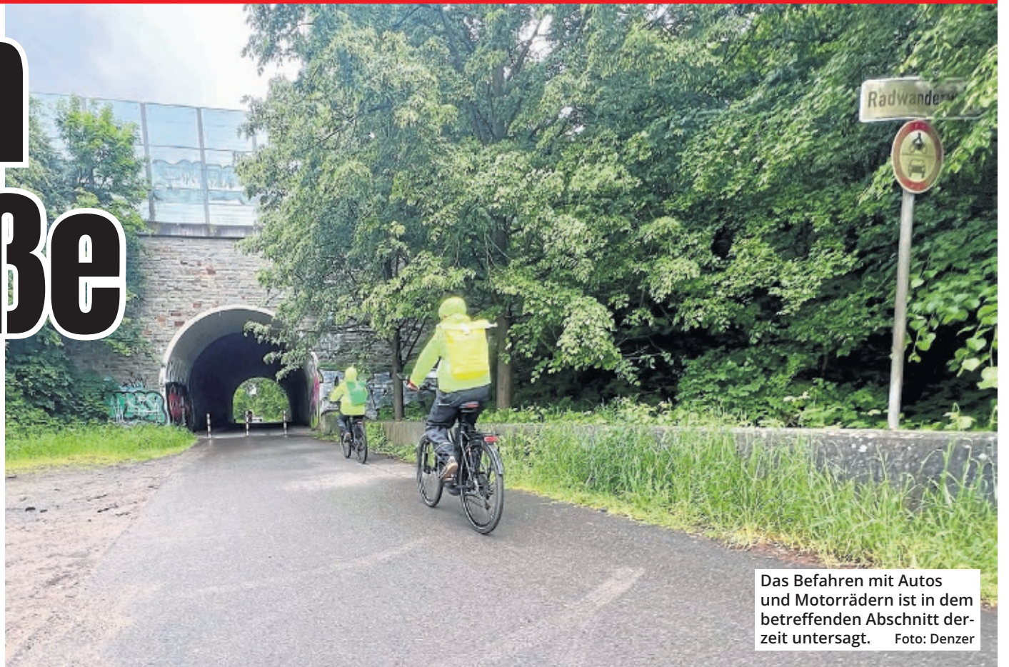
Das Befahren mit Autos und Motorrädern ist in dem betreffenden Abschnitt derzeit untersagt.

Die Straße in der Westhovener Aue ist Bestandteil verschiedener Radverkehrskonzepte im Stadtbezirk Porz. Auch ist sie ein Teil der nördlichen Alternative der Radpendler-Route 4. Dieses Routennetz richtet sich primär an Radlerinnen und Radler aus den äußeren Stadtbezirken und den Gemeinden im Umland. Ziel des Netzes ist es, auf mittleren und längeren