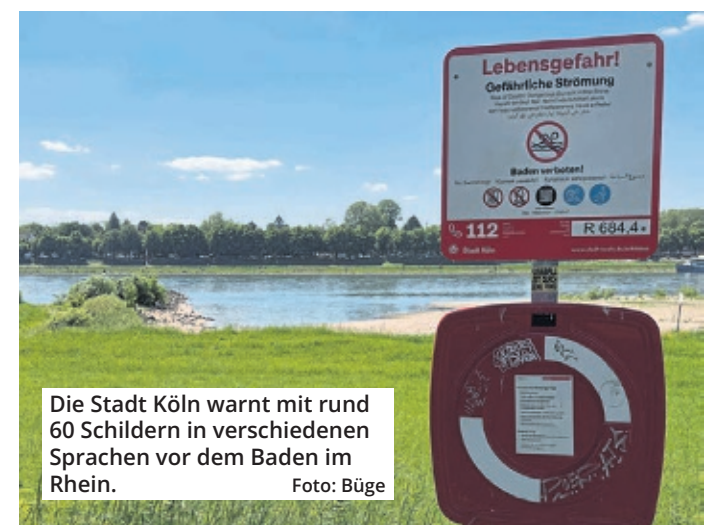
Die Stadt Köln warnt mit rund 60 Schildern in verschiedenen Sprachen vor dem Baden im Rhein.