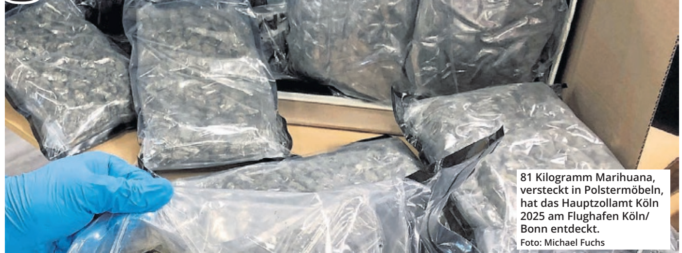
81 Kilogramm Marihuana, versteckt in Polstermöbeln, hat das Hauptzollamt Köln 2025 am Flughafen Köln/Bonn entdeckt.

Bei ihren Kontrollen stellten die Fahnder 148 Waffen sicher – nach 118 im Vorjahr, ein Anstieg um 25 Prozent. Im Bereich der Produktpiraterie wurden Waren im Wert von fast 15 Millionen Euro beschlagnahmt – darunter „mehr als 150.000 gefälschte Taschen, Uhren, Schuhe, Brillen, Bekleidung, Mobiltelefone, aber auch gefährliches Kinderspielzeug und Kfz-Teile“, so Denner.