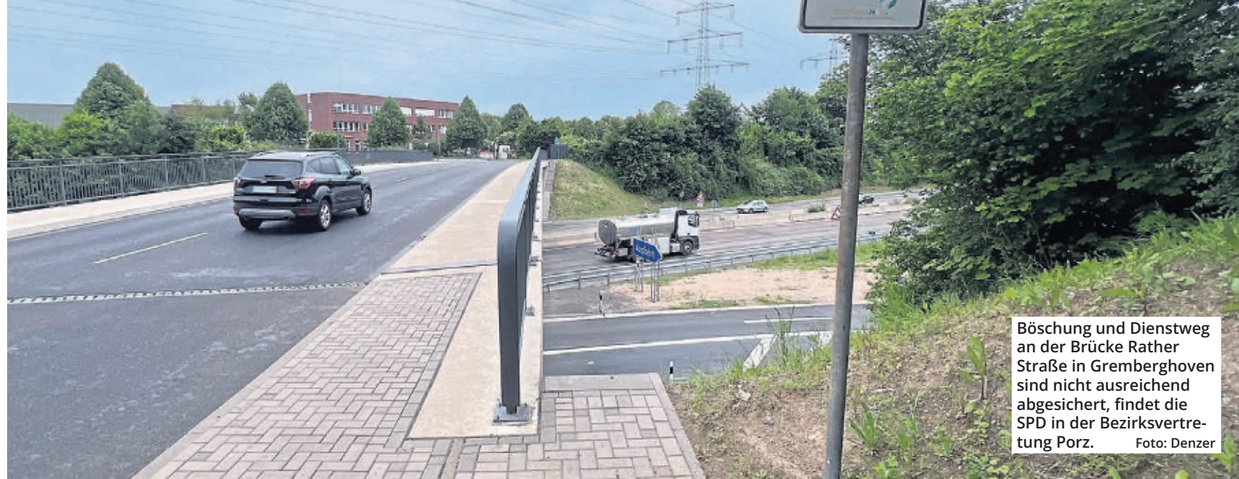
Böschung und Dienstweg an der Brücke Rather Straße in Gremberghoven sind nicht ausreichend abgesichert, findet die SPD in der Bezirksvertretung Porz.