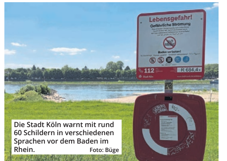
Die Stadt Köln warnt mit rund 60 Schildern in verschiedenen Sprachen vor dem Baden im Rhein.