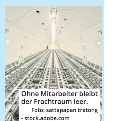
Ohne Mitarbeiter bleibt der Frachtraum leer.

UPS Cologne äußerte sich bislang nicht zu dem Vorgehen.