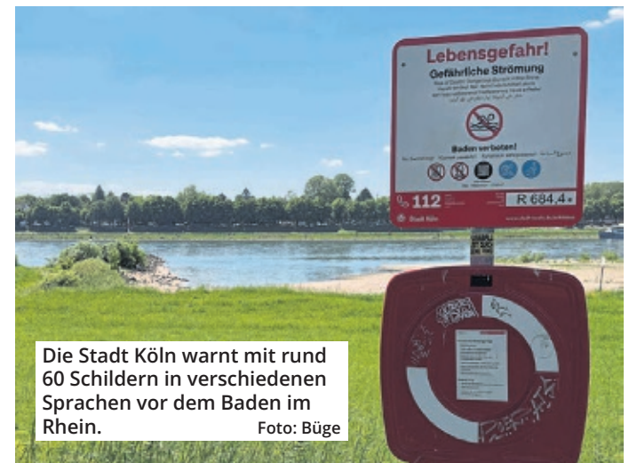
Die Stadt Köln warnt mit rund 60 Schildern in verschiedenen Sprachen vor dem Baden im Rhein.

Su säht mer en Kölle Jrön steit alle Jekke schön