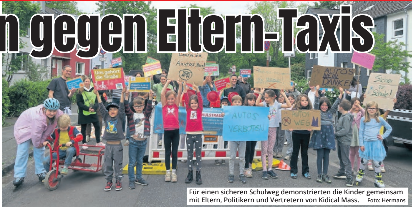
Für einen sicheren Schulweg demonstrierten die Kinder gemeinsam mit Eltern, Politikern und Vertretern von Kidical Mass.

Außerdem sei die Wilhelm-Schreiber-Straße für den Hol- und Bring-Verkehr einfach nicht breit genug: „Es bilden sich häufig Rückstaus“, sagt ten Hoevel, der schätzt, dass 20 bis 30 Prozent der mehr als 300 Schüler von ihren Eltern mit dem Auto zur Schule gebracht werden. Das gefährde zu Fuß gehende Schüler auch ohne den unvollständigen Wendehammer. Nun müssen Schule und Eltern die Erkenntnisse aus der Aktionswoche auswerten: Könnte