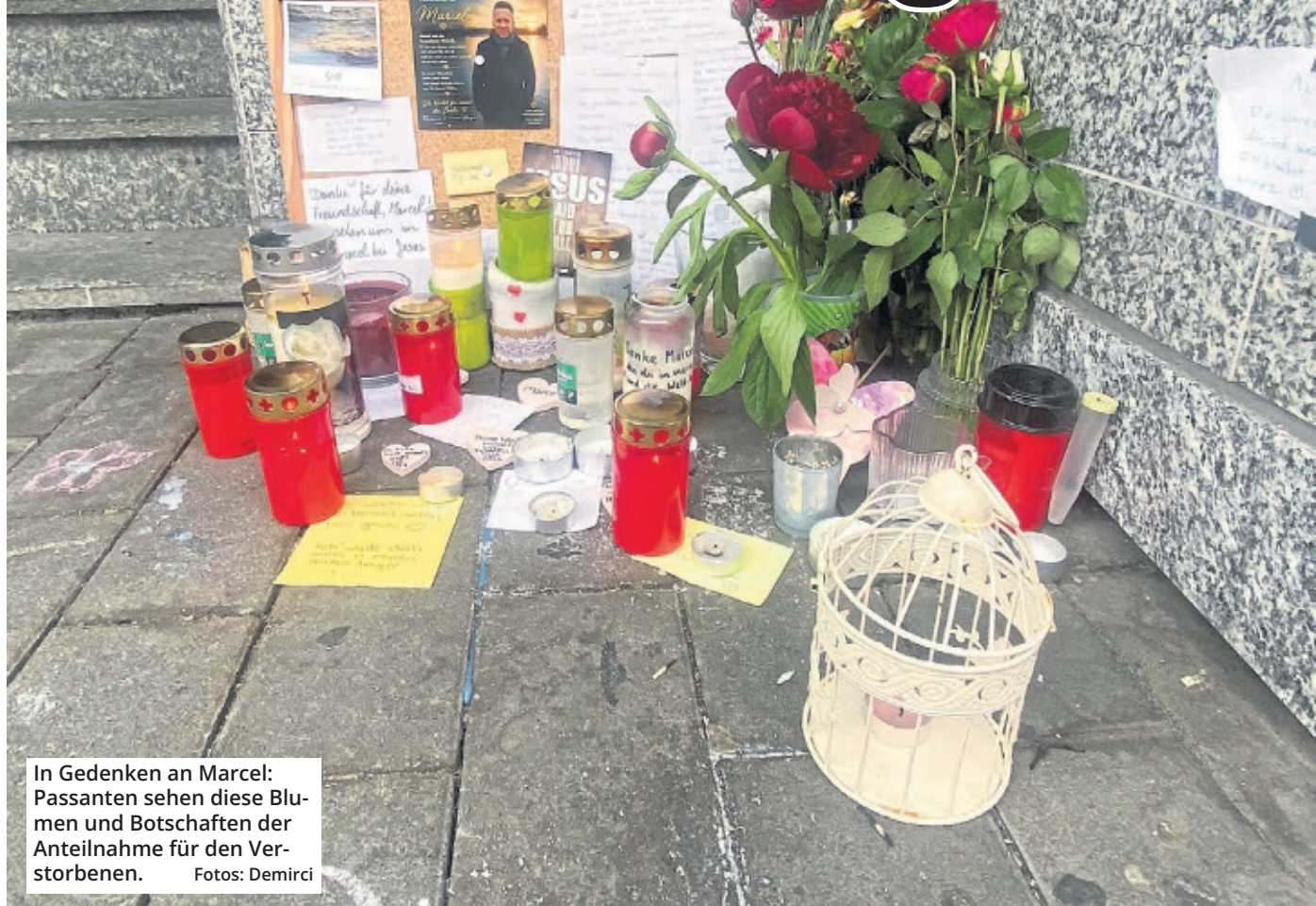
In Gedenken an Marcel: Passanten sehen diese Blumen und Botschaften der Anteilnahme für den Verstorbenen.