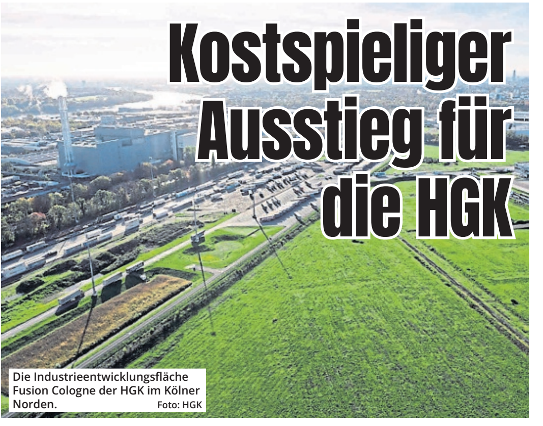
Die Industrieentwicklungsfläche Fusion Cologne der HGK im Kölner Norden.