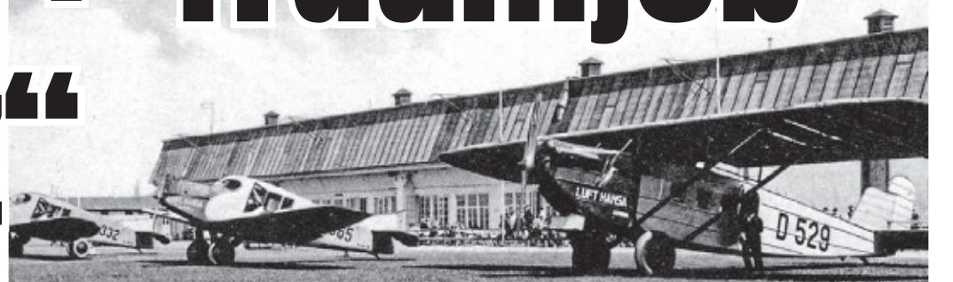
Die Front des Flughafens Köln-Butzweilerhof mit zwei Junkers F13 („Elster“ und „Kleiber“) und einer Dornier Merkur B Komet III „Schakal“.