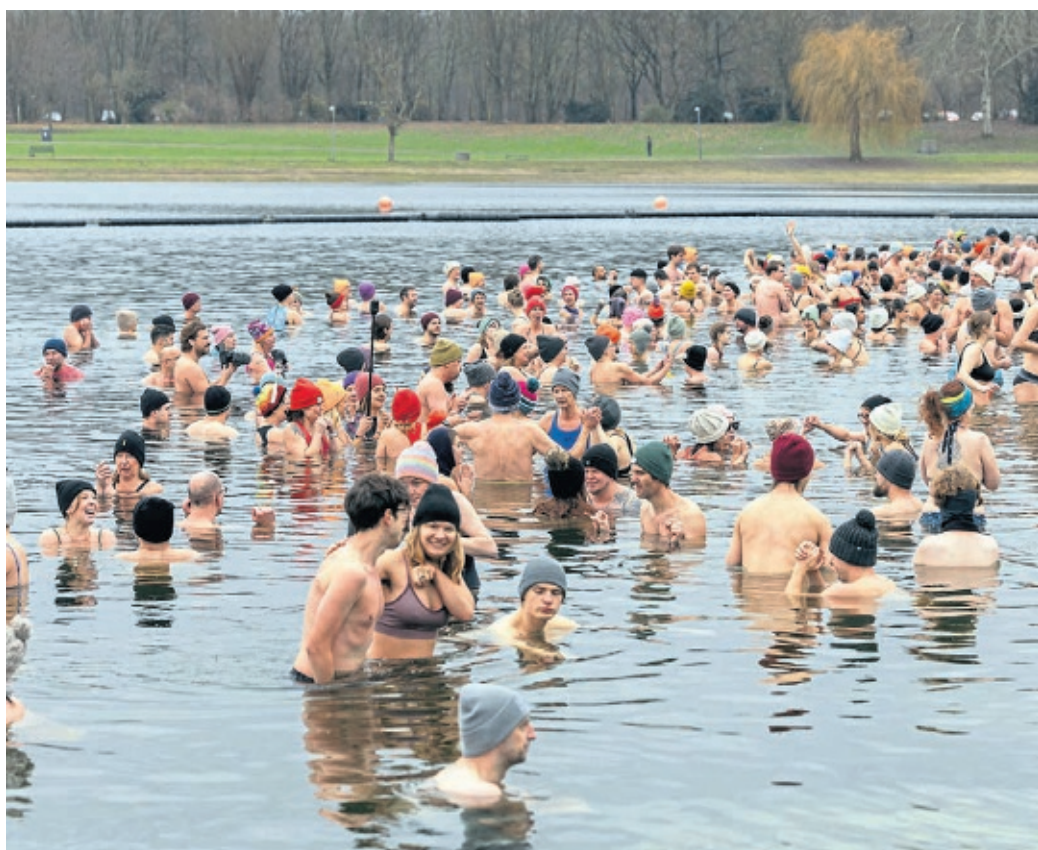
Am Blackfoot Beach des Fühlinger Sees kann man sich ebenfalls abkühlen.