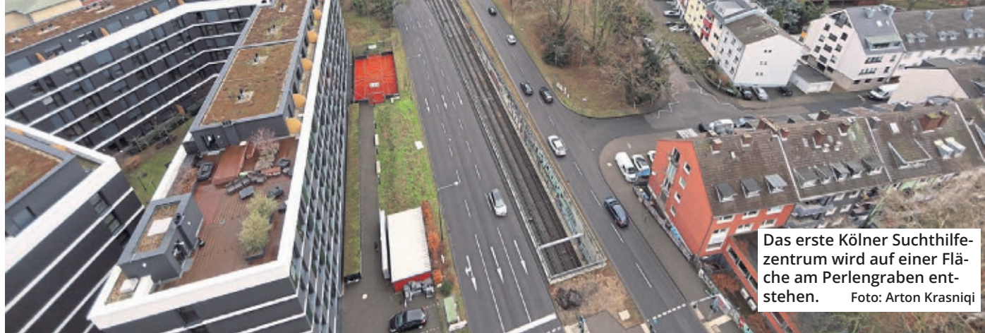
Das erste Kölner Suchtzentrum wird auf einer Fläche am Perlengraben entstehen.

Das erste Kölner Suchtzentrum für Schwerstabhängige wird auf einer Fläche zwischen dem Perlengraben und der Wilhelm-Hoßdorf-Straße entstehen. Der Stadtrat hat den Bau in seiner jüngsten Sitzung mit deutlicher Mehrheit beschlossen.