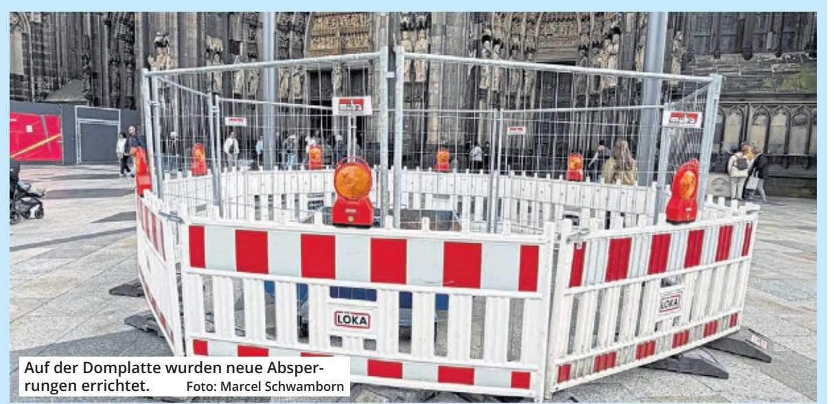
Auf der Domplatte wurden neue Absperrungen errichtet.

Die neuen Arbeiten auf der Domplatte sollen nun Aufschluss darüber geben, wie stark die Abdichtung der Tiefgaragendecke beschädigt ist – und welche weiteren Schritte nötig werden. Heißt: Die Baustellen-Ära auf der Domplatte ist noch lange nicht vorbei.