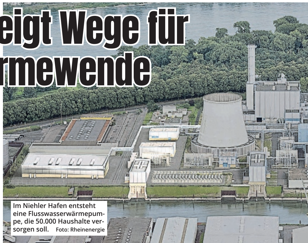
Im Niehler Hafen entsteht eine Flusswasserwärmepumpe, die 50.000 Haushalte versorgen soll.

Köln. Mit der ersten kommunalen Wärmeplanung gibt es nun eine strategische Planungshilfe für eine klimafreundliche Wärmeversorgung im Stadtgebiet. Für viele Kölner ist das Thema näher am Alltag, als es zunächst klingt. Denn wenn irgendwann die alte Heizung raus muss, stellt sich schnell die Frage: Was passt zum eigenen Haus, zur Straße, zum Veedel? Genau hier soll die Kommunale Wärmeplanung Orientierung geben. Sie zeigt, welche Möglichkeiten einer klimaneutralen Wärmeversorgung künftig grundsätzlich in Be-