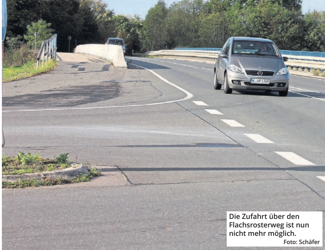
Die Zufahrt über den Flachsrosterweg ist nun nicht mehr möglich.

Bezirksbürgermeister Vincent Morawietz (SPD) zeigt sich angesichts des Vorgangs fassungslos. Zum einen hatte das Mobilitätsdezernat die Politiker erst vier Tage vor der BV-Sitzung informiert und zu einer Dringlichkeitsentscheidung aufgefordert, und zum anderen keine Verkehrsanalyse vorgelegt, um die Auswirkungen einer reinen Fußgänger- und Radfahrer-Brücke zu untersuchen. Und jetzt sollen die Politiker in der BV auch noch dafür verantwortlich sein, dass gar keine Ersatzbrücke kommt. „Mir ist die Schwierigkeit der aktuellen Situation, in der sich die Stadt befindet - Investitionsstau, sinkende Einnahmen, steigende Ausgaben - durchaus bewusst. Und dennoch muss ich deutlich machen, dass ein solches Vorgehen aus meiner Sicht nicht akzeptabel sowie nicht unbedingt vertrauenssteigernd ist“, schreibt Morawietz in einem offenen Brief an Mobilitätsdezernent Egerer und Oberbürgermeister Thorsten Burmester (SPD). Und: „Ich erwarte, dass seitens der zuständigen Fach-