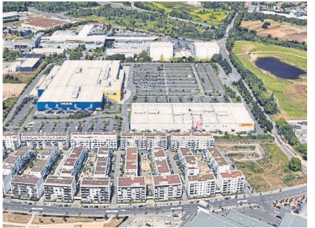
Das Flughafen-Areal damals (oben) und heute (unten): Als Orientierung dient rechts die Straße sowie Straßengabelung nach Longerich.

Trotz der Erfolge: Es handelte sich bei der Anlage nur um eine umgebaute Fliegerstation – also ein Provisorium. Deshalb wurde ab 1935 in der Nähe der elegante Neubau errichtet, von dem denkmalgeschützte Bereiche bis heute erhalten sind. Die Gebäude des ersten Kölner Flughafens jedoch wurden 1944 bei einem Bombenangriff fast alle vernichtet. Heute erinnert nichts mehr an die Anlage.