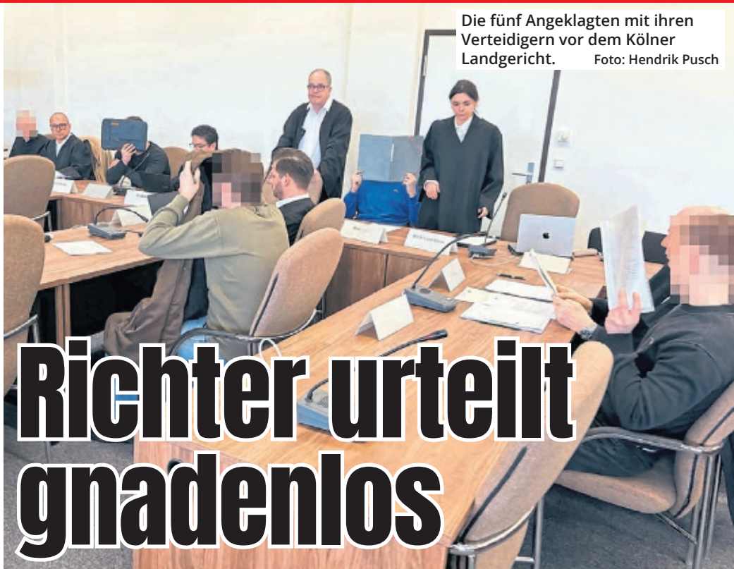
Die fünf Angeklagten mit ihren Verteidigern vor dem Kölner Landgericht.

Obwohl den jungen Männern klar sein musste, dass der Türsteher bereits bewusstlos war, hätten sie ihren Angriff einfach fortgesetzt. „Wach auf, du Hurensohn“, habe der Initiator des Angriffs noch gebrüllt. Der 20-Jährige habe noch mit