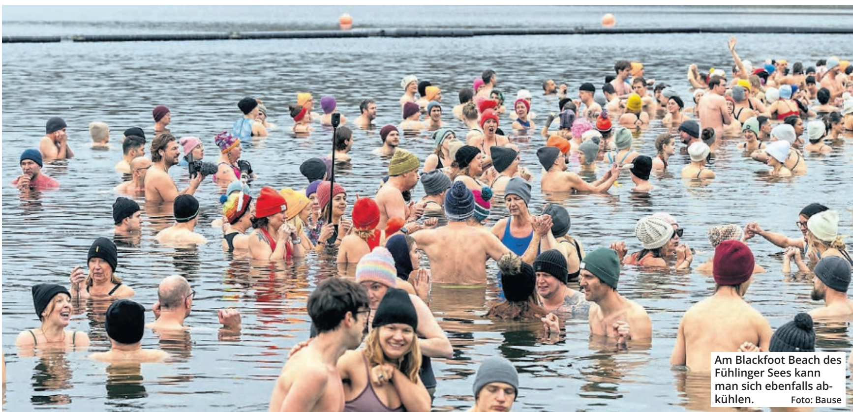
Am Blackfoot Beach des Fühlinger Sees kann man sich ebenfalls abkühlen.

Köln. Die Sport- und Erholungsanlage Fühlinger See ist die größte Anlage ihrer Art im Stadtgebiet. Sie ist aus einer ehemaligen Kiesgrube entstanden und wurde im Jahr 1978 eröffnet. Das etwa 200 Hektar große Areal bietet ein 19 Kilometer langes Wegenetz mit großzügigen Freiflächen und insgesamt sieben Teilseen. Diese laden Erholungssuchende