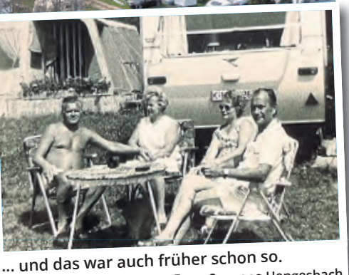
... und das war auch früher schon so.

ner und haben „seit dem ersten April nur zwei- oder dreimal zuhause“, also in Dellbrück geschlafen.“ Sie sitzen tagsüber stundenlang vor – und bei Wind – in ihrem Vorzelt und schauen hinunter zum Rhein, an dem man sich offenbar niemals sattsehen kann. „Jede Minute passiert etwas anderes.“ Und damit meinen sie nicht das Aufsehenerregende, was sie natürlich auch schon erlebt haben: Im Strom treibende Container, Extremhochwasser, spektakuläre Sonnenuntergänge oder die im Sommer nicht seltenen Auffahrunfälle direkt vor ihren Augen, weil Radfahrer beim Blick auf den Rhein regelmäßig auf den Vordermann krachen. Dann sind die Dahms mit Pflastern und Eiswürfeln zur Stelle.