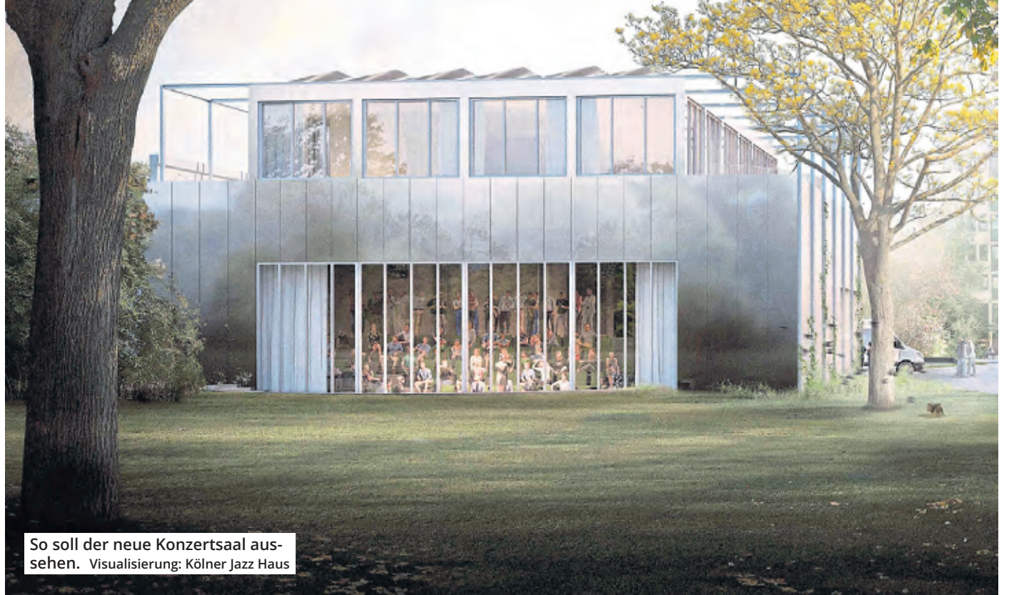
So soll der neue Konzertsaal aussehen. Visualisierung: Kölner Jazz Haus

Seit drei Jahren arbeitet die Initiative Kölner Jazz Haus e.V. an der Weiterentwicklung des Stadtgartens. Der bisherige Saal wurde im Jahr 1986 eröffnet und soll am 4. September 2026 sein 40-jähriges Bestehen feiern. In dieser Zeit hat der Stadtgarten seinen Schwerpunkt in den Bereichen Jazz und neue Improvisationsmusik gesetzt. 400 Veranstaltungen finden dort jedes Jahr statt. Nach Angaben der