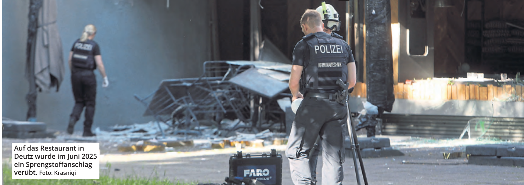
Auf das Restaurant in Deutz wurde im Juni 2025 ein Sprengstoffanschlag verübt.

hatte sogar eine Gesamtstrafe von vier Jahren und zwei Monaten beantragt. Die Verteidigung hingegen plädierte auf Freispruch. Rechtsanwalt Carsten Heinen beantragte hilfsweise, eine etwaige Strafe zur Bewährung auszusetzen. Rechtskräftig ist das von Richter Wolfgang Schorn verkündete Urteil nicht, der Angeklagte kann noch Revision beim Bundesgerichtshof einlegen.