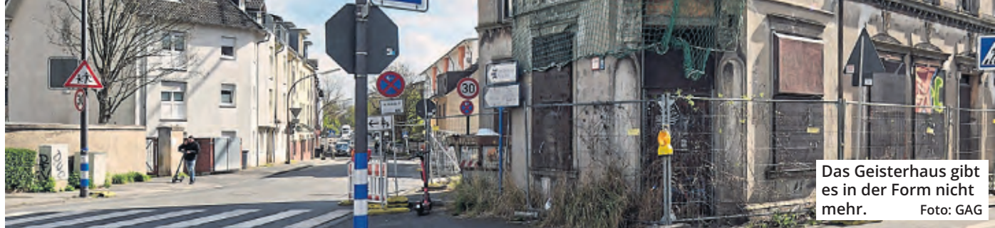
Das Geisterhaus gibt es in der Form nicht mehr.