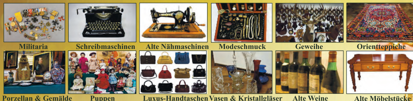
Militaria Schreibmaschinen Alte Nähmaschinen Modeschmuck Geweihe Orientteppiche Porzellan & Gemälde Puppen Luxus-Handtaschen Vasen & Kristallgläser Alte Weine Alte Möbelstücke