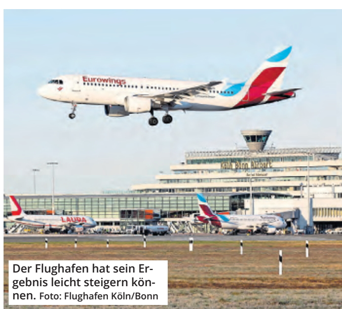
Der Flughafen hat sein Ergebnis leicht steigern können.