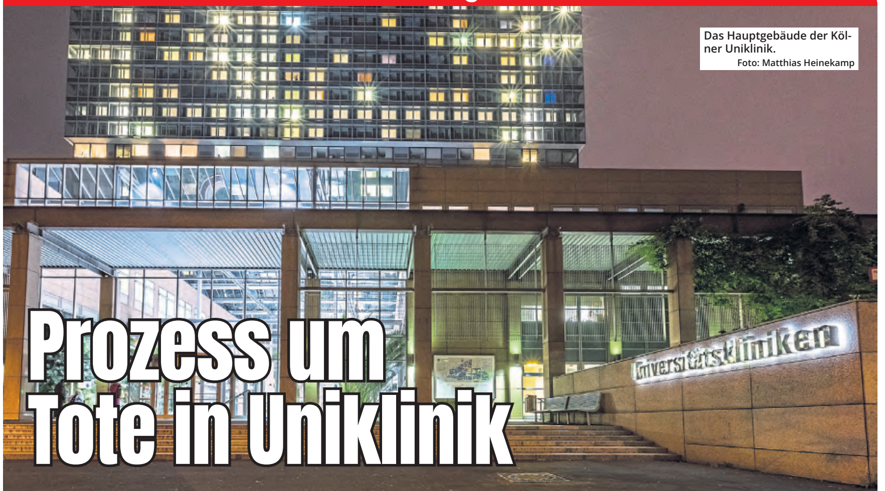
Das Hauptgebäude der Kölner Uniklinik.