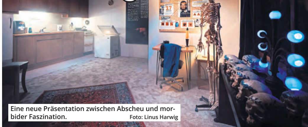
Eine neue Präsentation zwischen Abscheu und morbider Faszination.