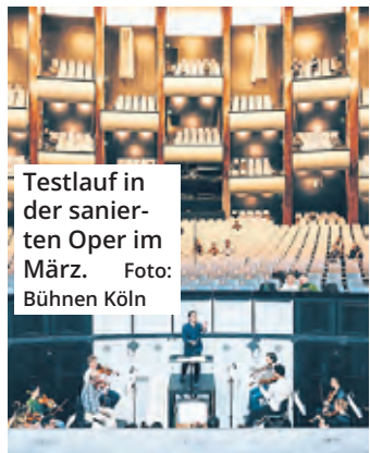
Testlauf in der sanierten Oper im März.