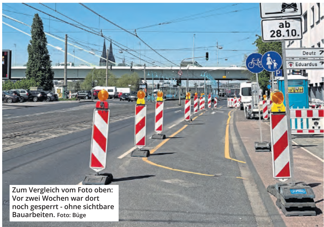
Zum Vergleich vom Foto oben: Vor zwei Wochen war dort noch gesperrt - ohne sichtbare Bauarbeiten. Foto: Büge

„Endlich wieder freie Fahrt auf der Siegburger Straße Richtung Severinsbrücke. Foto: Büge“