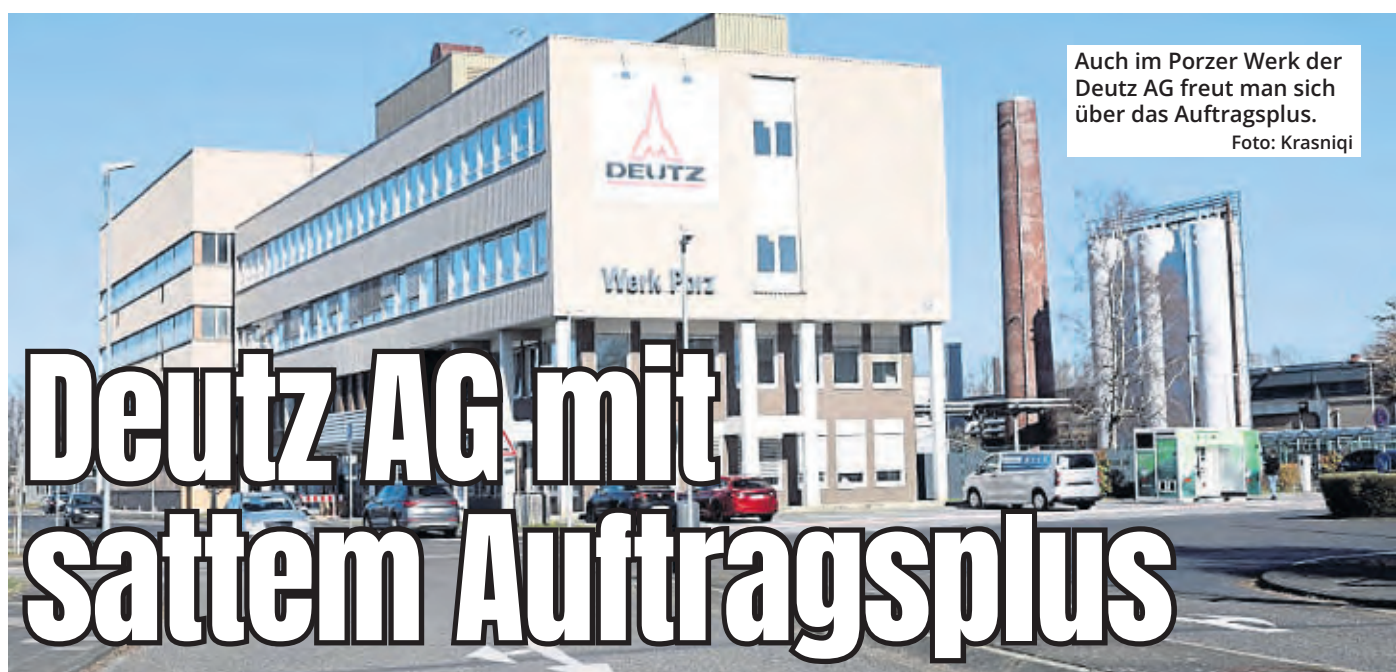
Auch im Porzer Werk der Deutz AG freut man sich über das Auftragsplus.

Doch die Stadt teilt nun mit: „Kürzlich ist in der Malteserstraße eine notwendige Anpassung des Notfallkonzeptes erfolgt. Die Stadt Köln geht davon aus, dass diese Anpassung dazu beitragen wird, die Zahl der Betreuungsausfälle zu reduzieren.“ Für die langzeiterkrankte Mitarbeiterin soll eine unbefristete Vertretung eingesetzt werden. Weitere vakante Stellen oder Langzeiterkrankungen gebe es nicht.