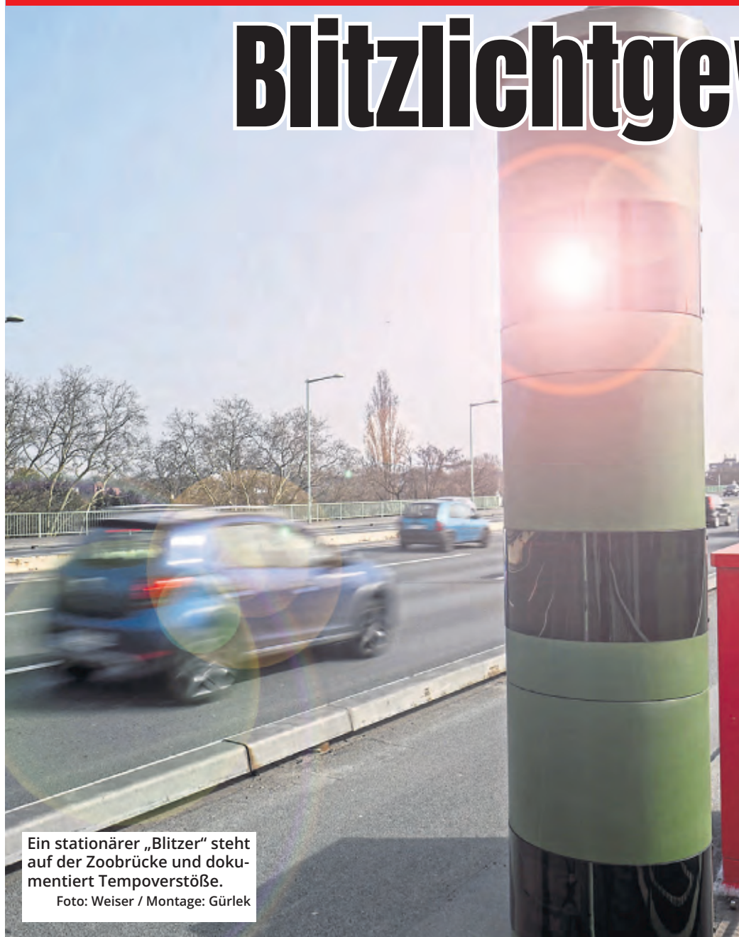
Ein stationärer „Blitzer“ steht auf der Zoobrücke und dokumentiert Tempoverstöße.