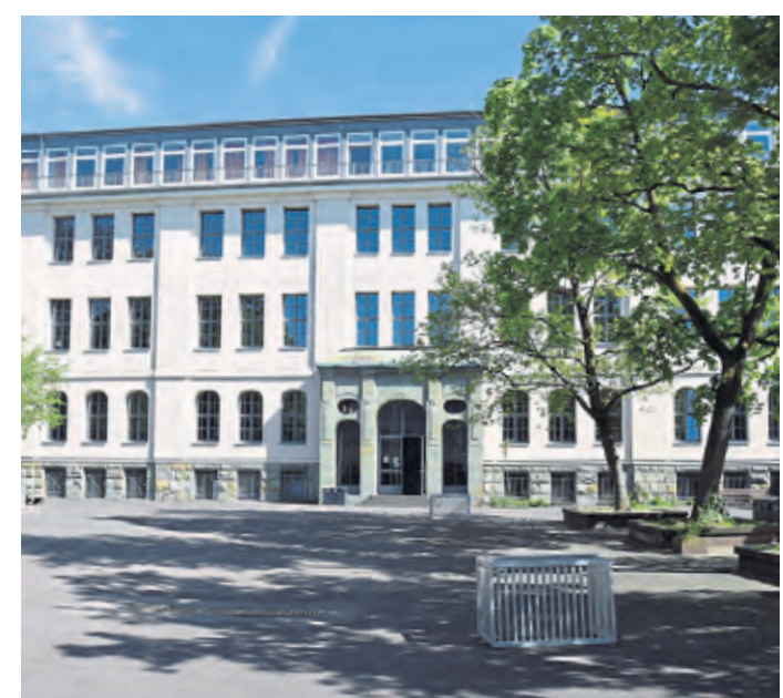
Das Genoveva-Gymnasium feiert sein 150-jähriges Bestehen.