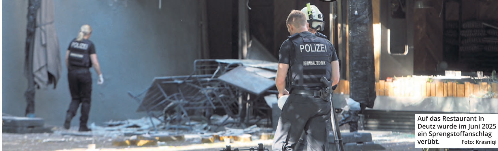
Auf das Restaurant in Deutz wurde im Juni 2025 ein Sprengstoffanschlag verübt.