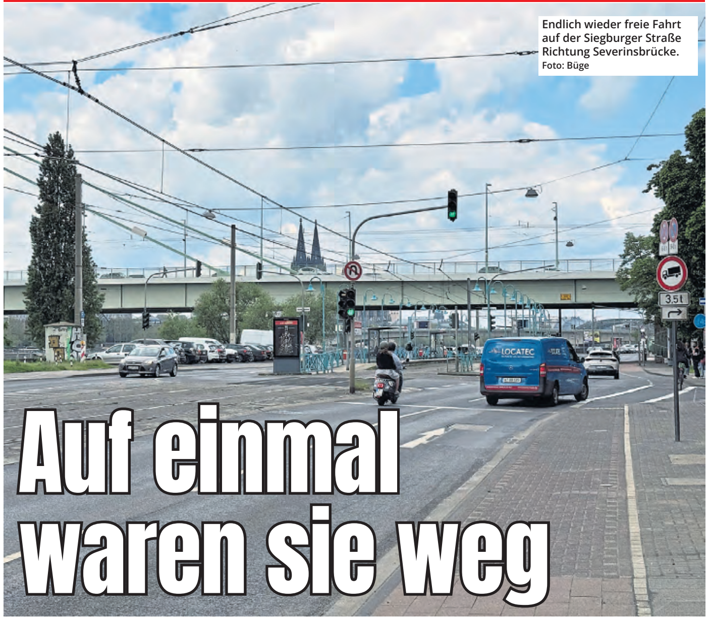
Endlich wieder freie Fahrt auf der Siegburger Straße Richtung Severinsbrücke.