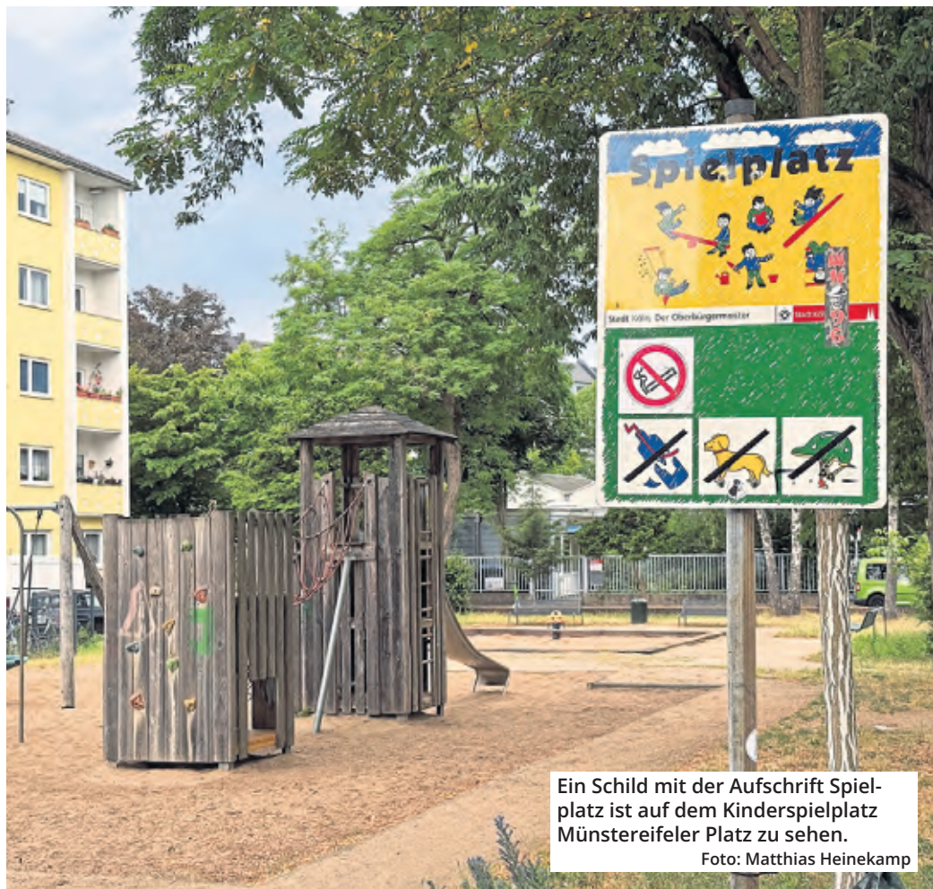
Ein Schild mit der Aufschrift Spielplatz ist auf dem Kinderspielplatz Münstereifeler Platz zu sehen.

Für die neuen Anschaffungen wird die Stadt das schon entworfene Design nutzen, nimmt aber von der kontroversen Benennung „Spiel- und Aktionsfläche“ Abstand. Eine offizielle Mitteilung stellt unmissverständlich fest: „An der Bezeichnung Spielplatz wird weiterhin festgehalten.“