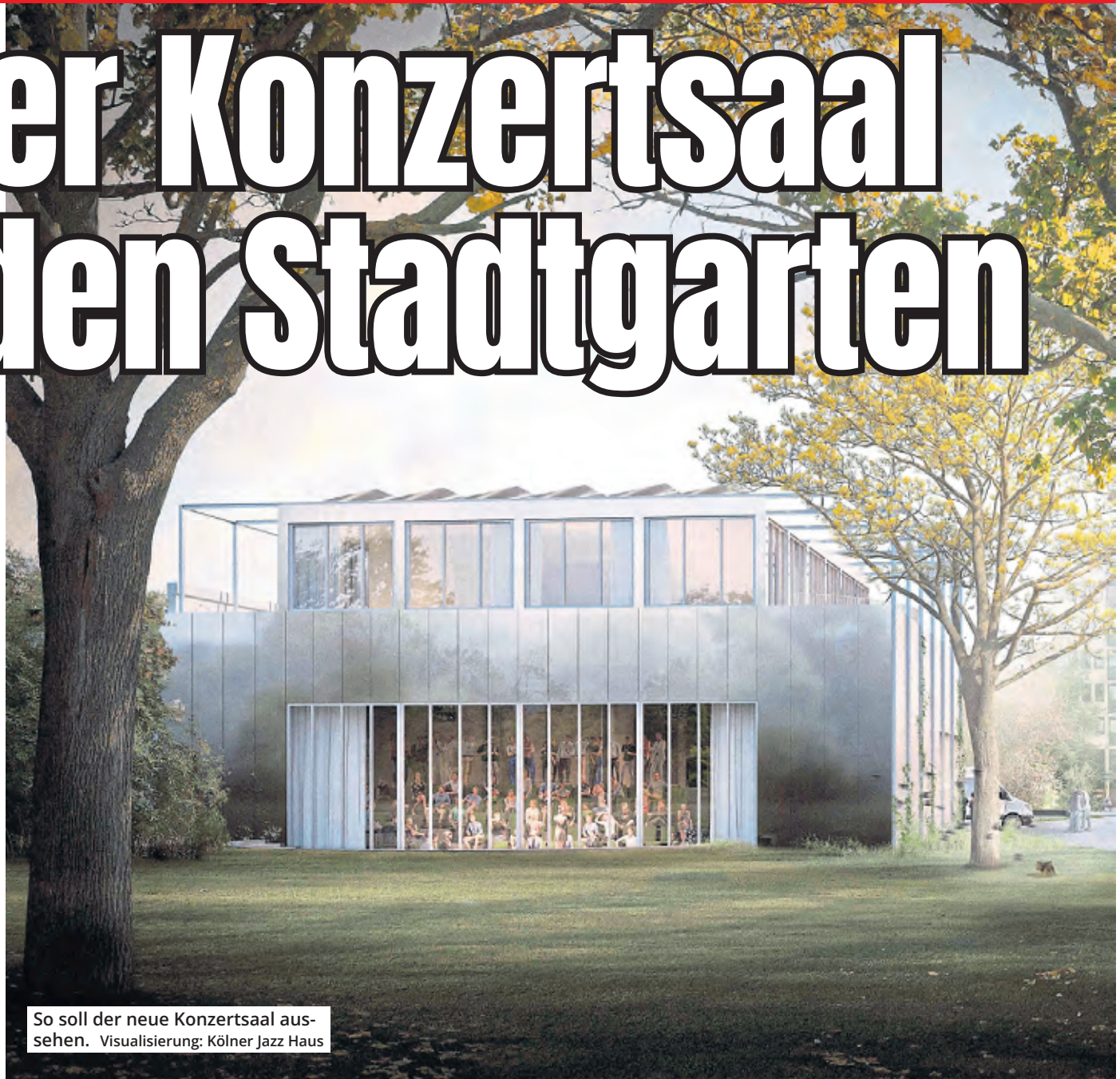
So soll der neue Konzertsaal aussehen. Visualisierung: Kölner Jazz Haus

Seit drei Jahren arbeitet die Initiative Kölner Jazz Haus e.V. an der Weiterentwicklung des Stadtgartens. Der bisherige Saal wurde im Jahr 1986 eröffnet und soll am 4. September 2026 sein 40-jähriges Bestehen feiern. In dieser Zeit hat der Stadtgarten seinen Schwerpunkt in den Bereichen Jazz und neue Improvisationsmusik gesetzt. 400 Veranstaltungen finden dort jedes Jahr statt. Nach Angaben der