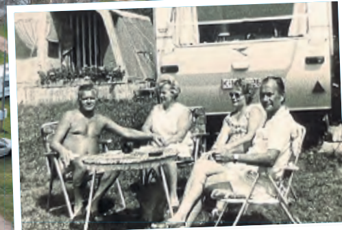
... und das war auch früher schon so.

ner und haben „seit dem ersten April nur zwei- oder dreimal zuhause“, also in Dellbrück geschlafen.“ Sie sitzen tagsüber stundenlang vor – und bei Wind – in ihrem Vorzelt und schauen hinunter zum Rhein, an dem man sich offenbar niemals sattsehen kann. „Jede Minute passiert etwas anderes.“ Und damit meinen sie nicht das Aufsehenerregende, was sie natürlich auch schon erlebt haben: Im Strom treibende Container, Extremhochwasser, spektakuläre Sonnenuntergänge oder die im Sommer nicht seltenen Auffahrunfälle direkt vor ihren Augen, weil Radfahrer beim Blick auf den Rhein regelmäßig auf den Vordermann krachen. Dann sind die Dahms mit Pflastern und Eiswürfeln zur Stelle.