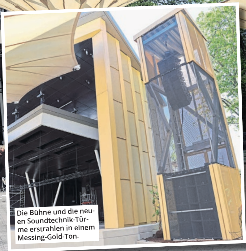
Die Bühne und die neuen Soundtechnik-Türme erstrahlen in einem Messing-Gold-Ton.