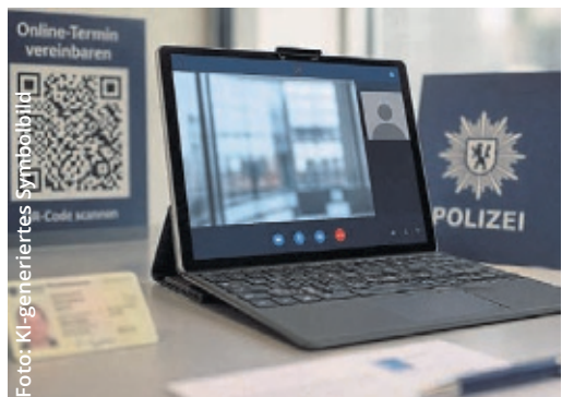
Foto: Kl-generiertes Symbolbild

Die Polizei weist darauf hin, dass in der Testphase nur begrenzte Kapazitäten zur Verfügung stehen und nicht von Beginn an alles reibungslos laufen dürfte. Wer den Service nutzt, hilft nach Angaben der Behörde dabei, Abläufe und Technik zu testen und mögliche Verbesserungen anzustoßen. Nach der Anzeigenaufnahme können Teilnehmende ihre Erfahrungen zudem in einer Umfrage mitteilen. In Notfällen oder bei schwerwiegenden Delikten gilt weiterhin: sofort die 110 wählen. (red.)