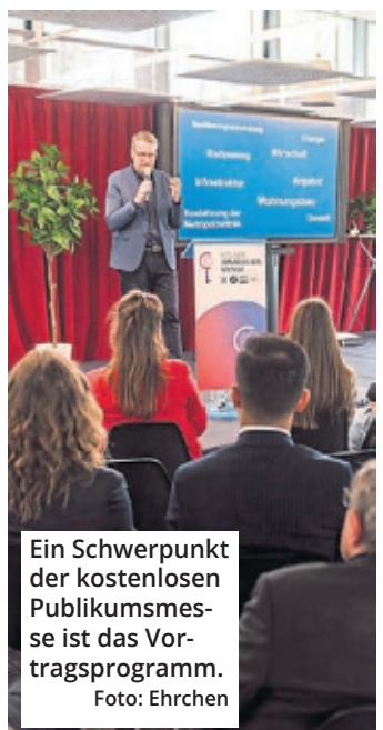
Ein Schwerpunkt der kostenlosen Publikumsmesse ist das Vortragsprogramm.