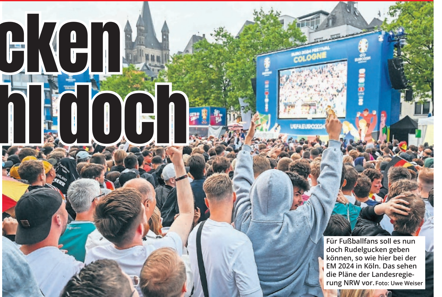
Für Fußballfans soll es nun doch Rudelgucken geben können, so wie hier bei der EM 2024 in Köln. Das sehen die Pläne der Landesregierung NRW vor.

Die Lautstärke soll in einem angemessenen Rahmen bleiben, damit es nicht zu Störungen kommt. Auch draußen darf in Köln während der WM gequackelt werden, allerdings nicht ohne klare Grenzen. Alle Spiele, die zwischen 6 und 22 Uhr