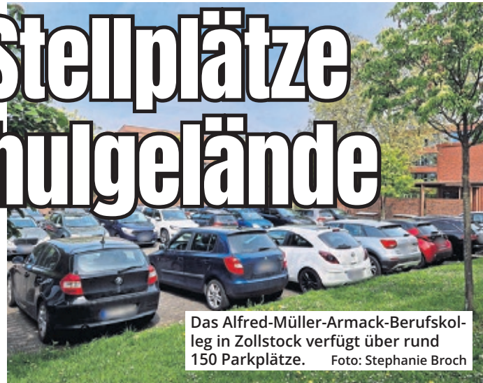
Das Alfred-Müller-Armack-Berufskolleg in Zollstock verfügt über rund 150 Parkplätze.

Zollstock. Feierabendparken wird seit Jahren als eine Möglichkeit diskutiert, den Parkdruck in den Veedeln in den Abend- und Nachtstunden zu mindern: Private oder öffentliche Stellplätze, die außerhalb ihrer regulären Nutzungszeiten leer stehen, werden Anwohnern kostengünstig zur Verfügung gestellt. Die Fahrzeuge müssen am nächsten Morgen in der Regel bis 7 Uhr morgens wieder weggefahren werden. In Köln läuft ein solcher Test bislang nur auf zwei Alldi-Parkplätzen in Ehrenfeld und Bickendorf. Für Zollstock hatten die Rodenkirchener Grünen nun einen eigenen Anlauf unternommen. Gemeinsam mit der SPD sowie den Einzelvertreterinnen von Volt und Linke beantragten sie in der jüngsten Sitzung der Bezirksvertretung, die Parkplätze des Alfred-Müller-Armack-Berufskollegs an der Brüggener Straße für das Feierabendparken prüfen zu lassen. Konkret ging es um rund 150 Stellplätze, die werktags zwischen 17 und 7 Uhr sowie sonntags ganztägig zumindest teilweise geöffnet werden sollten. „Das Berufskolleg bietet sich hierfür an, weil es ein städtisches Gelände ist. Es liegt daher allein bei der Stadt Köln, die Stellplätze für Feierabendparken zur Verfügung zu stellen“, begründete Bodo Schmidt von den Grünen