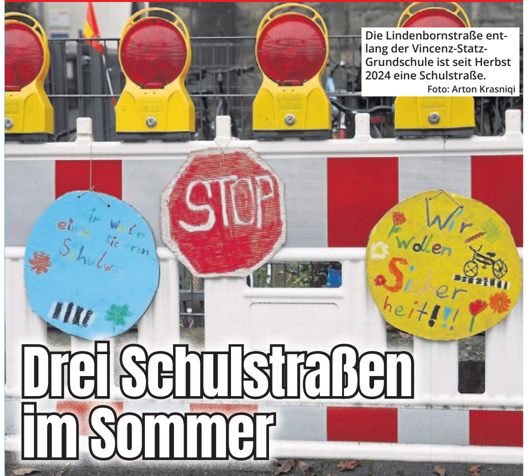
Die Lindenbornstraße entlang der Vincenz-Statz-Grundschule ist seit Herbst 2024 eine Schulstraße.