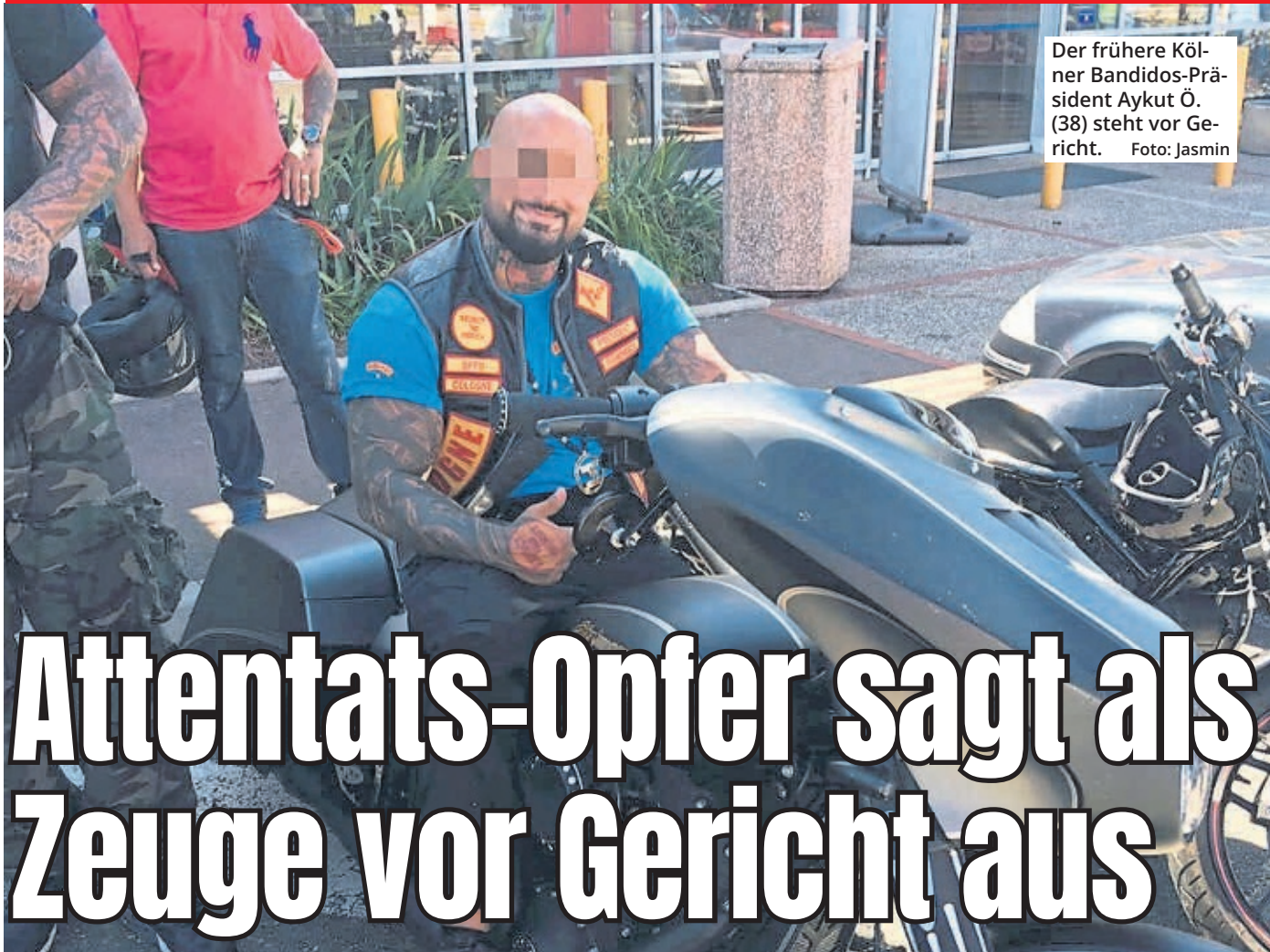
Der frühere Kölner Bandidos-Präsident Aykut Ö. (38) steht vor Gericht.