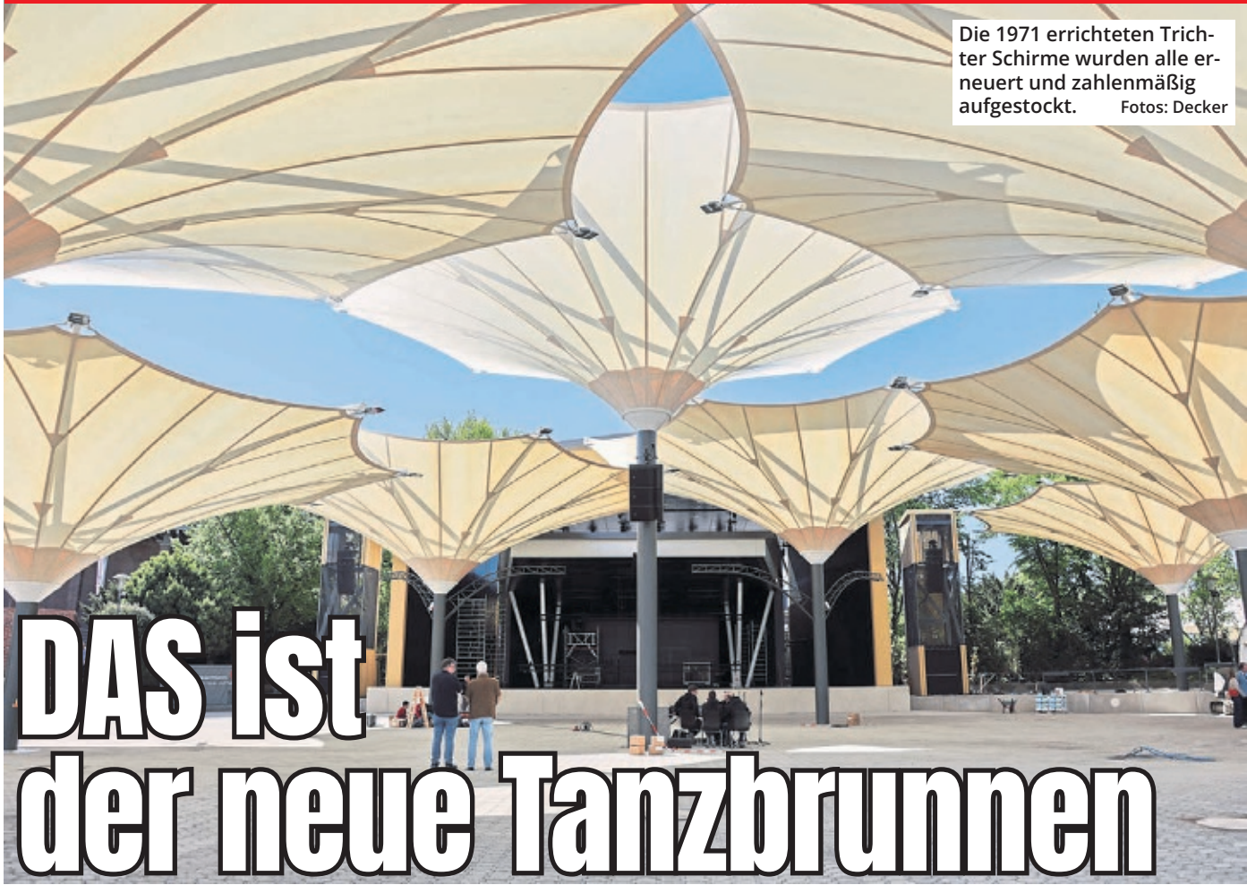
Die 1971 errichteten Trichter-Schirme wurden alle erneuert und zahlenmäßig aufgestockt.