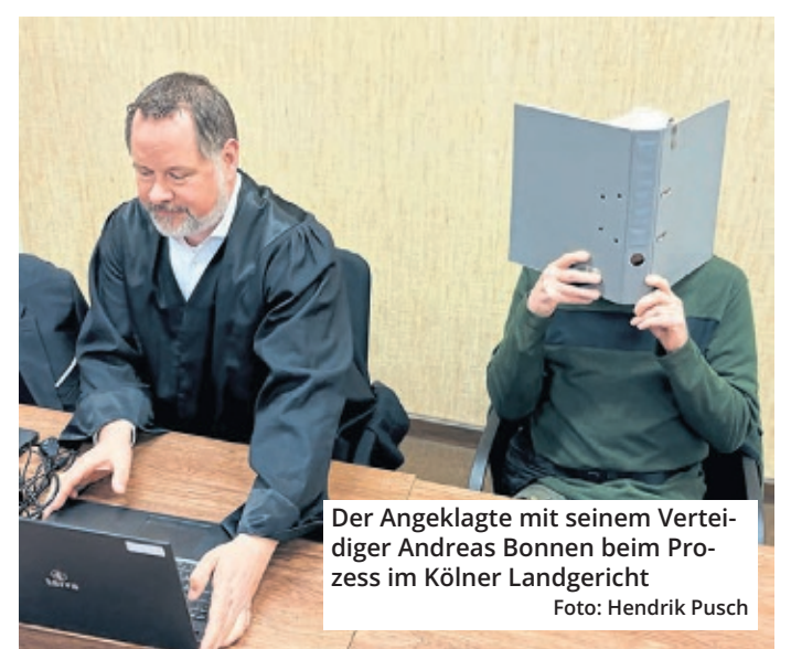
Der Angeklagte mit seinem Verteidiger Andreas Bonnen beim Prozess im Kölner Landgericht

Beim Prozessauftritt hatte der Angeklagte die psychischen Probleme seiner Frau beschrieben. Man habe viele Ärzte gemeinsam aufgesucht, doch ohne Besserung. Die Probleme seiner Frau hätten zu einer Entfremdung geführt – doch eine Scheidung sei nie Thema gewesen. Am Tattag habe er seine Frau in der Badewanne vorgefunden. Unter Tränen schilderte der Mann, ihren Körper aus der Wanne geholt zu haben. Das sei ihm schwergefallen, er habe das sicher etwas „brachial“ gemacht. Kernpunkt im Prozess ist die Klärung der Frage, woher die Verletzungen am Leichnam stammen – ob von einem gewaltsamen Herunterdrücken oder durch Rettungsmaßnahmen.