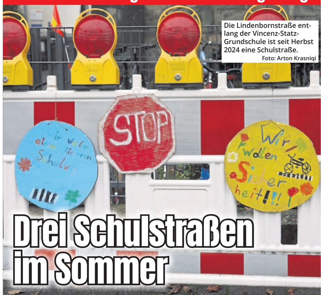
Die Lindenbornstraße entlang der Vincenz-Statz-Grundschule ist seit Herbst 2024 eine Schulstraße.