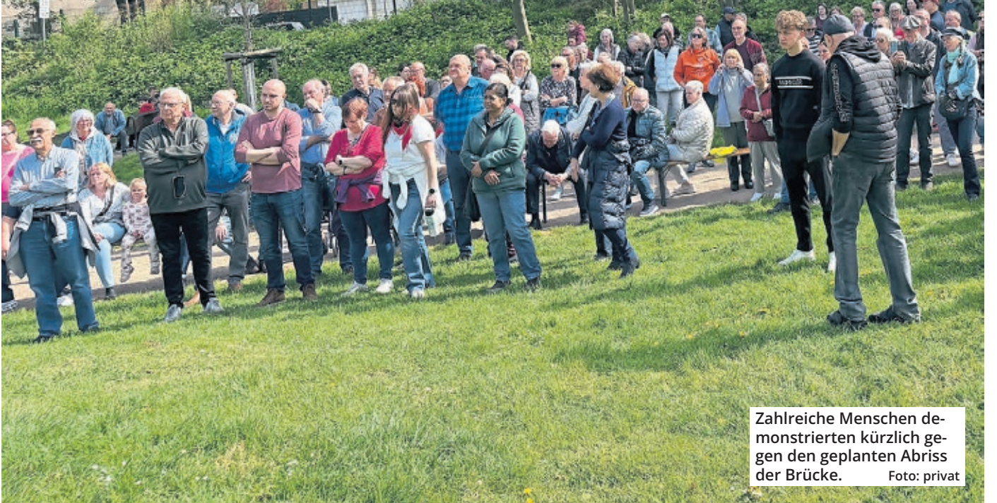
Zahlreiche Menschen demonstrieren kürzlich gegen den geplanten Abriss der Brücke.

Große Auswahl exklusiver Leuchten Beratung - Verkauf - Montage Räumungsverkauf auf ALLES * 30% wg. Sortimentswechsel LICHT u. WOHNEN Beleuchtungs-GmbH Leverkusen: Friedrich-Ebert-Str. 108 51373 Leverkusen www.luw-gmbh.de * Rabatt auf unsere Listenpreise in der Ausstellung - Filiale Leverkusen - Nur bis zum 31.05.