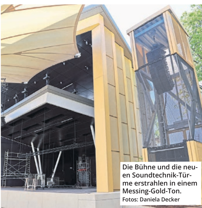
Die Bühne und die neuen Soundtechnik-Türme erststrahlen in einem Messing-Gold-Ton.