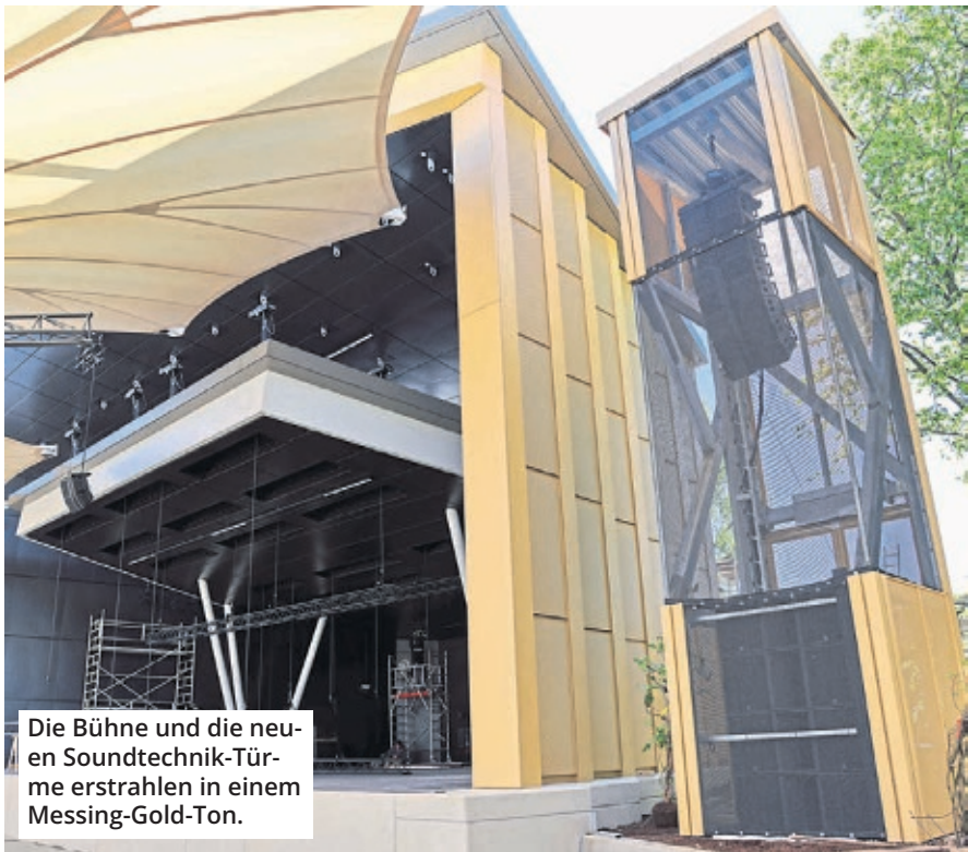
Die Bühne und die neuen Soundtechnik-Türme erstrahlen in einem Messing-Gold-Ton.

Die Saisonöffnung mit Cat Ballou an diesem Samstag, 9. Mai, ist schon länger ausverkauft. Wer an diesem Samstagabend aber bei hoffentlich schönem Frühlingwetter im Rheinpark unterwegs ist, kann vielleicht einen Blick auf das Feuerwerk nach dem Konzert erhaschen.