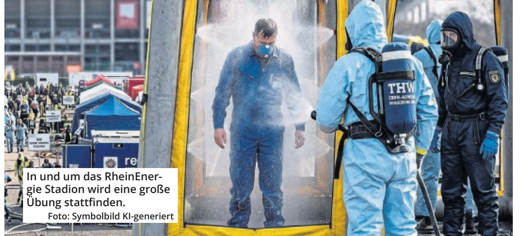
In und um das RheinEnergie Stadion wird eine große Übung stattfinden. Foto: Symbolbild KI-generiert

Hintergrund ist die Übung „resConEx2026“, die im Rahmen des EU-Projekts „rescEU CBRN Decon Germany“ organisiert wird. Dabei soll ein neues Auslandsteam trainieren, das für Dekontaminationsmaßnahmen nach CBRN-Lagen zuständig ist, also bei Gefahren durch chemische, biologische, radiologische oder nukleare Stoffe. Nach Angaben der Veranstalter geht es unter anderem um die Dekontamination von Personen, Kleingeräten, Fahrzeugen sowie von Infrastruktur und Gebäuden. Für die Teilnehmenden ist ein ganztägiger Ablauf vorgesehen. Die Übung soll um 7 Uhr beginnen und voraussichtlich bis etwa 16 Uhr dauern, wobei ein früheres oder etwas späteres Ende möglich ist. Vorgese-