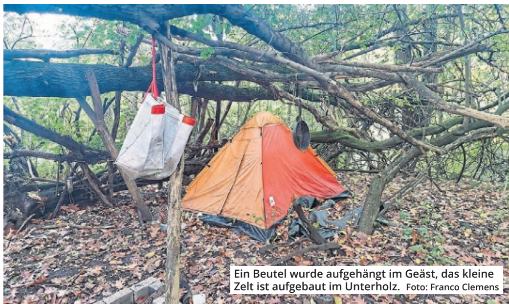
Ein Beutel wurde aufgehängt im Geäst, das kleine Zelt ist aufgebaut im Unterholz.

Franco Clemens kennt die Schattenseiten Kölns wie kaum ein anderer. Als Streetworker mit jahrzehntelanger Arbeit in sozialen Brennpunkten hat er sich jetzt mit einer dringenden Forderung an die Politik und die Stadt Köln gewandt. Franco hat dokumentiert, was viele lieber nicht sehen wollen: Im letzten Winter circa 45 Zelte, verteilt über die ganze Stadt, bewohnt von Menschen, die buchstäblich im Freien überleben und obdachlos sind. Das sind bei weitem nicht alle Lager – es gibt noch viel mehr.