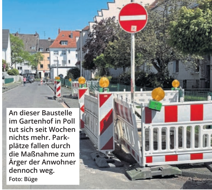
An dieser Baustelle im Gartenhof in Poll tut sich seit Wochen nichts mehr. Parkplätze fallen durch die Maßnahme zum Ärger der Anwohner dennoch weg.

Entsprechend wichtig sei es, dass die Digitalisierung stärker und flächendeckend in den Verwaltungsprozessen ankommt. Sollte dies zukünftig der Fall sein, dürfen Verkehrsteilnehmer tatsächlich darauf hoffen, dass es schon bald weniger oft zu unnötigen Staus durch Baustellen kommt. Doch bis dahin heißt es auf vielen Kölner Straßen leider weiterhin: Geduld mitbringen!