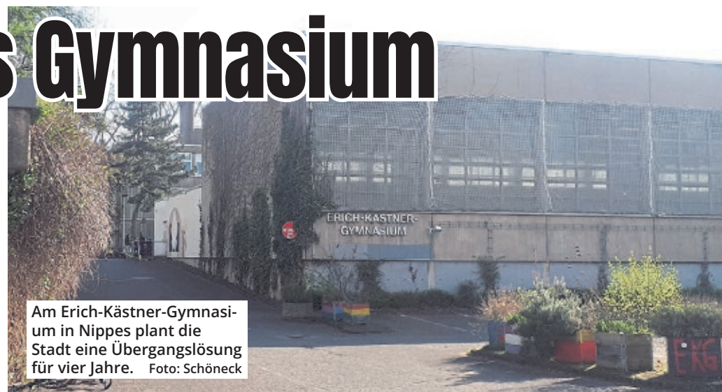
Am Erich-Kästner-Gymnasium in Nippes plant die Stadt eine Übergangslösung für vier Jahre.

Die Kosten für Miete, Aufbau und Rückbau des Modulbaus werden auf rund 2,8 Millionen Euro geschätzt, die Kosten für die Einrichtung auf 310.000 Euro. Parallel plant die Stadt, bestehende naturwissenschaftliche Räume im Schulgebäude für etwa 90.000 Euro zu sanieren. Bereits im Schuljahr 2026/2027 wird es ein Interim für das Interim geben: Zusätzliche Klassen sollen vorübergehend an einen Ausweichstandort an der Stammheimer Straße ausgelagert werden. Dieser Standort kann allerdings nur ein Jahr lang genutzt werden.