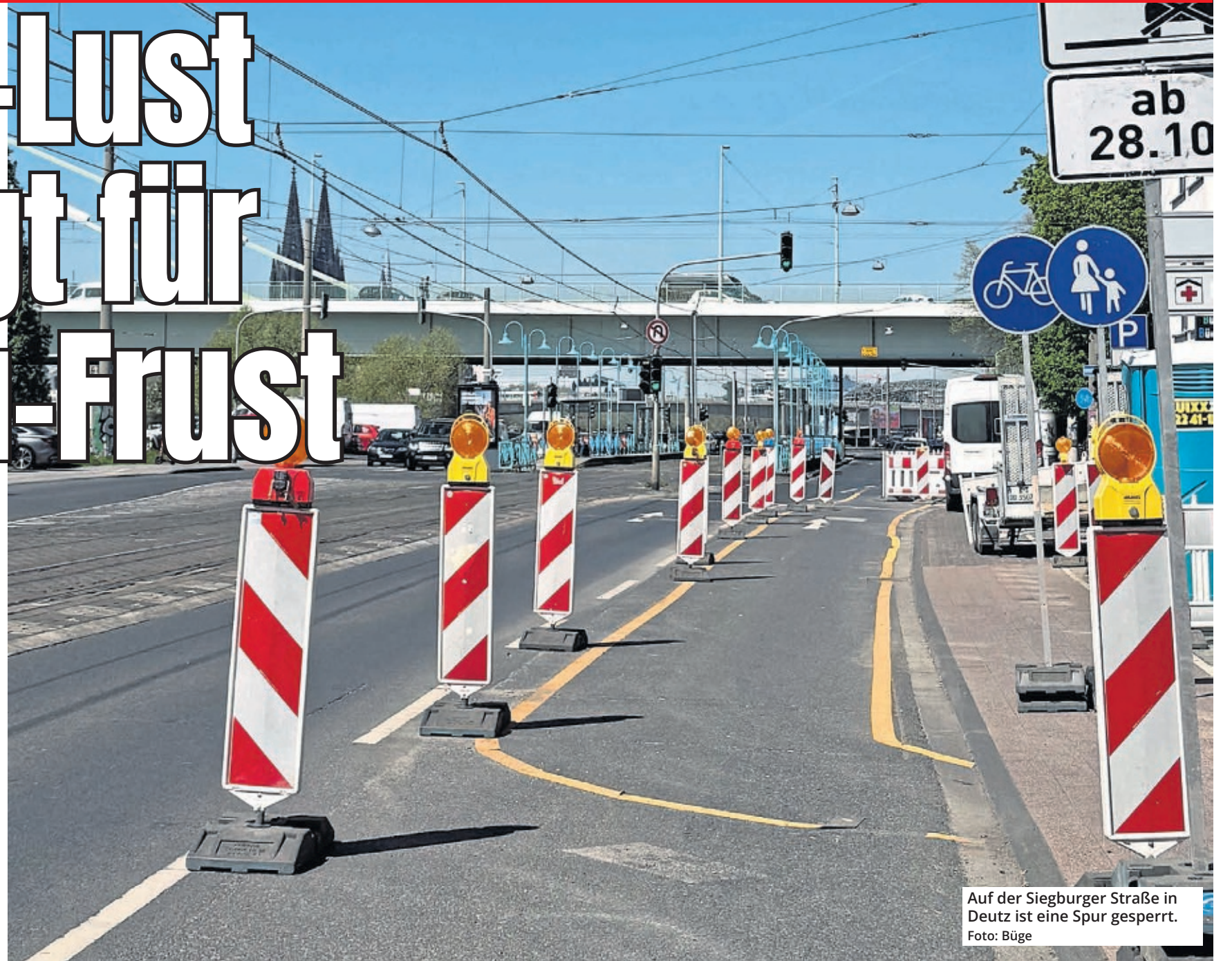
Auf der Siegburger Straße in Deutz ist eine Spur gesperrt.

Das nervt! Kaum sind die frostigen Temperaturen vorbei, wimmelt es in der ganzen Stadt nur so vor Baustellen. Bei Autofahrern, Fahrradfahrern und Fußgängern kommt deshalb gerade jetzt jede Menge Frust auf. Denn: Bei vielen Baustellen tut sich nach der ersten Absperrung erst mal wochenlang gar nichts. Doch warum ist das eigentlich oft so? Und kann das Ganze nicht besser organisiert werden?