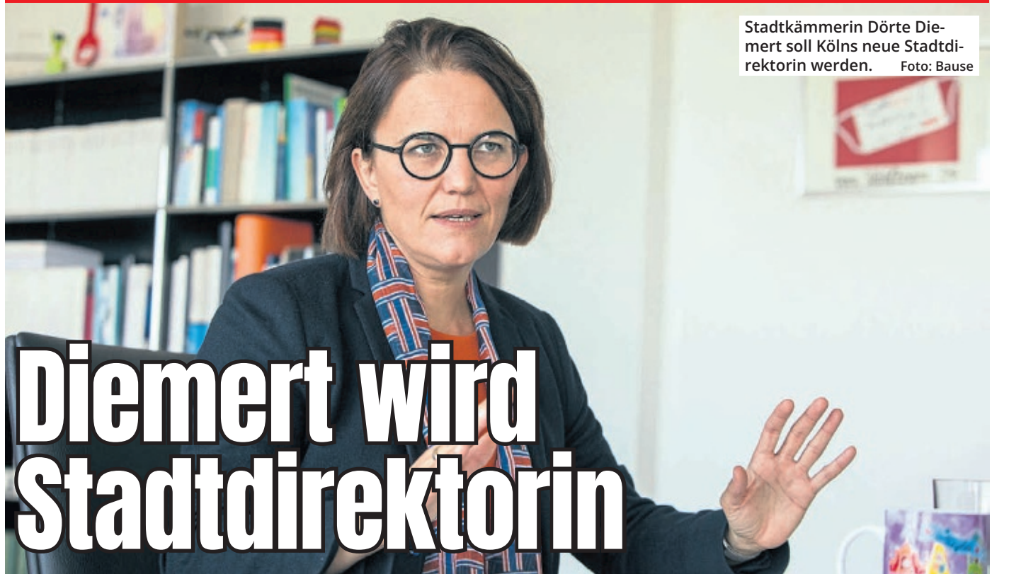
Stadtkämmerin Dörte Diemert soll Kölns neue Stadtdirektorin werden.