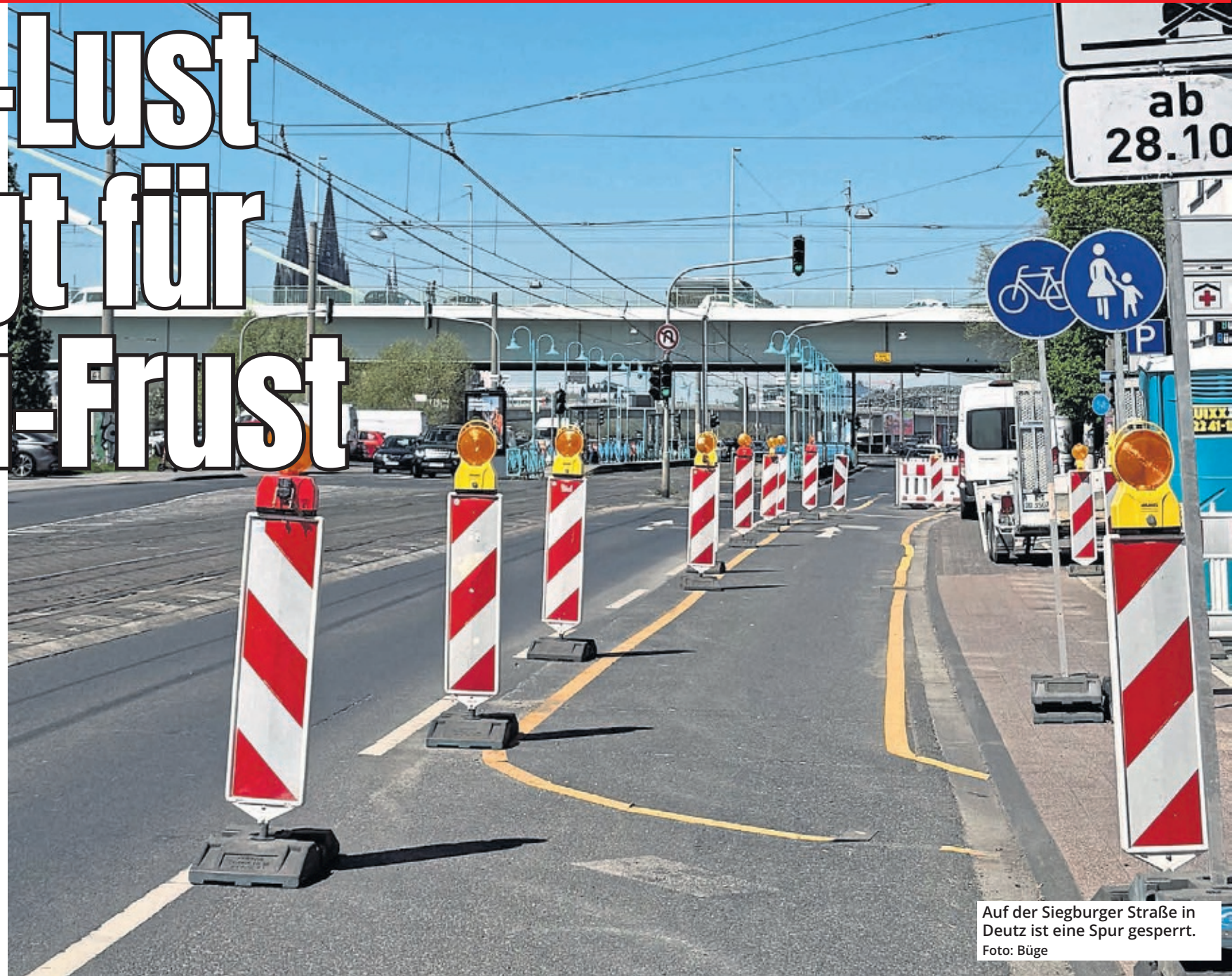
Auf der Siegburger Straße in Deutz ist eine Spur gesperrt.

Das nervt! Kaum sind die frostigen Temperaturen vorbei, wimmelt es in der ganzen Stadt nur so vor Baustellen. Bei Autofahrern, Fahrradfahrern und Fußgängern kommt deshalb gerade jetzt jede Menge Frust auf. Denn: Bei vielen Baustellen tut sich nach der ersten Absperrung erst mal wochenlang gar nichts. Doch warum ist das eigentlich oft so? Und kann das Ganze nicht besser organisiert werden?