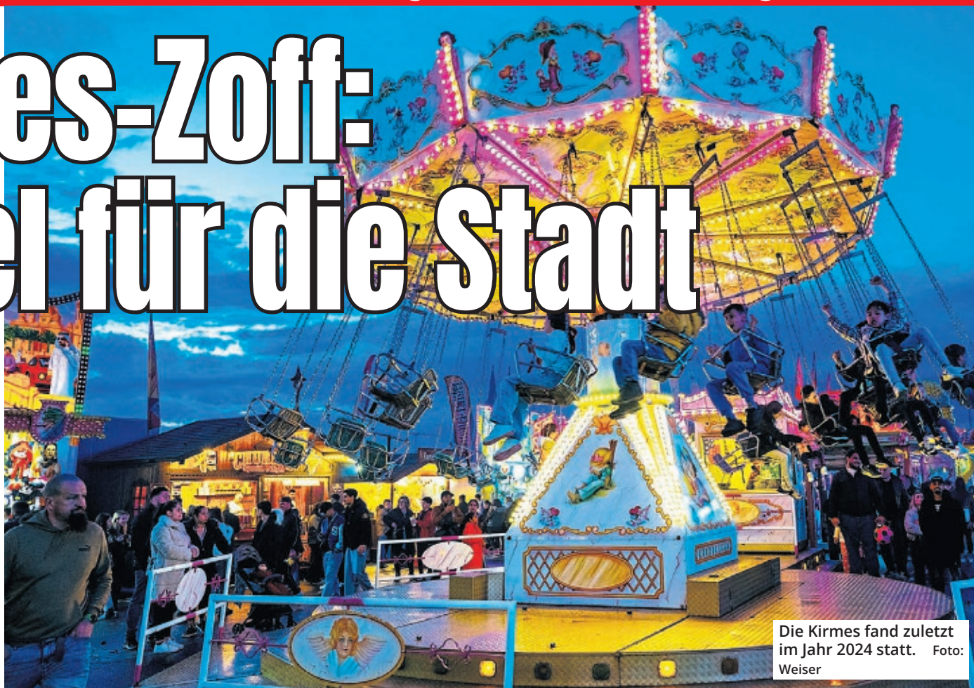
Die Kirmes fand zuletzt im Jahr 2024 statt.

Erstens legte die Stadt die Mitglieder der Findungskommission auch dem OLG gegenüber nicht offen. Maimann hielt den Vertretern der Stadt im Gerichtssaal ein Papier mit einer Mitgliedsliste entgegen, auf dem die Namen alle geschwärzt waren, und sagte: „An den Senat ist gar nichts zu schwärzen.“ Ihr sei kein Grund eingefallen, wie-