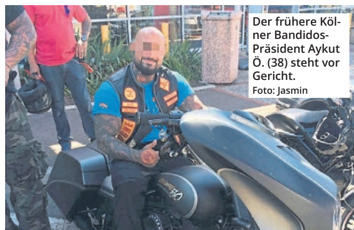
Der frühere Kölner Bandidos-Präsident Aykut Ö. (38) steht vor Gericht.

Wie schnell vermeintliche Zeugen auch umfallen können, zeigt die aktuelle Anklage. Ein Bandidos-Mitglied soll seinen früheren Boss zu nächst schwer belastet, die Vorwürfe dann aber fallen gelassen haben – Aykut Ö. habe mit den Schießereien nichts