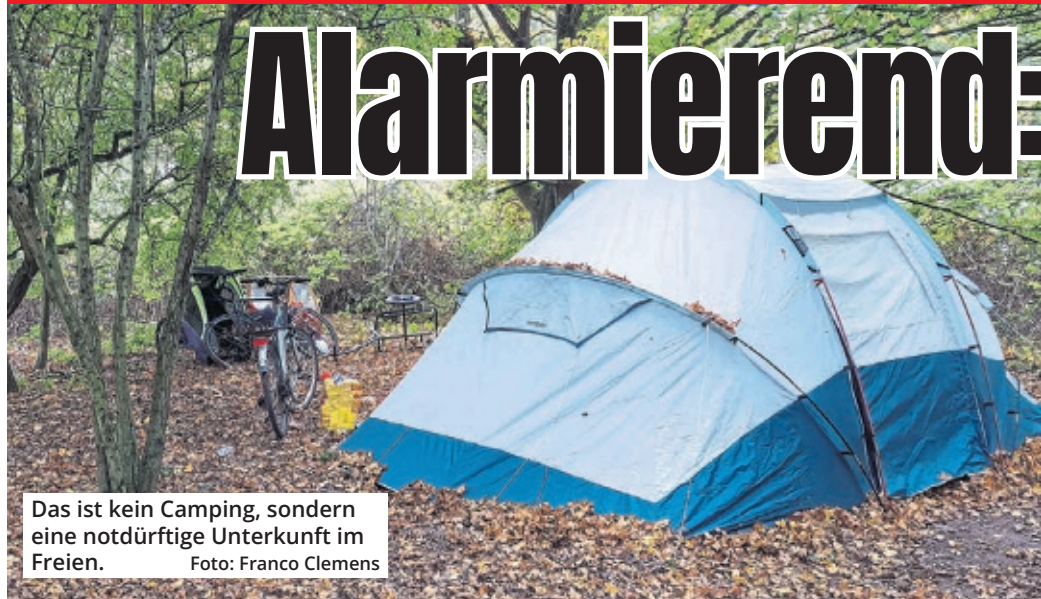
Das ist kein Camping, sondern eine notdürftige Unterkunft im Freien.