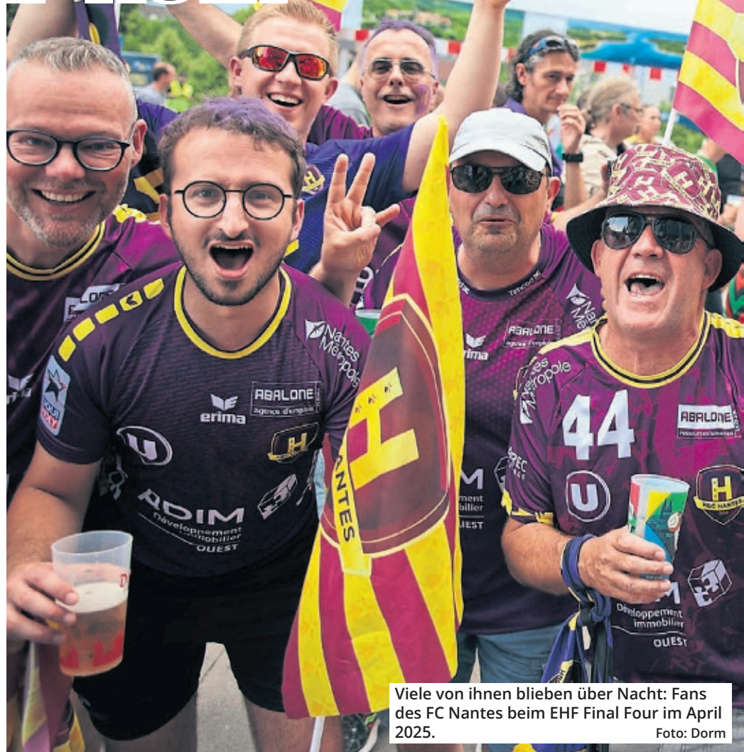
Viele von ihnen blieben über Nacht: Fans des FC Nantes beim EHF Final Four im April 2025.

Neben dem Geld, das die Touristen in Köln lassen, blickt die Studie auch auf die Image-Wirkung der Arena. Die große Mehrheit der Besucher gibt an, Köln erneut besuchen und den Besuch der Stadt weiterempfehlen zu wollen. „Das Event ist der Einstieg in die Destination, animiert aber dazu, in der Gastronomie zu