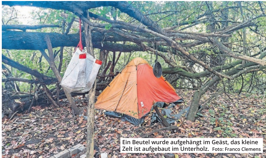
Ein Beutel wurde aufgehängt im Geäst, das kleine Zelt ist aufgebaut im Unterholz.