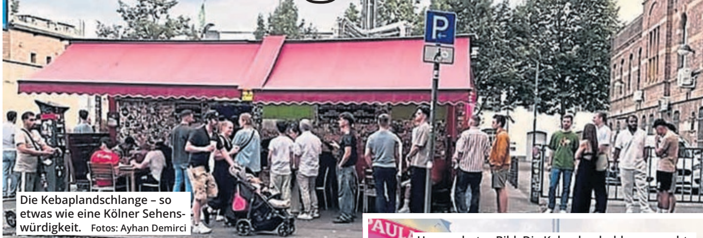
Die Kebaplandschlange – so etwas wie eine Kölner Sehenswürdigkeit.

Eine Kundenschlange fast bis zur nächsten Straßenecke: Das war das gewohnte tägliche Bild am Kebapland in Ehrenfeld. Doch es gehört jetzt der Vergangenheit an.