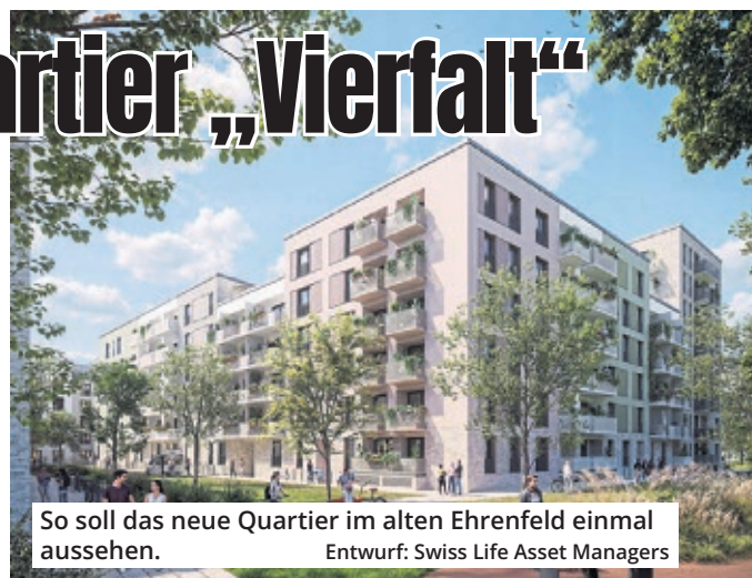
So soll das neue Quartier im alten Ehrenfeld einmal aussehen. Entwurf: Swiss Life Asset Managers

Die vier separaten Tiefgaragen des neuen Quartiers werden ausschließlich über Franz-Geuer- und Stammstraße angefahren. Der Schwerpunkt liegt aber auf dem Radverkehr: Insgesamt sind für die „Vierfalt“-Bewohner mehr als 811 Fahrradstellplätze vorgesehen, mehr als 170 davon oberirdisch an den Hauseingängen. Zehn Prozent dieser Stellplätze sind für Lastenr-