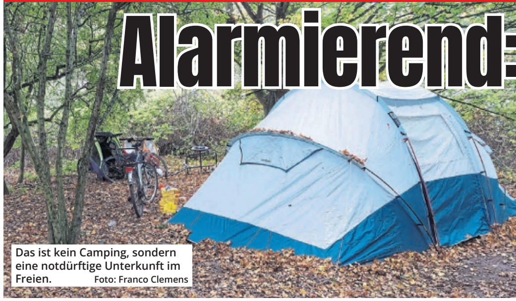
Das ist kein Camping, sondern eine notdürftige Unterkunft im Freien.