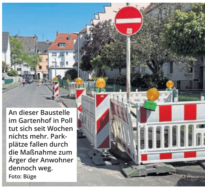
An dieser Baustelle im Gartenhof in Poll tut sich seit Wochen nichts mehr. Parkplätze fallen durch die Maßnahme zum Ärger der Anwohner dennoch weg.

Entsprechend wichtig sei es, dass die Digitalisierung stärker und flächendeckend in den Verwaltungsprozessen ankommt. Sollte dies zukünftig der Fall sein, dürfen Verkehrsteilnehmer tatsächlich darauf hoffen, dass es schon bald weniger oft zu unnötigen Staus durch Baustellen kommt. Doch bis dahin heißt es auf vielen Kölner Straßen leider weiterhin: Geduld mitbringen!