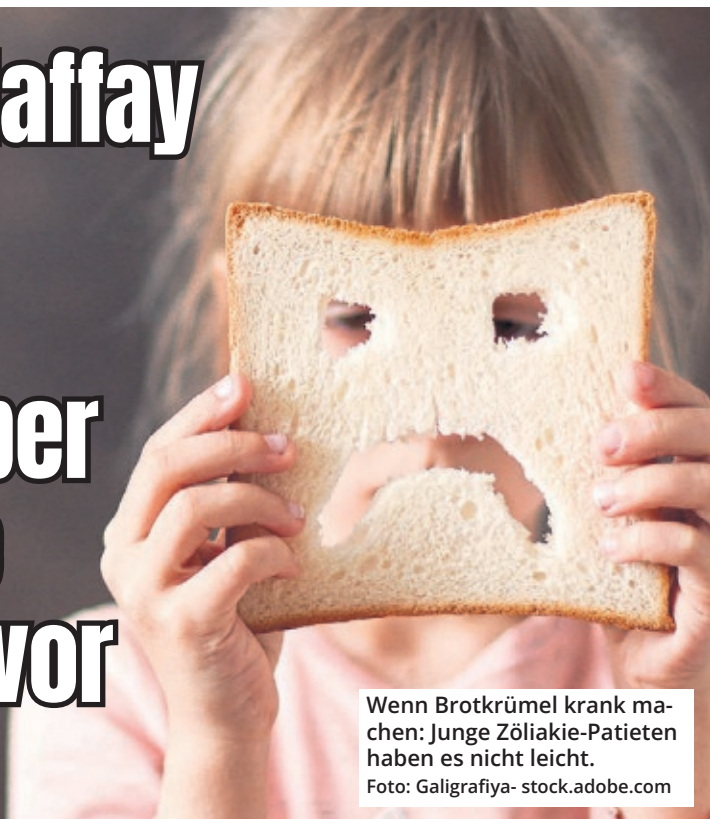
Wenn Brotkrümel krank machen: Junge Zöliakie-Patienten haben es nicht leicht.