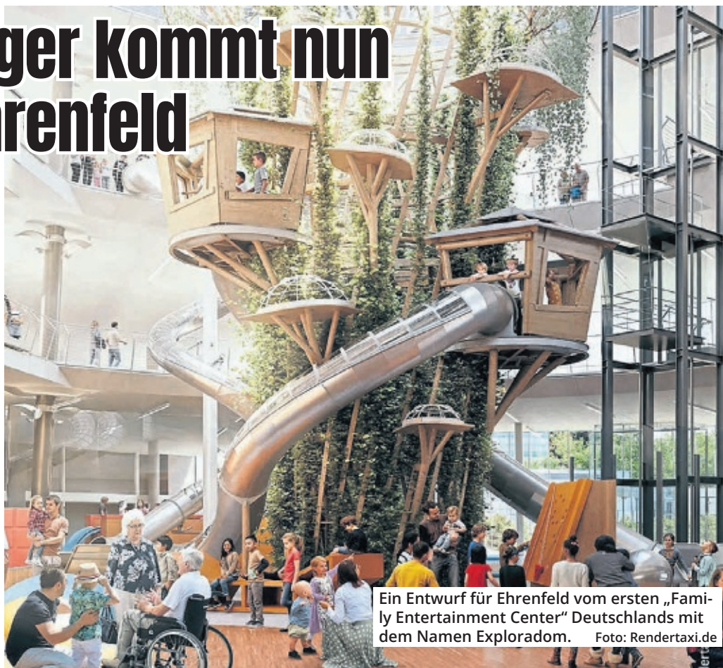
Ein Entwurf für Ehrenfeld vom ersten „Family Entertainment Center“ Deutschlands mit dem Namen Exploradom.

An der grundsätzlichen Idee hält der Betreiber nach eigenen Angaben fest. Man wolle die Philosophie des Odysseums weiterführen. Deshalb werde nun nach alternativen Möglichkeiten gesucht, das Konzept doch noch umzusetzen. Konkrete Angaben dazu gibt es bislang nicht. Bereits verkaufte Geschenkgutscheine für das Exploradom werden nach An-