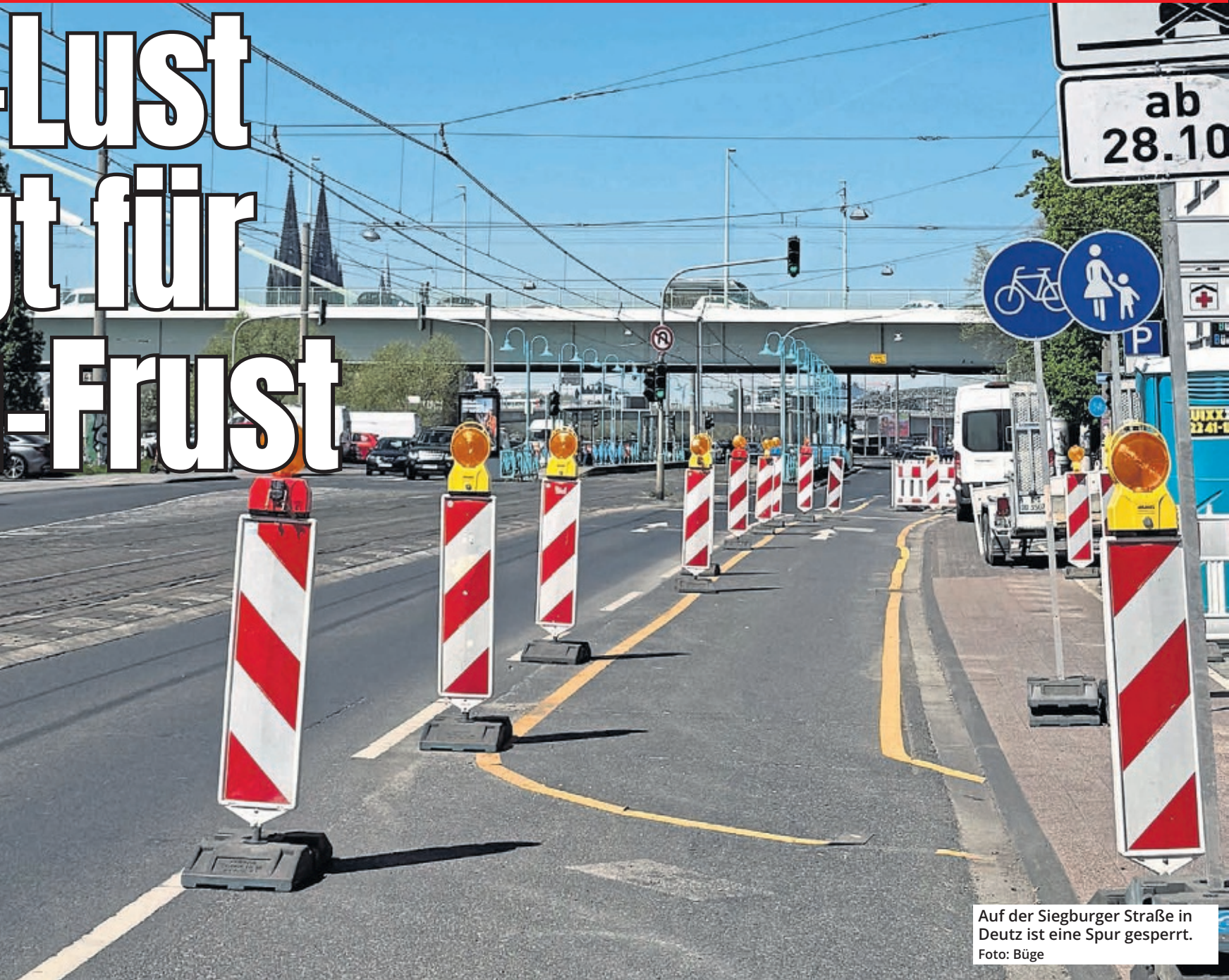
Auf der Siegburger Straße in Deutz ist eine Spur gesperrt.

Das nervt! Kaum sind die frostigen Temperaturen vorbei, wimmelt es in der ganzen Stadt nur so vor Baustellen. Bei Autofahrern, Fahrradfahrern und Fußgängern kommt deshalb gerade jetzt jede Menge Frust auf. Denn: Bei vielen Baustellen tut sich nach der ersten Absperrung erst mal wochenlang gar nichts. Doch warum ist das eigentlich oft so? Und kann das Ganze nicht besser organisiert werden?