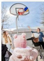
Überblick Programmlinie Gesellschaft gestalten