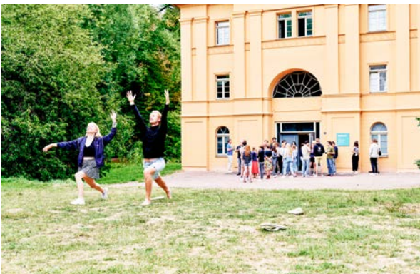
Studierende während der Kulturakademie Weimar 2022

Nach dem raschen Aufwuchs ihrer Aufnahmezahlen in den 2000er-Jahren, konnte die Studienstiftung Anfang der 2010er-Jahre für nur 20% ihrer rund 12.600 Geförderten einen Veranstaltungsplatz pro Jahr anbieten. Ab 2011 folgte deshalb der Ausbau der ideellen Förderung: Thematische Akademien, Exkursions-, Praxis- und Nachwuchsakademien ergänzen seitdem die traditionellen, themenoffenen Sommerakademien. Die Wissenschaftlichen Kollegs wurden 2014 um das Kolleg Europa und 2021 um das China-Kolleg erweitert, und Angebote der Berufsorientierung und in den Künsten sowie die Sprachkurse inhaltlich wie quantitativ ausgebaut. Neu hinzu kamen unter anderem die Linie „Stipendiat:innen machen Programm“, Angebote im Bereich „Gesellschaft gestalten“, Kompetenzseminare. Bis 2019 wuchs die Zahl der Veranstaltungsteilnahmen in Präsenz auf rund 9.900; 2022 wurden insgesamt 16.207 Teilnahmeplätze angeboten, davon 47% in Präsenz.