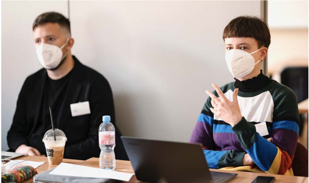
Während der Sommerakademie Vilnius 2022 arbeiteten rund 50 Geförderte der Studienstiftung sowie 11 Studierende der Vilniaus Universitetas und der European Humanities University zusammen.