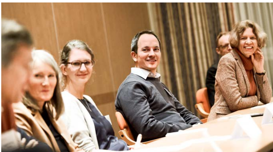
Etwa 900 Professorinnen und Professoren unterschiedlicher Fachrichtungen begleiten als Vertrauensdozentinnen und Vertrauensdozenten der Studienstiftung ehrenamtlich an ihrer Hochschule Studierende unter anderem bei Fragen zur individuellen Studien- und Berufsplanung.