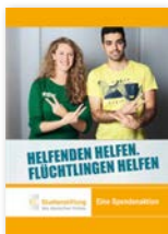
Helfenden helfen, Flüchtlingen helfen (2016)