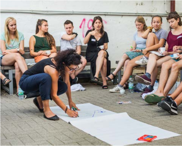
Sommerakademie der Begabtenförderungswerke 2019