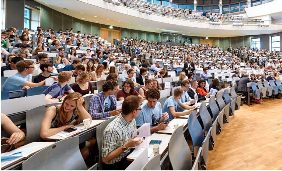
Zehnjähriges Jubiläum des Max Weber-Programms 2015.