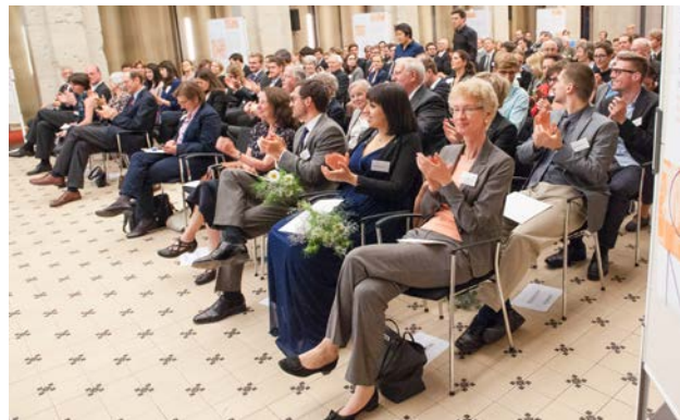
Preisverleihung 2014 in Berlin

Mit ihren Engagementpreisen unterstützt die Studienstiftung seit 2014 Stipendiatinnen und Stipendiaten in ihren gesellschaftlichen Anliegen finanziell wie ideell – durch Preisgelder, Öffentlichkeitsarbeit, Coachings sowie Aufrufe für Spenden und zur Werbung von weiteren Freiwilligen. Neben den Hauptpreisen werden bis zu fünf Würdigungen für Finalistinnen und Finalisten sowie, seit 2015, bis zu fünf Starterpreise für Projekte in der Anfangsphase verliehen. Ebenfalls 2014 wurden zwei Promotionspreise der Studienstiftung eingeführt: der Friedrich Hirzebruch-Preis für die Bereiche Mathematik, Natur- und Ingenieurwissenschaften und der Johannes Zilkens-Preis für die Bereiche Geistes- und Gesellschaftswissenschaften. Die Preise machen exzellente wissenschaftliche Arbeiten unterschiedlicher Fachrichtungen sichtbar und unterstreichen die besondere Qualität der Promotionsförderung durch die Studienstiftung. Seit 2022 vergibt die Studienstiftung jährlich drei Promotionspreise: den Lieselotte Pongratz-Preis für Arbeiten aus den Gesellschaftswissenschaften, den Johannes Zilkens-Preis, der seitdem Arbeiten aus den Geisteswissenschaften vorbehalten ist, sowie weiterhin den Friedrich Hirzebruch-Preis.