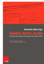
Meinhof, Mahler, Ensslin. Die Akten der Studienstiftung des deutschen Volkes (2016) Vorwort der Aktenedition