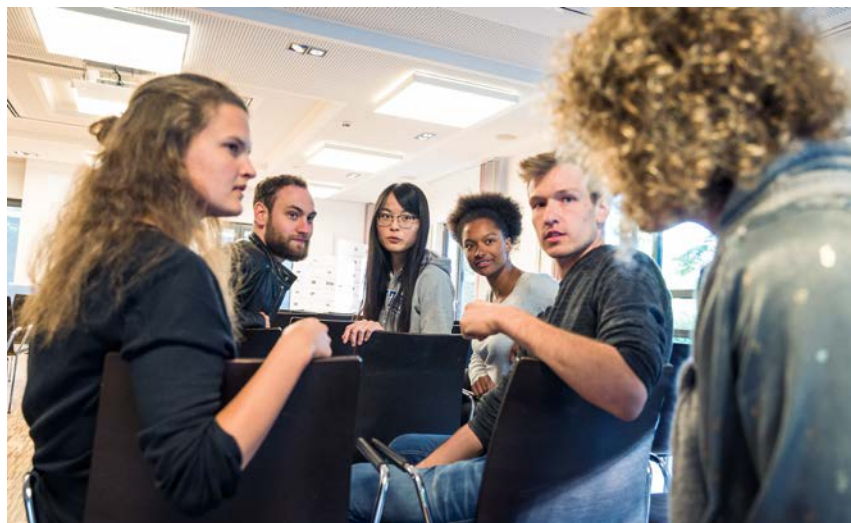
Studierende während des Workshops Kompetent im Ehrenamt 2019.

Seit 2014 fasst die Studienstiftung Aktivitäten und Angebote, mit denen sie gesellschaftliches Engagement ihrer Geförderten unterstützt und sichtbar macht, in einer eigenen Programmlinie „Gesellschaft gestalten“ zusammen. Unter diese Linie fallen sowohl bereits vor 2014 ins Leben gerufene Initiativen wie das Botschafter:innen-Programm, die 2014 erstmals verliehenen Engagementpreise der Studienstiftung, aber auch in den Folgejahren entwickelte Angebote und Aktivitäten, mit denen die Unterstützung in diesem Bereich gezielt ausgebaut wurde – von Schulungen und Webinaren für Ehrenamtliche über Veranstaltungen zu gesellschaftlich relevanten Themen bis hin zu Engagementstipendien.