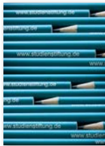
Leitbild der Studienstiftung (2013)