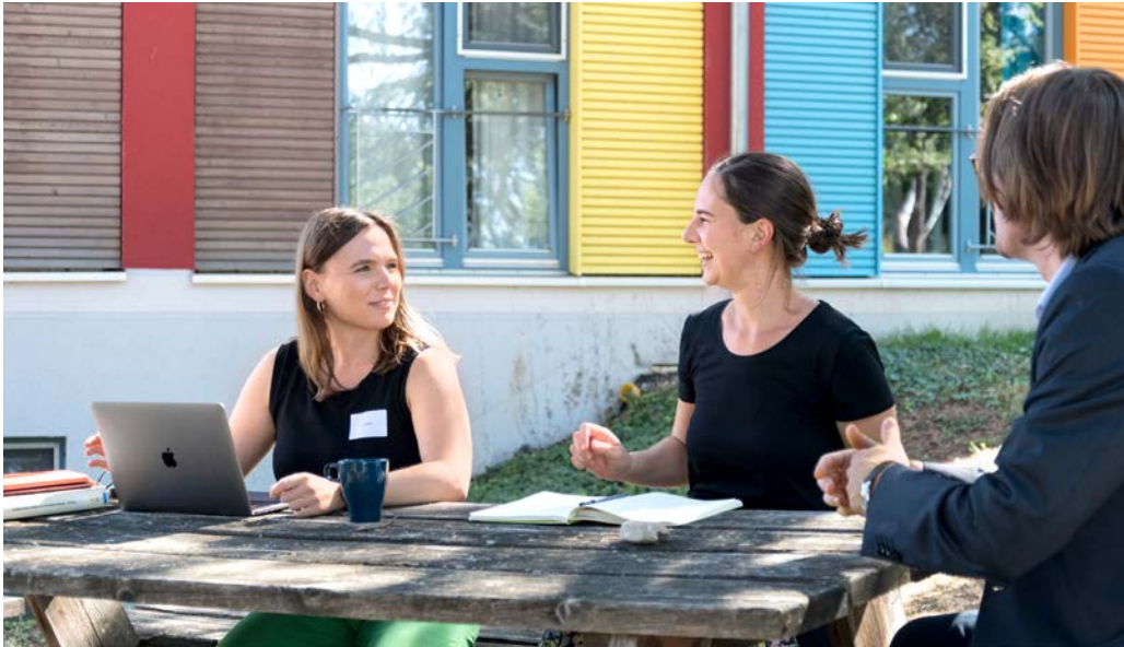
Promovierende während eines Schreibretreats 2022