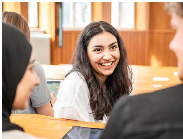
Stipendiatische Botschafterinnen und Botschafter bestärken Studierende auf ihrem Weg zum Stipendium.