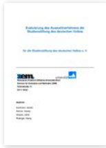
Evaluierung des Auswahlverfahrens der Studienstiftung des deutschen Volkes (2012)