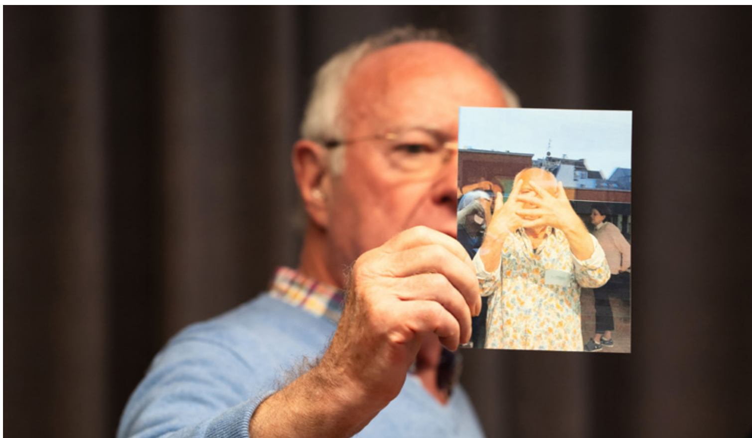
Workshopergebnis: Wie trotz man Altersstereotypen?