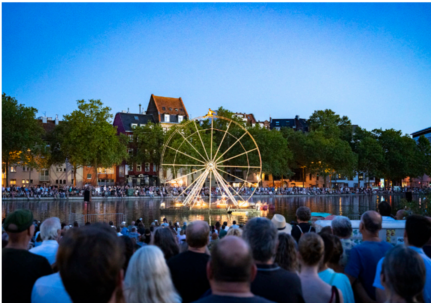
Auftakt des Programms im MediaPark: Die französische Kompanie Cie. Louxor mit ihrer atemberaubenden Artistikshow VOGUE.