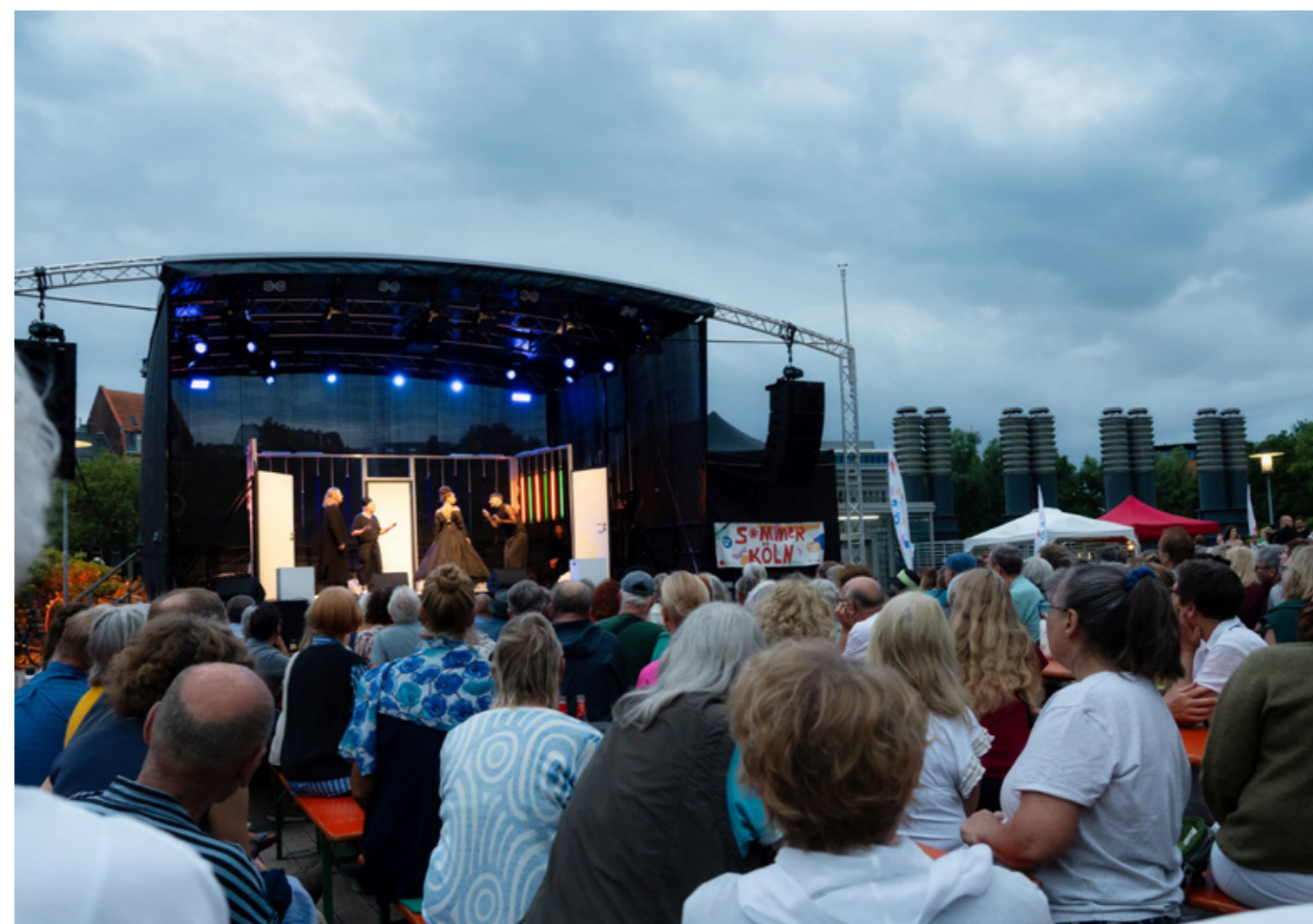
Das COMEDIA-Theater führte ihr mit dem Kölner Jugendtheaterpreis gekröntes Stück „Was ihr wollt“ auf.

Zum Festivalabschluss am 18. August lud die Photographische Sammlung der SK Stiftung Kultur zum Workshop Sonne und Wasser: Blau! , bei dem sich Teilnehmende mit der historischen Technik der Cyanotypie beschäftigten. Bei dieser frühen photographischen Methode entstanden Bilder ganz ohne Kamera: Gegenstände wurden auf lichtempfindliches Papier gelegt und durch Sonneneinstrahlung