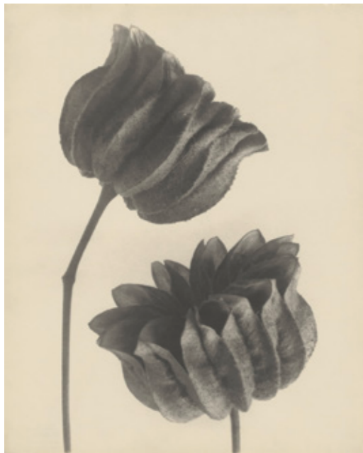
Karl Blossfeldt: Schönmalve (Abutilon), Samenkapseln, 6-fach, o.J.

Die Ausstellung zum Werk Blossfeldts basierte auf den Beständen der Universität der Künste Berlin, der Institution, an deren Vorgängerschule der Künstler ausgebildet wurde, und wo er von 1899 bis 1930 das Fach „Modellieren nach lebenden Pflanzen“ lehrte. Mit dem Archiv der UdK hat sich 1999 ein wichtiger Kooperationspartner gefunden. Gemeinsam haben sich die Institutionen das Ziel gesetzt, den Berliner Blossfeldt-Bestand mit über 630 originalen Photographien, 39 Herbarien und 57 Meurer-Bronzen kontinuierlich aufzuarbeiten und der Öffentlichkeit vorzustellen. Dieses Vorhaben ist mit dem Projekt, inkl. der dazu im Schirmer/Mosel Verlag erschienenen, alle Photographien und weiteren Werkteile umfassenden Publikation in besonderem Maße eingelöst worden.