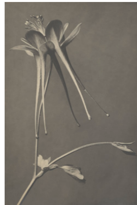
Karl Blossfeldt: Akelei (Aquilegia chrysantha), Blüte, o.J.

26. September: „Von Blumen, Wiesen und Wäldern – Landschaft, Natur und Botanik in der Photographie“ – Aus der Reihe Meet the Collection – Präsentation aus dem Bestand der Photographischen Sammlung/SK Stiftung Kultur