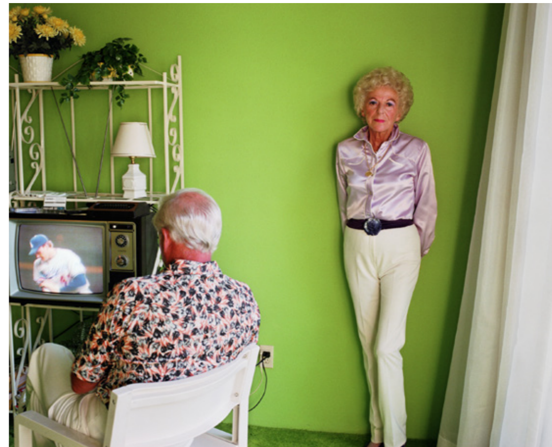
Larry Sultan: My Mother posing for me, 1984, aus der Serie Pictures from Home, 1982–1991

Die Präsentation erwies deutlich, dass das Medium der Photographie besonders geeignet ist, sich mit dem zeitbedingten Thema auseinanderzusetzen. Denn gerade photographische Ansichten vermögen dem Alterungsprozess wie auch dem Alter ein Gesicht zu geben. Dabei warfen die Bilder Fragen auf, die zur Auseinandersetzung anregen: Wie spiegelt sich Lebenserfahrung im Aussehen, in der Physiognomie, in der Haltung älterer Menschen? Welche Persönlichkeit, welche Eigenschaften strahlen die Abgebildeten aus? Welche gesellschaftlichen Rollen vermitteln sich? Verändern sich die Gesten vor dem Hintergrund verschiedener Entstehungszeiten und Aufnahmeorte? Und schließlich die existenziellste aller Fragen: Wie stehe ich zum Tod? Auch queere Positionen wurden in den Diskurs mit aufgenommen, besonders auch durch das Titelmotiv der Ausstellung einer älteren trans*-Frau.