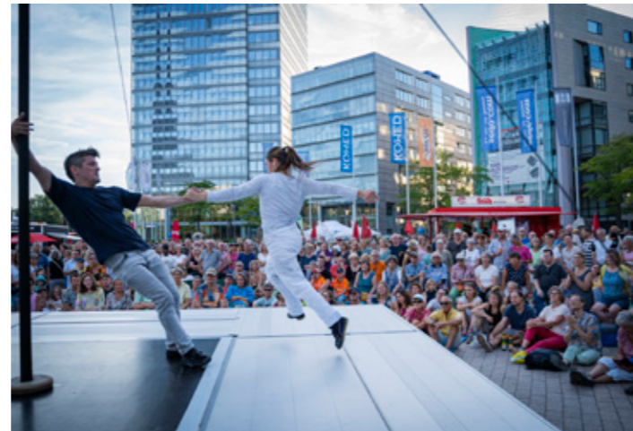
À deux mètres.

Vogue – Cie. Louxor – Artistik: Die französische Company Louxor entführte das Publikum in eine Welt aus Zirkus, Theater und pyrotechnischer Eleganz.