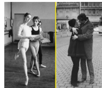
„Goldene Jahre – Kölner Tanzträume. Aufbruch in die 1960er Jahre.“

18. Februar: BUNTER BÜHNENZAUBER – Workshop für Kinder ab 8 Jahren mit der Archiv- und Museumspädagogin Madita Zinsen