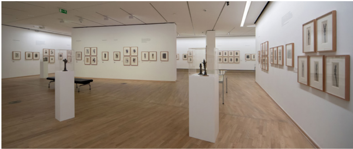
Blick in die Ausstellung: „Karl Blossfeldt - Photographie im Licht der Kunst“

Die Betrachtung von Naturphänomenen ist jene Schnittstelle, an der die Herbstausstellung der Photographischen Sammlung/SK Stiftung unter dem Titel „Karl Blossfeldt – Photographie im Licht der Kunst“ anknüpfen konnte. Mit 271 Originalabzügen wurde das Œuvre von Karl Blossfeldt (1865–1932) nach über zwei Jahrzehnten in diesem Umfang präsentiert. Eindrucksvoll, erstmals nach Pflanzenfamilien geordnet, hatten die Besucher*innen Gelegenheit, die subtil abgelichteten Pflanzenansichten, begleitet von Originalmaterialien, wie Schriftstücken und Publikationen zu entdecken; ein Werk, das durch seine pure Methodik als prototypisch für die künstlerische Strömung der Neuen Sachlichkeit Teil der Kunstgeschichte ist. Das vielseitige Begleitprogramm mit beispielsweise philosophischen Führungen und Führungen in der Kölner Flora traf auf regen Zuspruch.