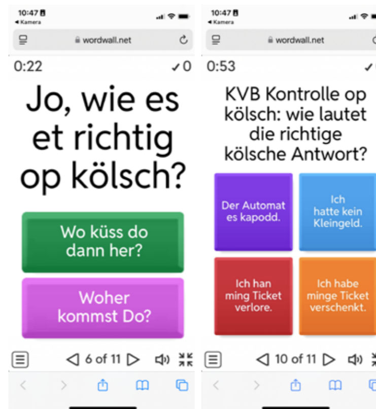
Screenshot aus Quiz erstellt auf wordwall.net

Auch die Möglichkeit, dass unsere Tickets überwiegend online verkauft werden, hat sich etabliert und wird immer besser genutzt.