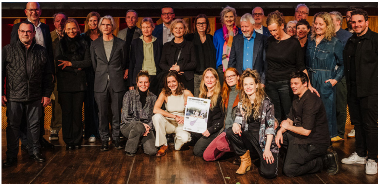
Alle Preisträger*innen, Jurymitglieder sowie Vertreter*innen der Fördernden gemeinsam auf der Bühne.

Am 2. Dezember 2024 war es wieder so weit: Die Kölner Tanz- und Theaterpreise wurden feierlich verliehen und sorgten für einen glanzvollen Abend mit emotionalen Momenten. Bereits vor Beginn der Veranstaltung herrschte im Foyer der SK Stiftung Kultur eine erwartungsvolle Atmosphäre, in der sich Künstler*innen, Kulturfördernde und Gäste versammelten. Anlässlich des 35. Jubiläums bekam das Projekt ein neues Erscheinungsbild und eine neue Sponsorenwand – ein beliebter Ort für Erinnerungsfotos.