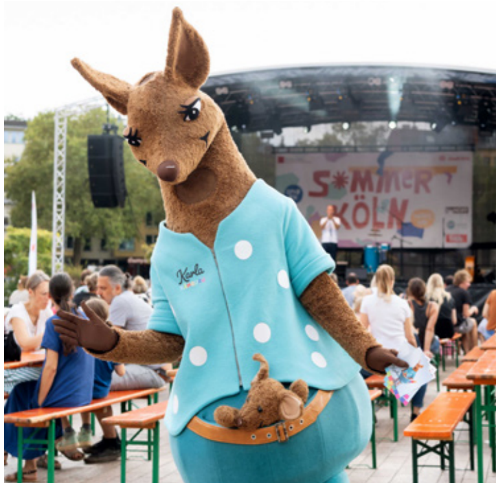
Karla, das Maskottchen vom Magazin „Känguru“ begrüßte beim Familiennachmittag die Kleinsten.

Der Sommer Köln 2024 hat eindrucksvoll gezeigt, wie Kultur den öffentlichen Raum beleben und Menschen jeden Alters zusammenbringen kann. Der Mediapark wie auch die anderen öffentlichen Plätze bewiesen sich erneut als kreative und inspirierende Veranstaltungsorte, an dem Akrobatik, Literatur, Musik, Film und Tanz miteinander verschmolzen. Die SK Stiftung Kultur freut sich über den großen Zuspruch und die positive Resonanz und blickt bereits gespannt auf die nächste Ausgabe des Festivals.