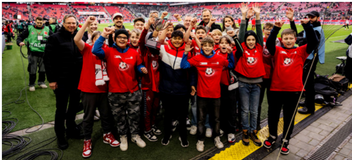
kicken & lesen Pokalübergabe im RheinEnergieSTADION