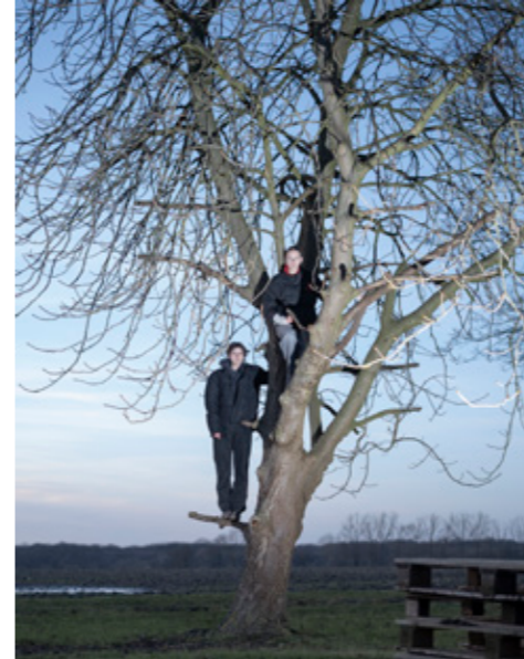
Johanna Langenhoff: Like the boys, aus der Serie „Ich oder so“

„Langer Donnerstag“: jeweils am ersten Donnerstag des Monats geöffnet von 14 bis 21 Uhr, mit Kurzführungen und bei freiem Eintritt