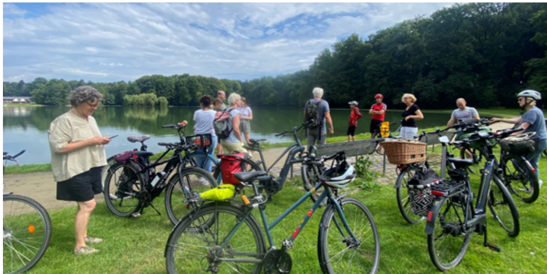
Decksteiner Weiher bei der Adenauer-Führung