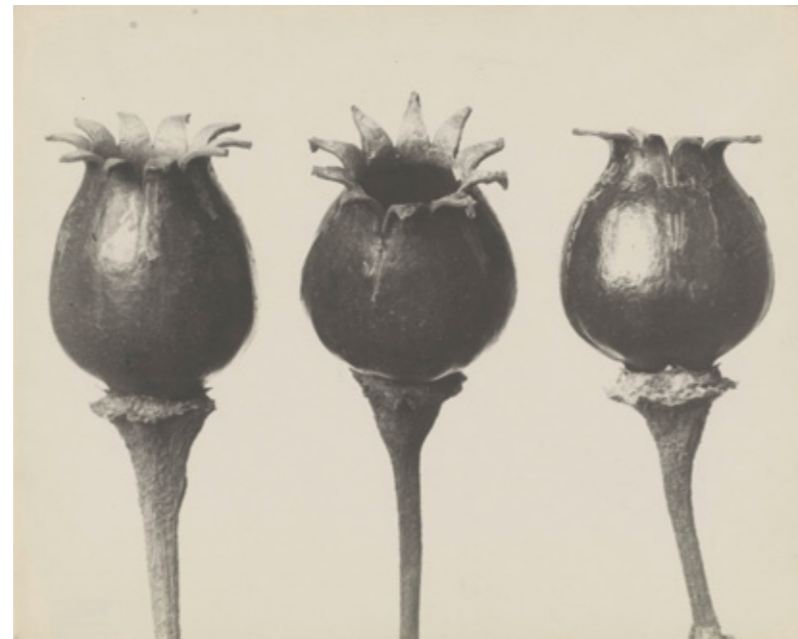
Karl Blossfeldt: Lichtnelke, vor 1932.