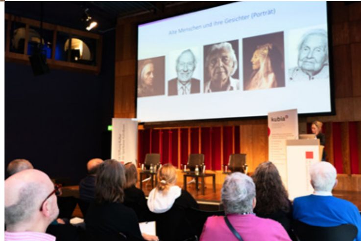
Thementag zu Altersbildern

Immer am zweiten Montag im Monat: Short Monday - Der Kurzfilm-Montag im Filmhaus Köln Kooperationspartner: KFFK/Kurzfilmfestival Köln , Filmhaus Kino , SK Stiftung Kultur - im Wechsel zwischen den drei Kooperationspartnern kuratiert.