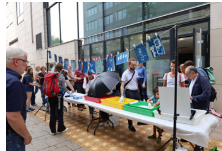
Cyanotypie-Workshop der Photographischen Sammlung.

Kurzfilm am See – Pläne für den Sommer?: Kurzfilme und Musikvideos zeigten überraschende, komische und absurde Sommerpläne, kuratiert vom Referat Medienkunstvermittlung der SK Stiftung Kultur.