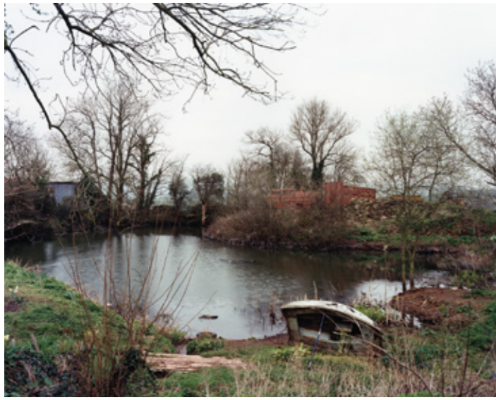
The Pond at Upton Pyne March 1998