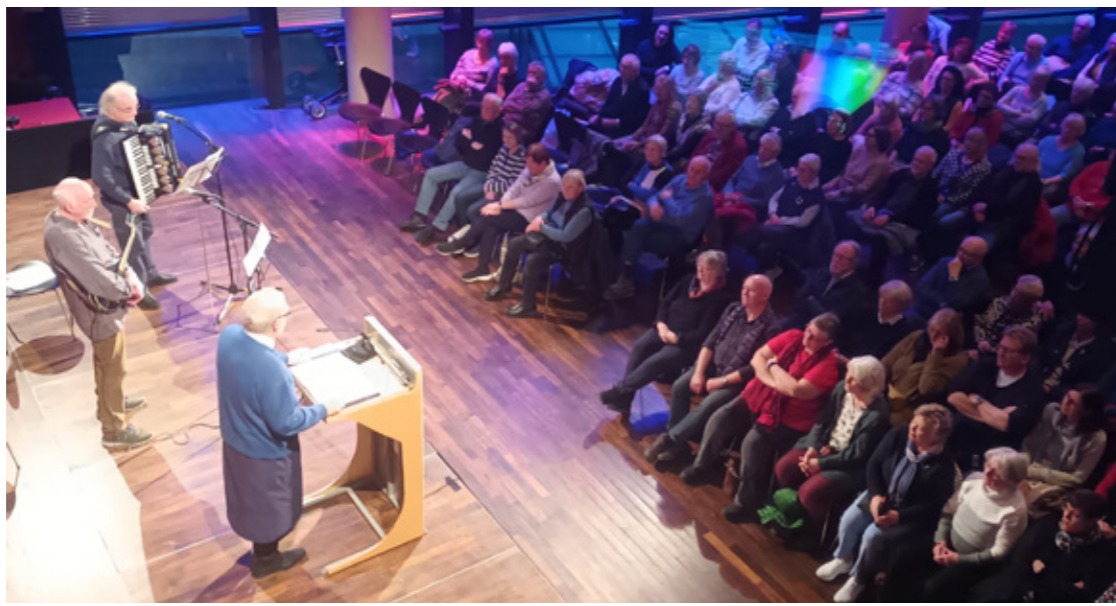
Klaaf em Mediapark