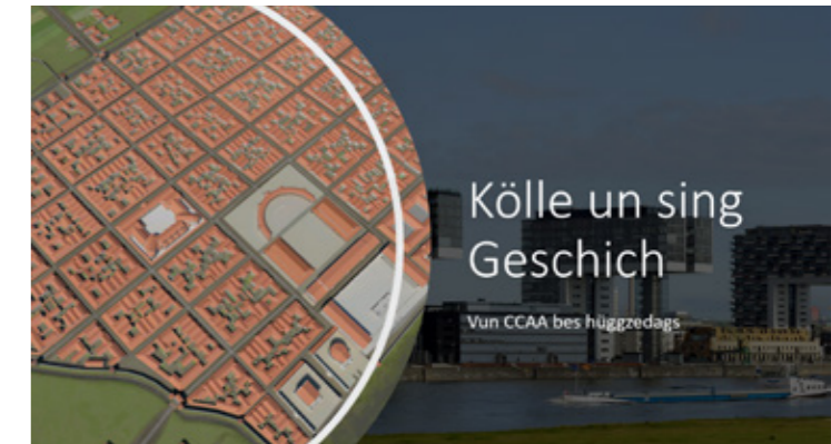
Folie aus PowerPoint: Seminar Stadtgeschichte Vogelschau - römisches Köln, Hintergrundfoto: Rhein mit Kranhäusern

Mit dem Kölner Kabarett Ensemble „Medden us dem Leve“ und ihrem Weihnachtsprogramm 2024