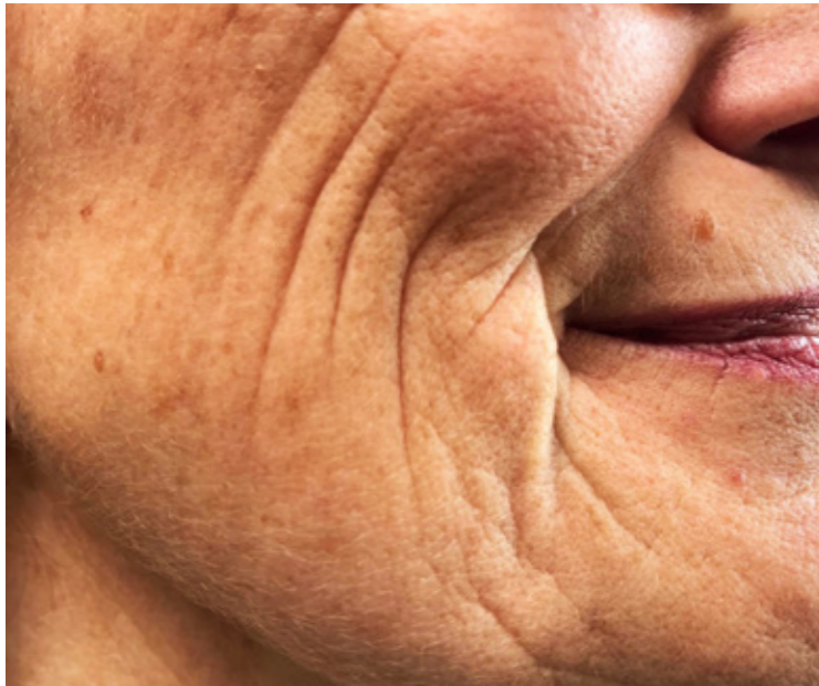
Workshopergebnis: Wie trotz man Altersstereotypen?