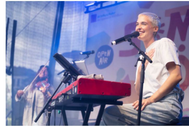
„Der singende Biergarten“ mit Cage, Foto: © Janet Sinica

Der Singende Biergarten – MitSingDing: Eine Mitsing-Veranstaltung mit Liedern der 80er und 90er, begleitet von Singer-Songwritern.