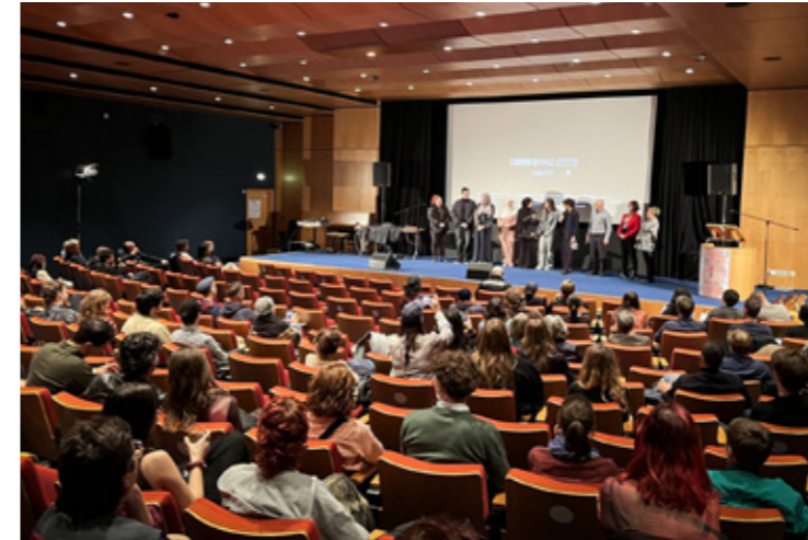
Premiere unseres intergenerativen Workshops: „Gastarbeit und Familie“

1. Film 22. November + 24. November: Kurzfilmprogramm „Themenfokus: Dialog“ im Rahmen des KFFK/Kurzfilmfestival Köln N°18 präsentiert von der SK Stiftung Kultur: Orte: Lichtspiele Kalk (22.11.) und Filmhaus Köln (24.11.) „Dass wir miteinander reden können, macht uns zu Menschen.“ (Karl Jaspers, dt. Philosoph, 1883 – 1969)