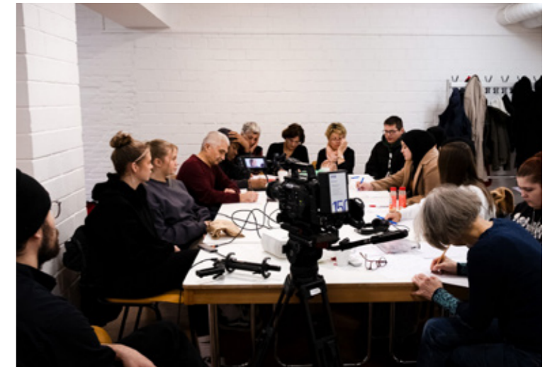
Im intergenerativen Workshops: „Gastarbeit und Familie“

Was bedeutet es für die erste und zweite Generation, die Großeltern, sogenannte Gastarbeitende zu sein, und was bedeutet es für die dritte Generation, die Enkel*innen, einen „Gastarbeiter-Hintergrund“ zu haben? Schüler*innen und Menschen ü60 mit Einwanderungsgeschichte erarbeiteten gemeinsam einen Kurzdokumentarfilm. Das Ergebnis wurde bei der Preisverleihung des KFFK am Sonntag, 24. November um 19:00 Uhr im Filmforum NRW gezeigt.