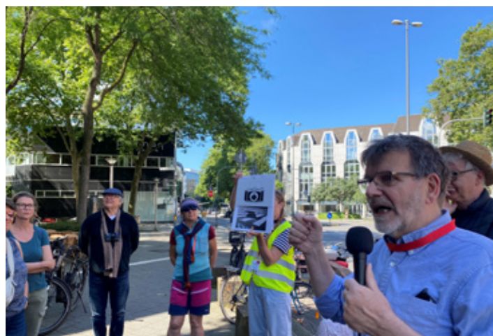
Chargesheimer-Tour