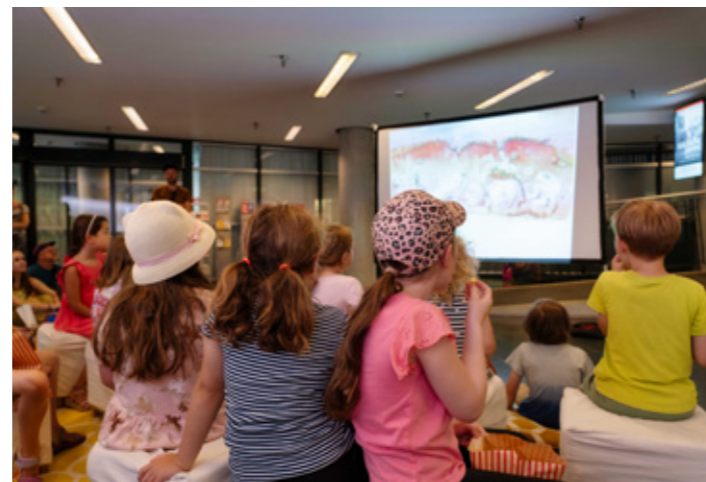
Kinderprogramm im Foyer.

Kurzfilm am See – Made in Cologne: Junge deutsche Kurzfilme aus Köln wurden präsentiert, darunter Musikvideos, Spielfilme, eine Doku und ein Skater-Tanzvideo, kuratiert vom Referat Medienkunstvermittlung der SK Stiftung Kultur.