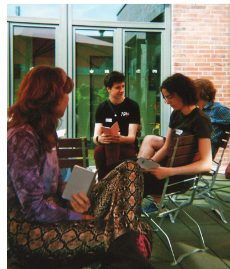
Das Jugendboard für Next!

Im gesellschaftlichen Wandel ist die Teilhabe aller Altersgruppen erklärtes Ziel unserer Vermittlungsarbeit, insbesondere unter Einbezug aktueller gesellschaftlicher und politischer Herausforderungen.