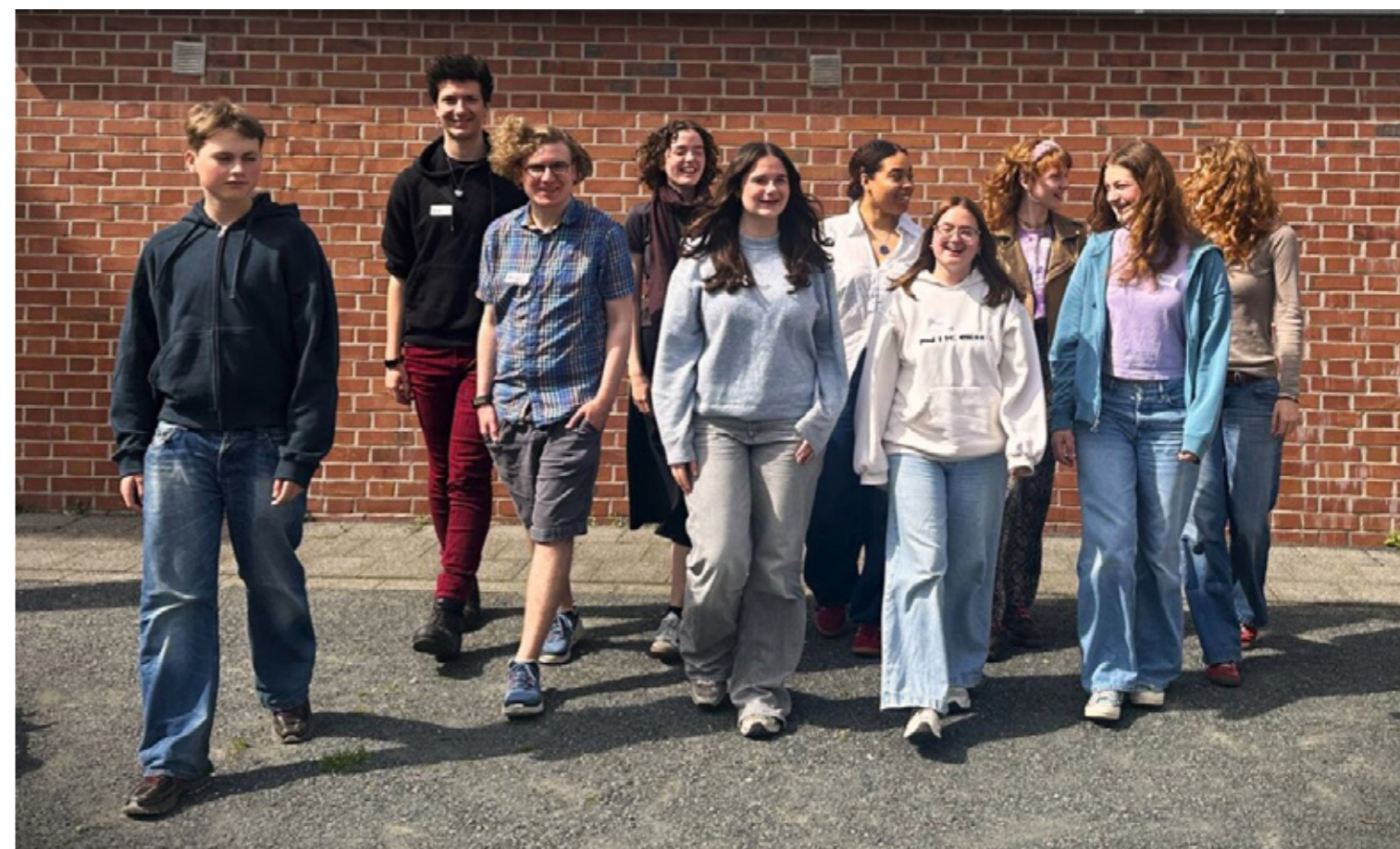
NEXT! Jugendboard

Am Wochenende 13./14. April 2024 traf sich am erstmals das NEXT! Jugendboard im JFC-Medienzentrum in Köln zusammen mit der Fotografin Antonia Gruber. Zehn junge Menschen akquiriert über ein schriftliches Bewerbungsverfahren, brachten ihre Ideen und Gedanken für das nächste NEXT! Fotofestival 2025 ein und werden dem Festival ab 2025 fortan beiseite stehen.