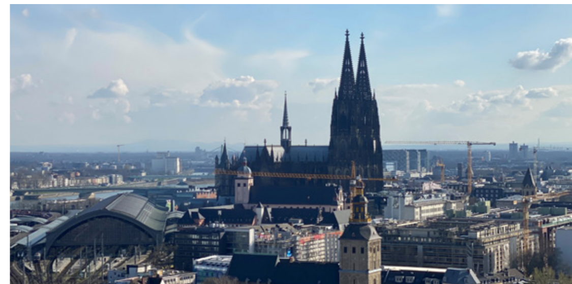
Blick vom Hansa-Hochhaus, Foto: © Priska Höflich

Erstmals arbeiteten wir mit Schüler*innen aus den 9. und 10. Klassen von Gymnasien, Realschulen und Gesamtschulen zusammen. Bei der Täter-Opfer-Tour zu „Lindenthal im Nationalsozialismus“ hielten die Schüler*innen Vorträge und wurden zur Diskussion vor Ort eingeladen, um sich mit dem Schicksal von Holocaust Opfern auseinanderzusetzen.