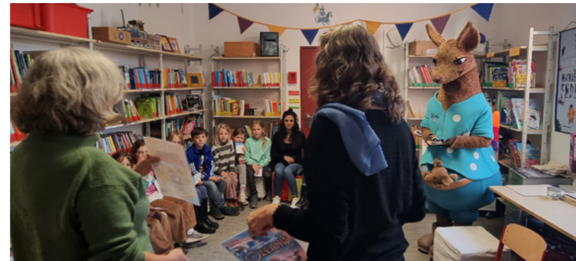
Lesen mit Karla, Foto: © Julia Steinkamp