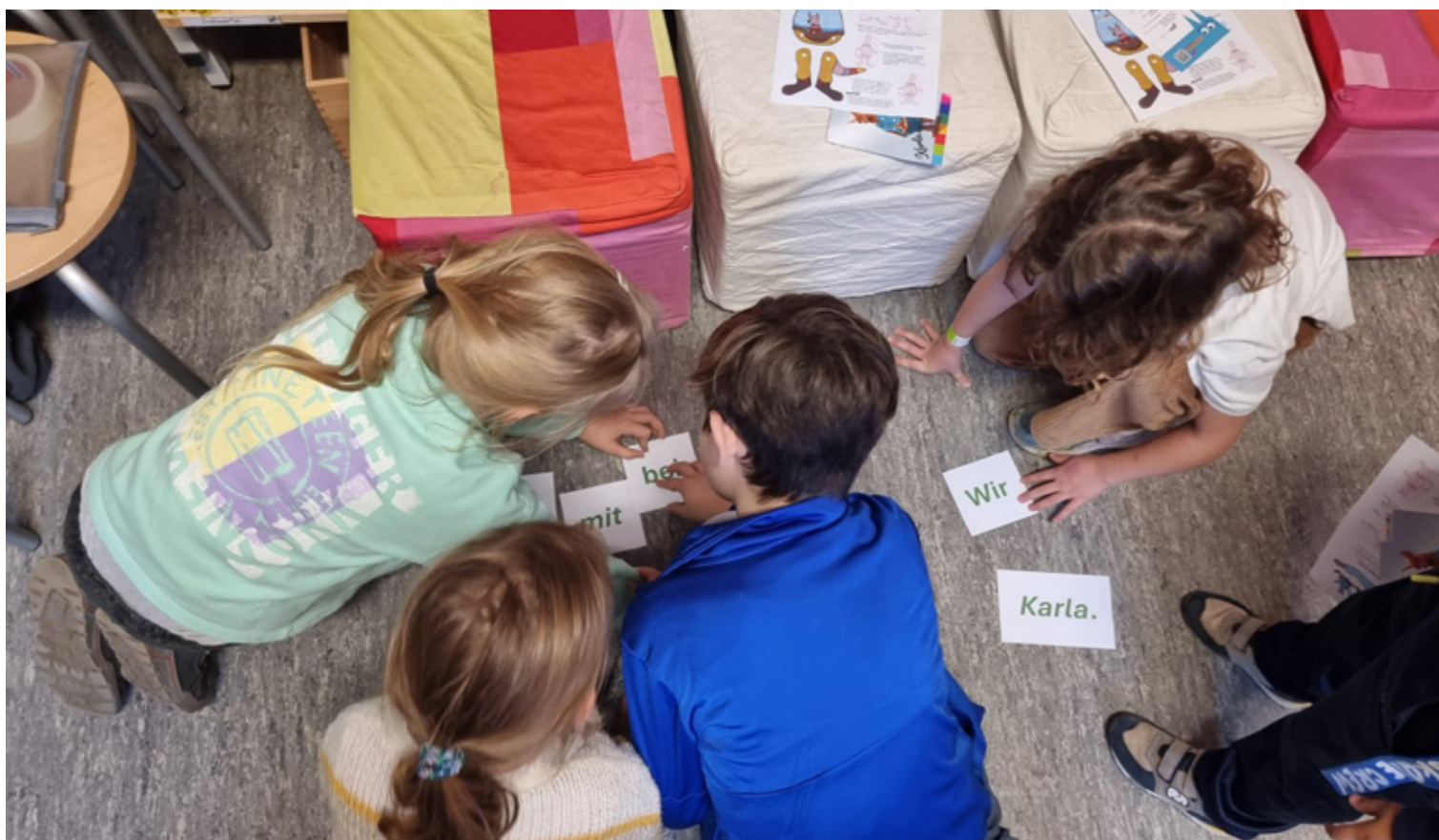
Lesen mit Karla

2003 wurde die Schreibschule ins Leben gerufen, ein Projekt, das Jugendlichen eine Plattform bietet, um unter professioneller Anleitung literarische Texte zu verfassen. Gegründet in Zusammenarbeit mit dem Schriftsteller Dieter Bongartz, legt die Schreibschule den Fokus auf die individuelle Sprachentwicklung und die Fähigkeit, sich kreativ auszudrücken.