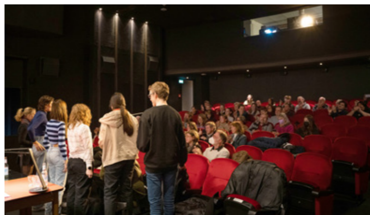
Abschlusslesung der Schreibschule im Kölner Filmhaus