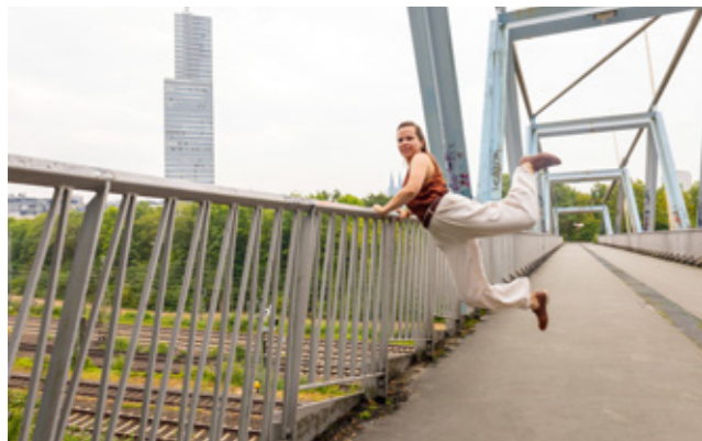
TanzSpaziergang im MediaPark.