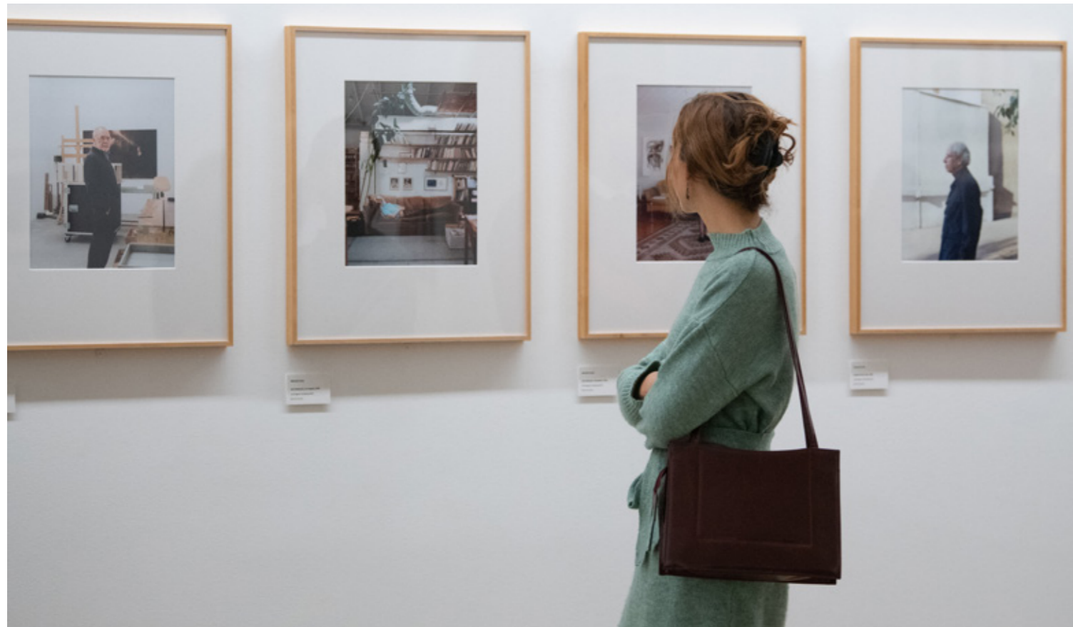
Blick in die Ausstellung „Blick in die Zeit. Alter und Altern im photographischen Portrait“ (Präsentation von Albrecht Fuchs), Photo: © Die Photographische Sammlung/SK Stiftung Kultur; Marie Laforge

Die Ausstellung wurde von der Photographischen Sammlung/SK Stiftung Kultur kuratiert und in Kooperation mit der Stiftung Schloss Neuhausen am Herrenchiemsee ausgerichtet.