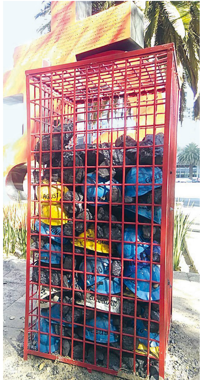
65 Helme zum Gedenken an die Opfer der Katastrophe von Pasta de Conchos. Der Gedenkort wird als „Antimonio“ (Antimonument) verstanden.

Obwohl US-Arbeiter*innen mit der Einführung des RRM im USMCA auch ihre eigenen Interessen – etwa den Schutz vor Lohndumping 1 –