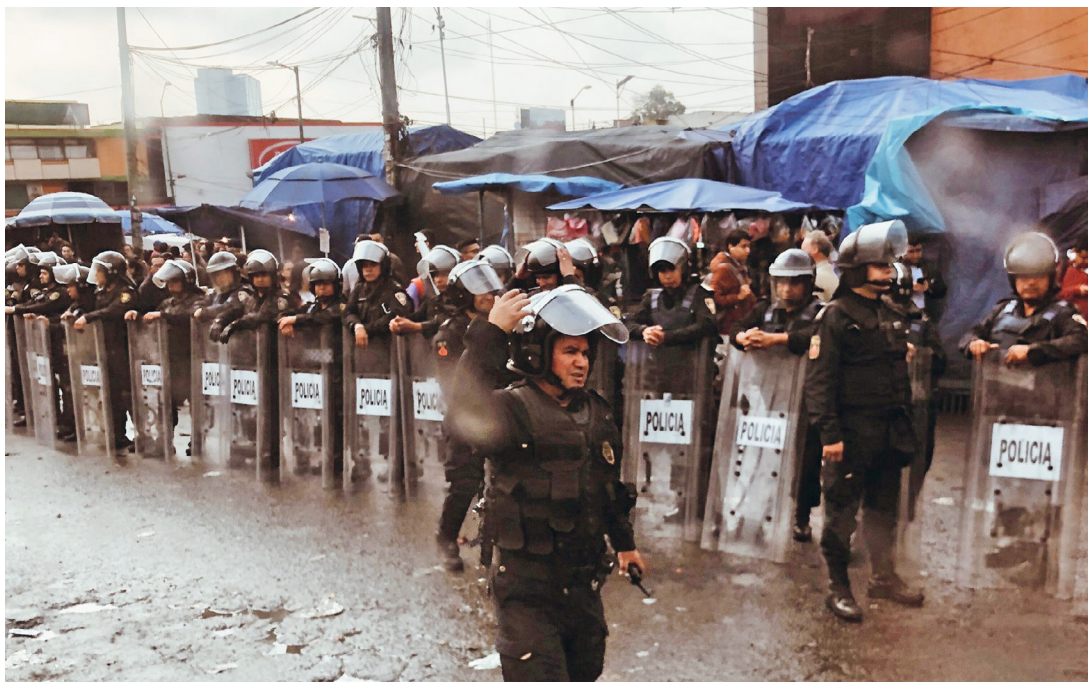
Sicherheitskräfte bei der Auflösung sozialer Proteste in Mexiko.

catecas, Chihuahua, Durango und Guerrero – dominieren die Produktion (U.S. Geological Survey 2025: 14). In diesen Regionen spielt der Bergbau daher eine wirtschaftlich relevante Rolle – sowohl in Bezug auf Beschäftigung als auch auf industrielle Produktion (Secretaría de Economía 2025b).