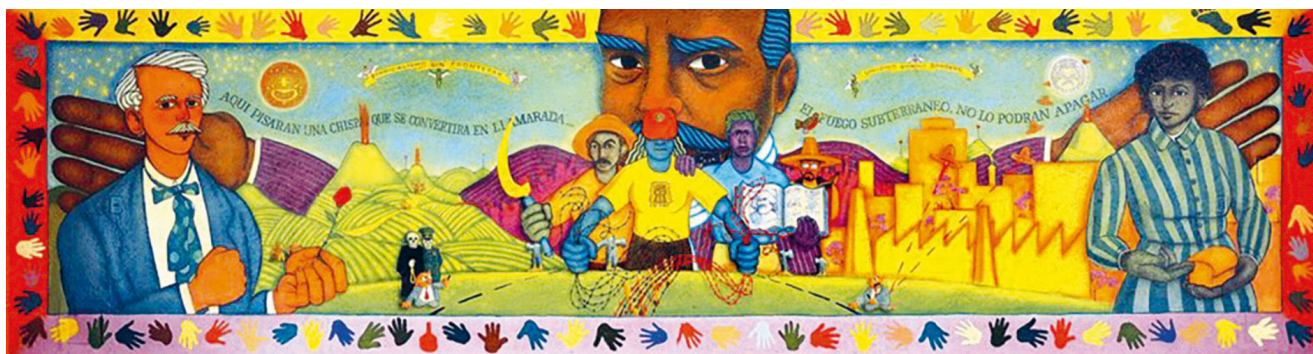
„Sindicalismo sin fronteras“ – Wandgemälde zur Solidarität zwischen mexikanischen und US-amerikanischen Arbeiter*innen, initiiert 1997 von US- und mexikanischen Gewerkschaften.

In diesem Umfeld konnte Grupo México nicht nur die größten Kupferminen des Landes – darunter Buenavista del Cobre (Cananea) – übernehmen, sondern auch eine marktbeherrschende Stellung aufbauen, die durch NAFTA zusätzlich abgesichert wurde. Zugleich profitierte das Unternehmen von der Schwächung unabhängiger Gewerkschaften sowie vom Abbau staatlicher Sicherheits- und Umweltinspektionen, was die Produktionskosten weiter senkte. Die Reformen der 1990er Jahre schufen damit die strukturellen Voraussetzungen für den wirtschaftlichen und politischen Einfluss von Grupo México, dessen dominante Stellung bis heute zentrale soziale, ökologische und arbeitsrechtliche Konflikte im mexikanischen Bergbau prägt.