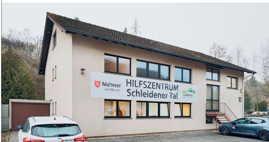
Das HIZ – Hilfszentrum Schleidener Tal

Acht der Ratschläge beziehen sich dabei auf die Arbeit von Krisenstäben, 20 auf grundsätzliche Überlegungen zum Psychosozialen Krisenmanagement. In weiteren rund 20 Empfehlungen wird die Psychosoziale Akuthilfe thematisiert. Darüber hinaus geht es in acht anderen Empfehlungen um die mittel- und längerfristige psychosoziale Versorgung von Betroffenen.