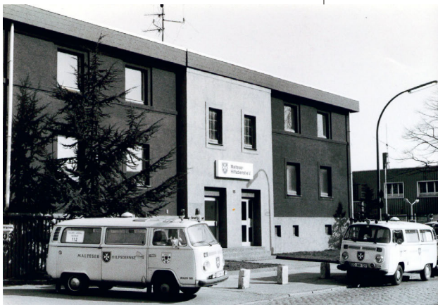
Der Malteser Standort an der Franziusstraße Anfang der 1980er Jahre