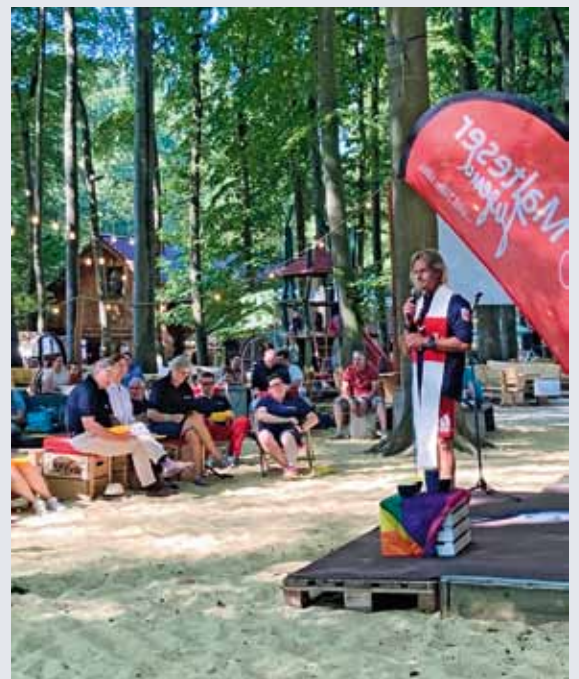
Großes Treffen mit Familien bei Kaiserwetter

Für eine beschwingte Stimmung sorgte die Band „Groovin-a-Box“ mit ihrer handgemachten Livemusik. Dabei spielten sie die größten Hits aus Pop, Rock und Soul der letzten 40 Jahre. Lebhaftige Erinnerungen konnten auch in der Fotoecke erstellt werden. Die entspannte Atmosphäre wurde durch Kinderlachen vom Spielplatz und aus der