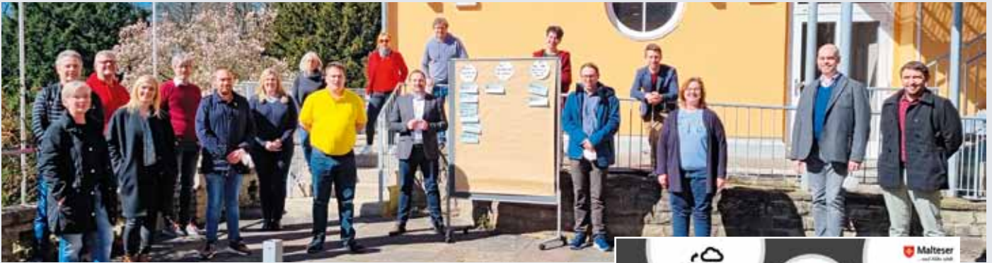
Die Malteser Ausbildungsexperten und -expertinnen und die Moderierenden beim dritten Digitalisierungsworkshop in Königswinter