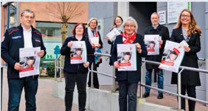
Die Stadt Gladbeck freut sich darauf, das Projekt „Miteinander–Füreinander“ gemeinsam mit den Maltesern umzusetzen.

Im Rahmen des vom Bundesministerium für Familie, Senioren, Frauen und Jugend geförderten Projektes entstehen seit dem vergangenen Jahr bundesweit 112 Projekte, die auf unterschiedliche Weise die Bedürfnisse von Senioren in den Fokus rücken. Im Sommer 2021 starteten die Malteser im Ruhrbistum das Projekt bereits in Gelsenkirchen. Seitdem konnten zahlreichen Senioren wertvolle Hilfestellungen gegeben werden.