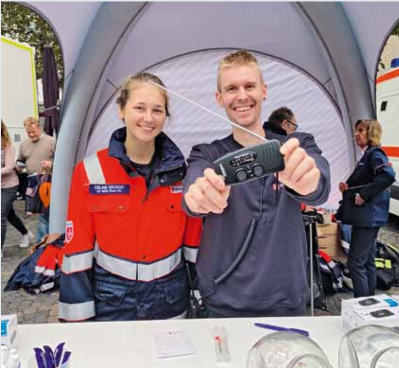
Gute Stimmung am Malteserstand auf dem Münsterplatz in Bonn. Für Besucherinnen und Besucher des Katastrophenschutztages gab es ein Kurbelradio zur Erinnerung.