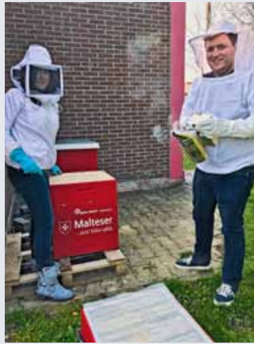
Pioniergeist: Bienenhäuser mit Malteser Logo in Jülich