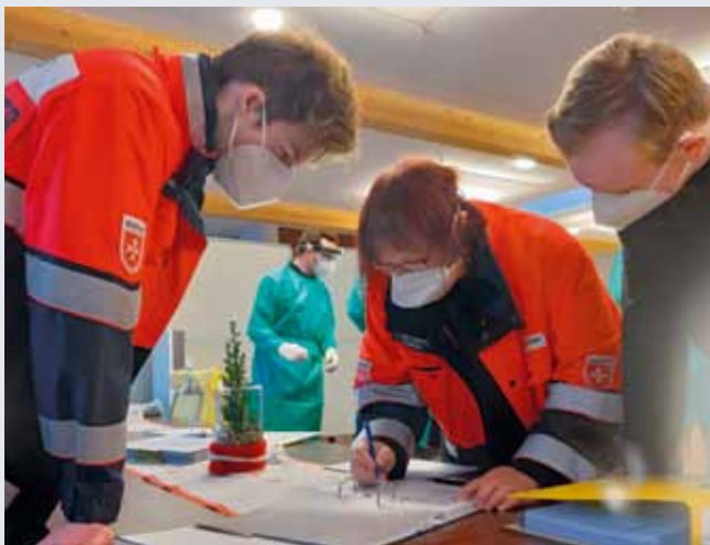
Ehrenamtliche unterstützten zwischen Weihnachten und Neujahr Pflege-Einrichtungen bei der Testung von Besuchern.