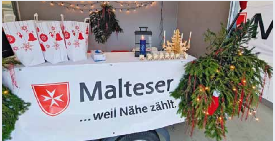
Festlich geschmückter Wagen zur Mahlzeiten-Ausgabe in Netphen

WERL/SOEST. „Einfach nur mal DA SEIN“ lautet das Motto des Soester Wohlfühlmorgens für Mitmenschen