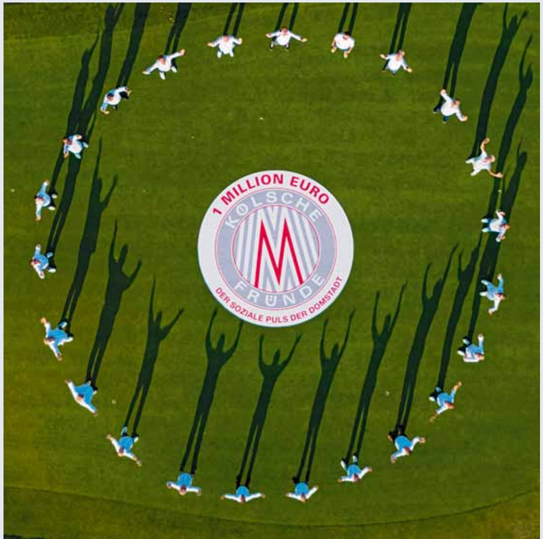
Verlässliches Netzwerk – die Kölschen Fründe machen sich für Projekte der Malteser stark.